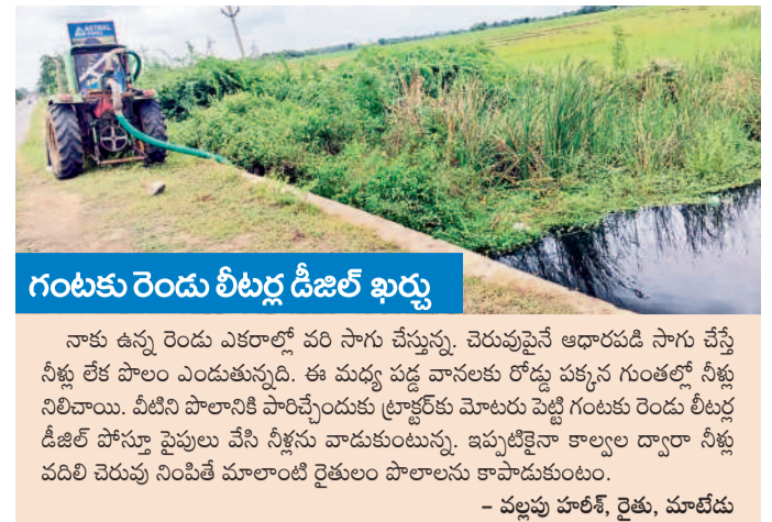
గంటకు రెండు లీటర్ల డీజిల్ ఖర్చు