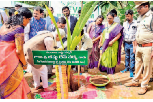
ఓబుల్ కేశాప్రసాద్ గ్రామంలోని వేంకటేశ్వర ఆలయంలో మొక్క నాటుతున్న గవర్నర్