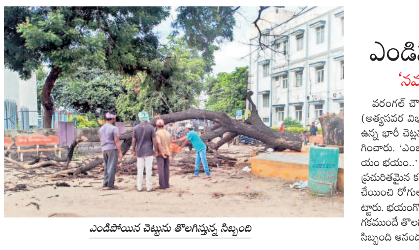
ఎండిపోయిన చెట్టును తొలగిస్తున్న నిబ్బంది

ప్రస్థానం ముగియడంతో ప్రజలు ఒకింత మడసపడుతున్నారు. - దేవయ్యల, ఆగస్టు 29