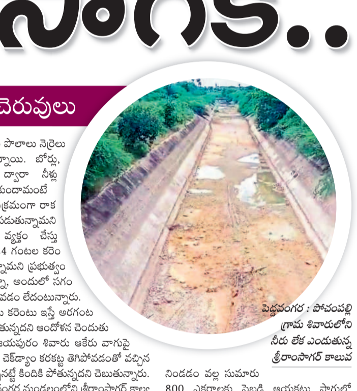
పెద్దవంగర : పోచంపల్లి గ్రామ శివారులోని నీరు లేక ఎండుతున్న శ్రీరాంసాగర్ కాలువ

నిండడం వల్ల సుమారు 800 ఎకరాలకు పైబడి ఆయకట్టు సాగులో ఉండేది. ఈ సందర్భంగా ఆశించిన వర్షాలు కురవక, కాళేశ్వరం జలాల రాక చెరువు కింద వరి సాగు చేస్తున్న రైతులు తీవ్ర ఇబ్బందులు ఎదుర్కొంటున్నారు. చెరువు నిండదేనీ సాగు విస్తీర్ణం తగ్గించుకున్నప్పటికీ వేసిన పంటకు నీరు లేక ఎండిపోతున్నది. వాస్తవానికి చెరువులో జలమట్టం ఆధారంగా పొలాలకు సాగునీటి కోసం క్రమపద్ధతిలో తూముల ద్వారా నీటి విడుదల చేసేవారు. ఆడపాడపా కురుస్తున్న వానలకు రోడ్డు పక్కన గుంతల్లో నిలిచిన నీటిన్నూ వాడుకోవాలని గంటకు రెండు పంటల రూపాయలు ఖర్చు పెట్టి ట్రాక్టర్ల మోటార్లు బిగించి పొలానికి పారించుకోవాల్సిన పరిస్థితి దాపురించింది.