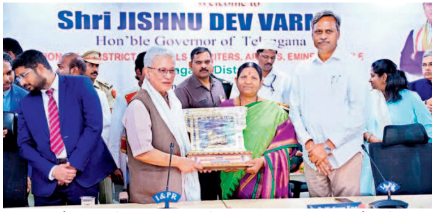
జనగామలో గవర్నర్ జిష్టుదేవ్ వర్మకు జ్ఞాపికను అందజేస్తున్న మున్సిపల్ చైర్మన్ల జమున, చిత్రంలో ఎమ్మెల్యే పల్లా