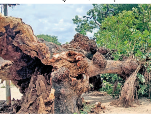
వారు, ఇంతటి పేరున్న ఈ చెట్టు అనుకోకుండా గురువారం మధ్యాహ్నం ఇలా పడిపోయింది. దశాబ్దాలుగా సేవలందిస్తున్న ఈ మహావృక్షం

కామారెడ్డిగూడెంలో గిర్దావర్ చెట్టుగా చెప్పుకునే 150 ఏళ్ల నాటి వేప చెట్టు గురువారం నేలకూలింది. శైజాం జమానాలో ఈ చెట్టు కింద కూర్చొని రెవెన్యూ కార్యకలాపాలు చేసేవారని గ్రామస్థులు చెబుతారు. రైతులు తమ భూముల వివరాలు సేకరించడం, శిష్య పనుల్లోను పట్టాల్లో ఈ చెట్టు కింద చేసేవారని అంటారు. కాలక్రమేణా ఈ చెట్టు గిర్దావర్ చెట్టుగా రూపాంతరం చెందగా, గ్రామస్థులు తమ పంచాయతీ తీలను ఈ చెట్టు కింద పెట్టుకునే