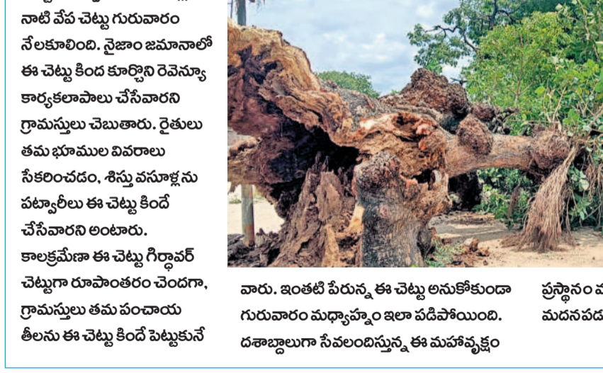
వారు, ఇంతటి పేరున్న ఈ చెట్టు అనుకోకుండా గురువారం మధ్యాహ్నం ఇలా పడిపోయింది. దశాబ్దాలుగా సేవలందిస్తున్న ఈ మహావృక్షం