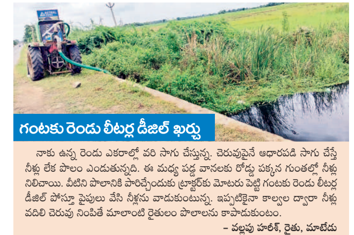
గంటకు రెండు లీటర్ల డీజిల్ ఖర్చు

నాకు ఉన్న రెండు ఎకరాల్లో పరి సాగు చేస్తున్నా. చెరువుపైనే ఆధారపడి సాగు చేసే నీళ్లు లేక పొలం ఎందుతున్నది. ఈ మధ్య పడ్డ వానలకు రోడ్డు పక్కన గుంతల్లో నీళ్లు నిలిచాయి. వీటిని పొలానికి పారించేందుకు ట్రాక్టర్లకు మోలారు పెట్టి గంటకు రెండు లీటర్ల డీజిల్ పోస్తూ పైవులు వేసి నీళ్లను వాడుకుంటున్నా. ఇప్పటికైనా కాల్యాల ద్వారా నీళ్లు వదిలి చెరువు నింపితే మూలాంటి రైతులం పొలాలను కాపాడుకుంటాం.