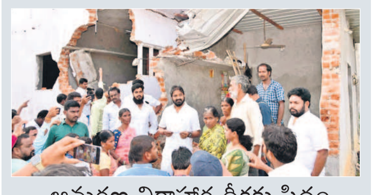
ఆమరణ నిరాహార దీక్షకు సిద్ధం

మహబూబ్ నగర్ మున్సిపాలిటీ, ఆగస్టు 29 : మహబూబ్ నగర్ జిల్లా కేంద్రం సమీపంలోని శ్రీనివాసపల్లిలో అక్రమ నిర్మాణాల వేరేండ్లకు అధికారులు అర్హత పలు ఇండ్లను కూల్చివేశారు. సర్వే నెంబర్ 5293లో ఉన్న 70కి పైగా ఇండ్లను బుల్డోజర్లు జేసేటే సాయంతో నేలమట్టం చేశారు. పోలీస్, రెవెన్యూ, మున్సిపల్ కార్పొరేషన్ల సహకారంతో మహబూబ్ నగర్ అర్బన్ టాన్సిల్లారు, రెవెన్యూ అధికారులు ఈ చర్యలకు పాల్పడినట్లు స్థానికులు తెలిపారు. నేలమట్టం అయిన వాటిలో 25 నిర్మాణాలు దివ్యాంగులు, అందరికీ సంబంధించిన నవే ఉండటం విశేషం. ఏదిఏమైనా అక్రమ నిర్మాణాల వేరేండ్లకు నిరసన వ్యక్తం చేసిన వారిపై చర్యలు తీసుకుంటున్నట్లు తెలుస్తోంది.