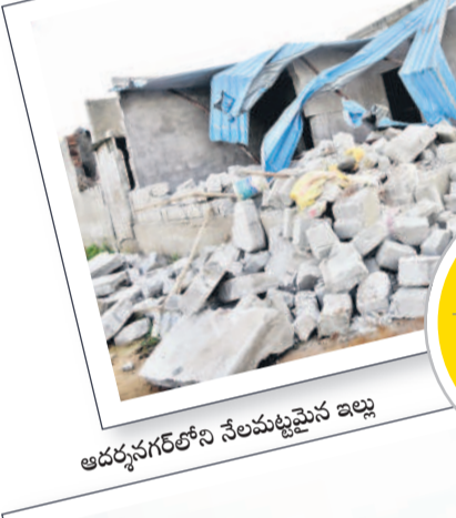
ఆదర్శనగర్లోనే నేలమట్టమైన ఇల్లు