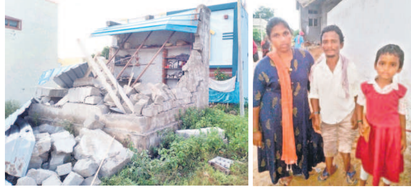
నేలమట్టమైన బోజానాయక్ ఇల్లు భార్య, కూతురుతో బోజానాయక్