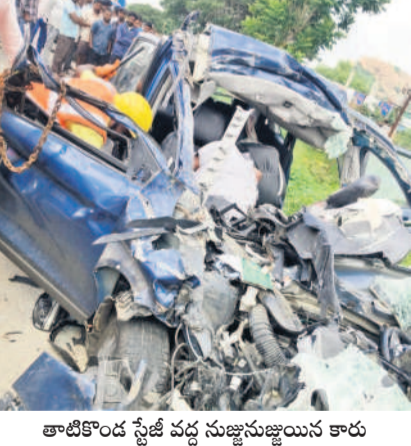
తాటికొండ స్టేజ్ వద్ద సుజ్జనుజ్జులను కారు