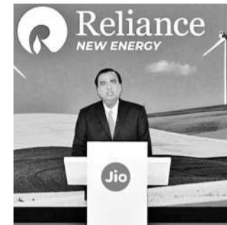
లగ్జరీ నగల వ్యాపారంలోకి..

రిలయన్స్ కొత్త శిఖరాలను అధిరోపించగలదు' అని ముకేష్ చెప్పారు.