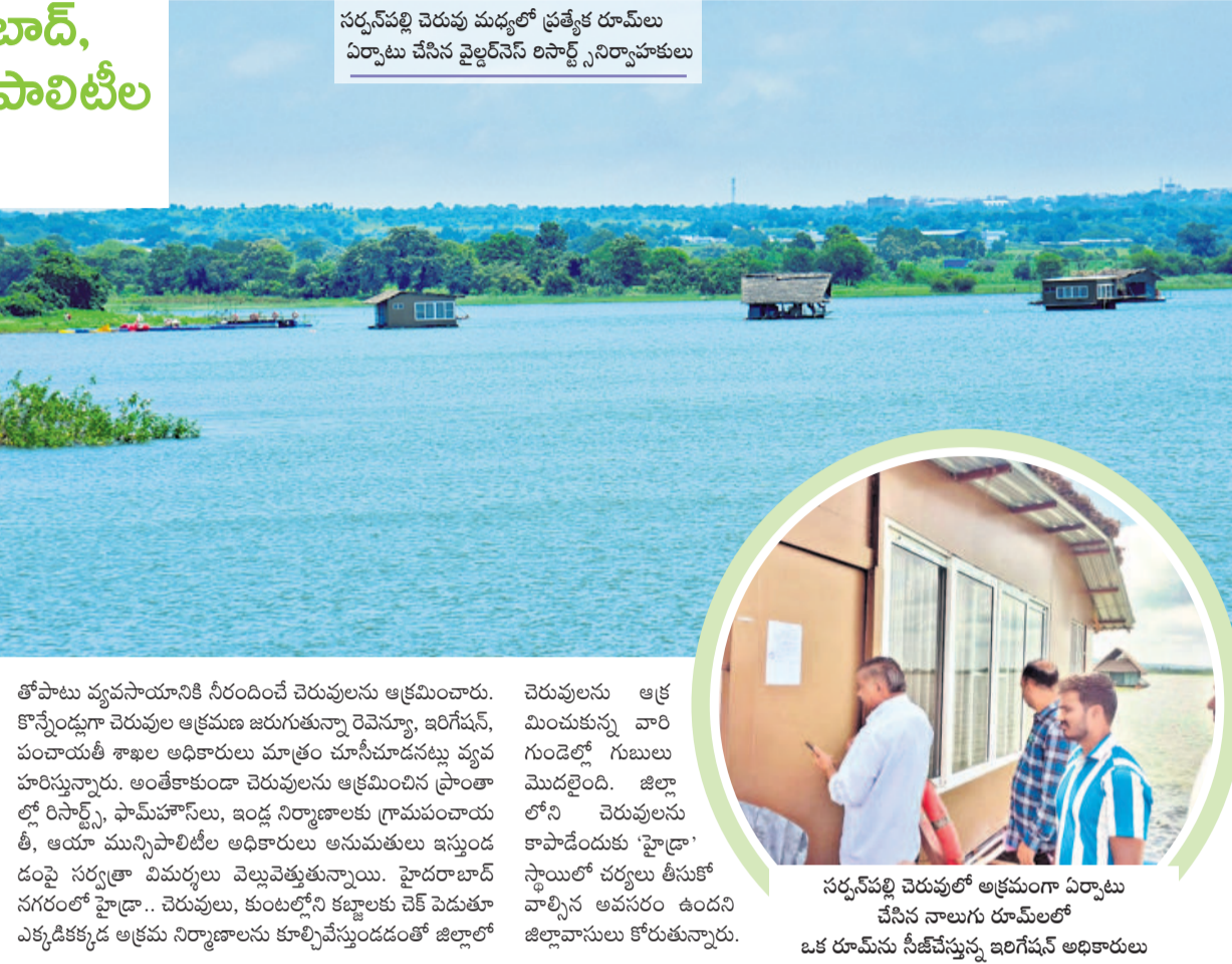
సర్వనపల్లి చెరువు మధ్యలో ప్రత్యేక రూములు ఏర్పాటు చేసిన వైల్డర్నెస్ రిసార్ట్స్ నిర్మాణాలు

వికారాబాద్, ఆగస్టు 29 (నమస్తే తెలంగాణ): జిల్లాలోని మున్సిపాలిటీల పరిధిలోని చెరువులు, ప్రాజెక్టులు కట్టలకు గురయ్యాయి. జిల్లాలోని వికారాబాద్, పరిగి, తాండూరు మున్సిపాలిటీల్లోని చెరువులను కొందరు యజమాన్లు చెరువల్లారు. గత బీఆర్ఎస్ ప్రభుత్వం మున్సిపల్ కాంట్రాక్టర్లకు కార్పొరేషన్లు చేపట్టి చెరువులను అభివృద్ధి చేస్తే, వాటి హద్దులను గుర్తించాలన్న రెవెన్యూ అధికారుల నిర్ణయాన్ని అసరాగా చేసుకుని ఆక్రమణదారులు వికారాబాద్, పరిగి, తాండూరు మున్సిపాలిటీల పరిధిలోని పలు చెరువులను కట్టలు చేసి, పలు భవనాలను నిర్మించారు. చెరువుల ఎఫ్ఓపీఎల్, బఫర్ జోన్ల