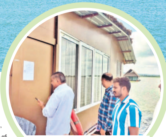
సర్వనపల్లి చెరువులో అక్రమంగా ఏర్పాటు చేసిన నాలుగు రూములలో ఒక రూమ్ ను సీజ్ చేస్తున్న ఇరిగేషన్ అధికారులు