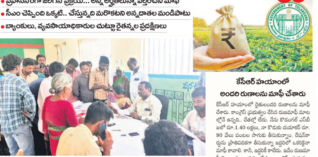
హన్మంతరావు గ్రామంలో రుణమాఫీ కాని రైతు కుటుంబాల వివరాలను సేకరిస్తున్న వ్యవసాయాధికారులు

సేకరించి యాదో నమోదు చేస్తున్నారు. వ్యవసాయాధికారుల వద్ద రైతులకు సంబంధించిన పూర్తి వివరాలున్నా అర్హతలకు రుణమాఫీ కాలేదని.. ఇప్పుడు నిర్వహిస్తున్న ప్యామిలీ గ్రూపింగ్ సర్వేలో అర్హత కలిగిన అందరి రుణాలు మాఫీ అవుతాయా..? అని ప్రశ్నిస్తున్నారు. ప్రభుత్వం రుణమాఫీ అంశాన్ని కాలయాపన చేసేందుకు ఈ సర్వేను చేపట్టిందని పలువురు రైతులు మండిపడుతున్నారు. ప్రభుత్వం ఇచ్చిన హామీ ప్రకారం రైతులందరి రుణాలను ఎలాంటి షరతుల్లేకుండా మాఫీ చేయాలని డిమాండ్ చేస్తున్నారు.