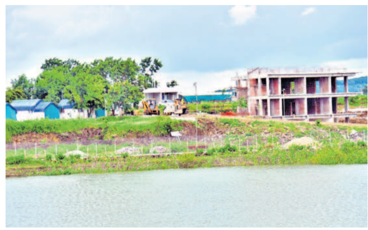
సర్వనపల్లి చెరువు ఎఫ్ఓపీఎల్, బఫర్ జోన్లలో జోరుగా సాగుతున్న నిర్మాణాలు