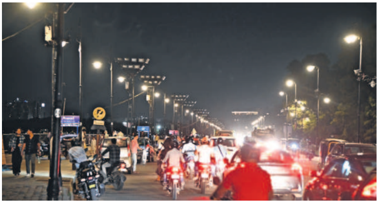
గణేశ నవరాత్రులు.. నిమజ్జనోత్సవాల తోసం ట్యాంక్ బండ్ ముస్తాబవుతున్నది. ఇందులో భాగంగా ప్రత్యేకంగా విద్యుత్ బీమాను ఏర్పాటు చేశారు.