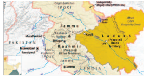
ఉన్నాయి. ఈ ప్రాంతం కేంద్ర హోంమంత్రిత్వ శాఖ పరిధిలో ఉంటుంది. తాజా నిర్ణయంతో జిల్లాల సంఖ్య ఏడుగు పెరగనున్నాయి.