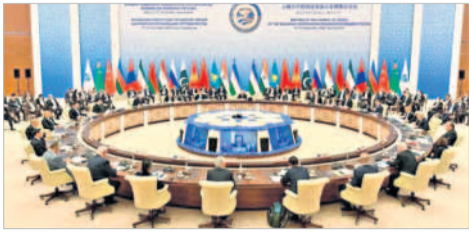
అవకాశం ఉంటుంది. గతంలో కజకిస్తాన్లో జరిగిన దేశ ప్రభుత్వాధినేతల సమావేశానికి సార్వత్రిక ఎన్నికల నేపథ్యంలో ప్రధాని మోదీ రూరంగా ఉన్నారు. ఆయన స్థానంలో విడికాంగ్ మంత్రి జైకంకర్ హాజరయ్యారు.