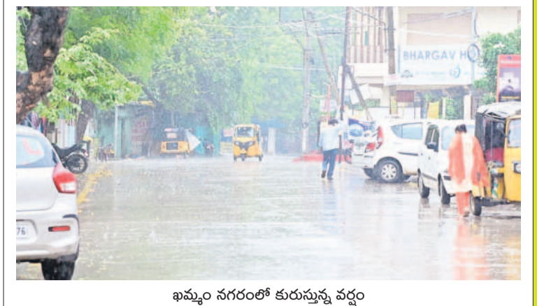
ఐమ్మం నగరంలో కురుస్తున్న వర్షం