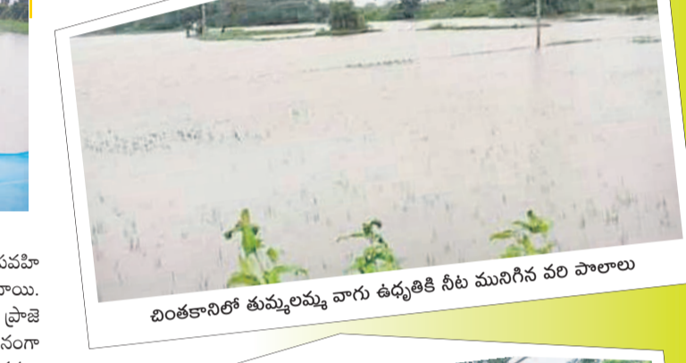
బింతకానిలో తుమ్మలమ్మ వాగు ఉధృతికి నీటి మునిగిన వరి పొలాలు