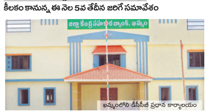
ఐమ్మం లోని డీసీసీబీ ప్రధాన కార్యాలయం

రూ.50 వేల నుంచి రూ.2 లక్షలకు మారిన బీమాప్రగడ ఐదు నెలల నుంచి అనేక వివాదాలను మూటగట్టుకుంటున్న డీసీసీబీ పాలకవర్గం వర్సెస్ బ్యాంకు అధికారులు