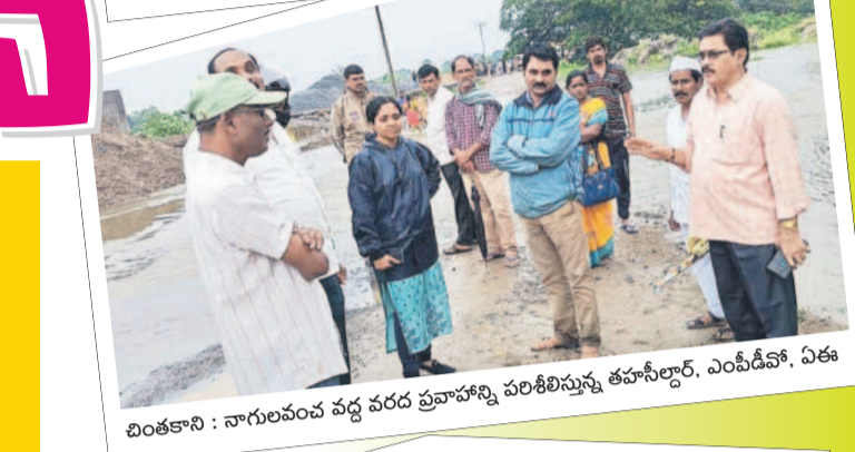
బింతకాని : నాగులవంప వద్ద వరద వ్రాహ్మణి పరిశీలిస్తున్న తహసీల్దార్. ఎంపీడివో, ఏఈ

ఐమ్మం జిల్లాలో... ఐమ్మం నగరంలో లోతట్లు ప్రాంతాలు ప్రవహించడం వల్ల జగ్గయ్యపేటకు వెళ్లే మార్గంలో రోడ్డు మార్గంలో రాకపోకలు నిలిచిపోయాయి. బేతుపల్లి వెళ్లెవెరువు, మదిర చెరువు, సత్తుపల్లి, అక్కారాపువేల, మణుగూరు ప్రాంతాల్లో చెరువులు, కుంటలు పూర్తి జలకళను సంతరించుకున్నాయి. భోసల్, వేంసూరు మండలాల్లో చెరువులు అలుగు దశకు చేరుకున్నాయి. పక్షం రోజుల తర్వాత వరుణుడు కరుణించడంతో పూస, పత్తి పంటలు ప్రాణం పోసుకుంటున్నాయి.