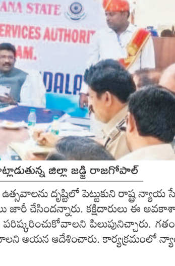
మాట్లాడుతున్న జిల్లా జడ్జి రాజగోపాల్

ఐమ్మం లోక్ అదాలత్, ఆగస్టు 31 : జిల్లావ్యాప్తంగా ఈ నెల 28న జాతీయ లోక్ అదాలత్ నిర్వహిస్తున్నామని, దీనిని విజయవంతం చేయాలని ఐమ్మం జిల్లా జడ్జి జి.రాజగోపాల్ పిలుపునిచ్చారు. జాతీయ లోక్ అదాలత్పై తీసుకోవాల్సిన చర్యలు, న్యాయాధికారులతో ఐమ్మం నగరంలోని కోర్టు ప్రాంగణంలో శనివారం ఆయన సమావేశం నిర్వహించారు. ఈ సందర్భంగా జడ్జి మాట్లాడుతూ వాస్తవానికి ఈ నెల 14న జాతీయ లోక్ అదాలత్ నిర్వహించాల్సి ఉంది, అయితే గతే ఉత్సాహాలను దృష్టిలో పెట్టుకుని రాష్ట్ర న్యాయ సేవాధికార సంస్థ ఈ నెల 28వ తేదీకి మార్చినట్లు అధికారులు జారీ చేసినట్లున్నారు. కక్షిదారులు ఈ అవకాశాన్ని సద్వినియోగం చేసుకొని అధిక సంఖ్యలో కేసులను పరిష్కరించుకోవాలని పిలుపునిచ్చారు. గతంలో కంటే ఈసారి సంఖ్యలో కేసులను పరిష్కరించాలని ఆయన ఆదేశించారు. కార్యక్రమంలో న్యాయ మూర్తులు, పోలీసు అధికారులు పాల్గొన్నారు.