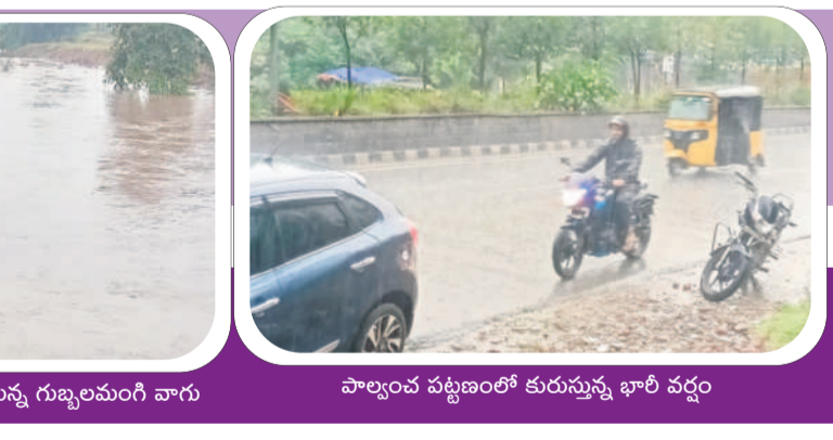
పాల్వంచ పట్టణంలో కురుస్తున్న భారీ వర్షం

బొగ్గు ఉత్పత్తికి అంతరాయం సత్తుపల్లి టౌన్ : కిన్నెరసాని ఓసీలో చేరిన వర్షపు నీరు మణుగూరు టౌన్/సత్తుపల్లి టౌన్, ఆగస్టు 31 : మణుగూరు, సత్తుపల్లి మండలాల్లోని సింగరేణి ప్రాంతంలో శనివారం బొగ్గు ఉత్పత్తికి తీవ్ర అంతరాయం కలిగింది. మణుగూరు ఓసీ-4లో భారీవర్షం నీరు నిలవడంతో నీటి మట్టంపునకు ప్రత్యేక చర్యలు చేపట్టారు. జలగం వెంగళరావు ఓసీలో 30 వేల టన్నుల బొగ్గు ఉత్పత్తికి అంతరాయం ఏర్పడడంతోపాటు, 1,40,000 క్యూబిక్ మీటర్ల మట్టిని తొలగించే పనులకు, కిన్నెరసాని ఓసీలో 5 టన్నుల బొగ్గు ఉత్పత్తికి, 25 వేల క్యూబిక్ మీటర్ల మట్టి తొలగించే పనులకు అటంకం ఏర్పడినట్లు సింగరేణి ప్రాజెక్టు అధికారి నరసింహారావు తెలిపారు.