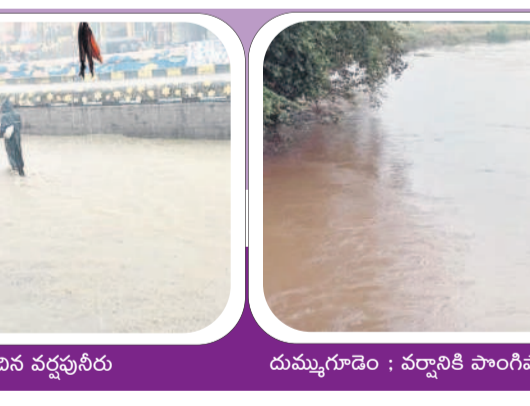
దుమ్మగూడెం : వర్షానికి పొంగిపొద్దుతున్న గుబ్బలమంగి వాగు