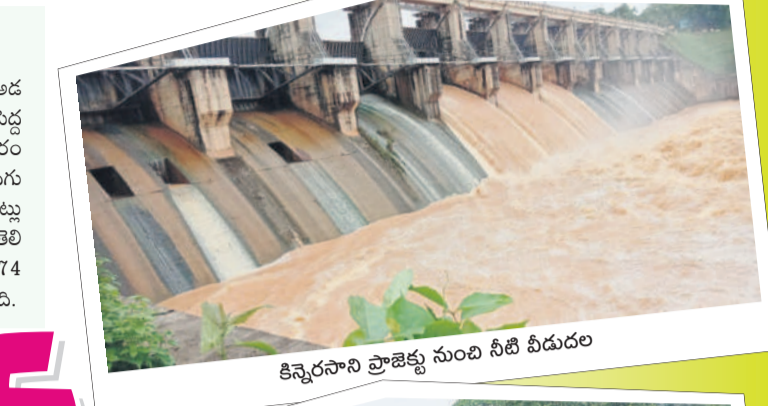
కిన్నెరసాని ప్రాజెక్టు నుంచి నీటి విడుదల