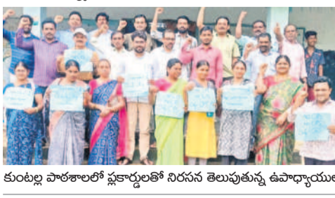
కుంటల్ల పాఠశాలలో ప్రణాళికలతో నిరసన తెలుపుతున్న ఉపాధ్యాయులు