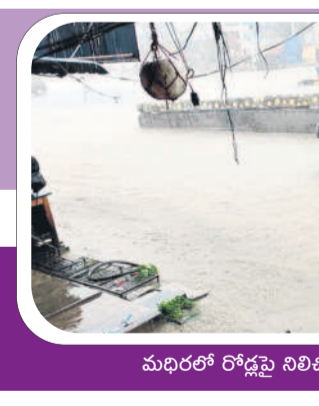
మధిరలో రోడ్డుపై నిలిచిన వర్షపునీరు

ప్రజలు అప్రమత్తంగా ఉండాలి మంతులు తుమ్మల, పొంగలేటి ఐమ్మం, ఆగస్టు 31 : భారీ వర్షాలు కురుస్తున్న నేపథ్యంలో అధికార అంశాంగం, ప్రజలు అప్రమత్తంగా ఉండాలని రాష్ట్ర వ్యవసాయశాఖ ఉపాధ్యక్షులు నాగేశ్వరరావు, రెవెన్యూ, గృహ నిర్మాణం, సమాచారశాఖ మంత్రి పొంగలేటి శ్రీనివాసరెడ్డి శనివారం వేదేయ ప్రకటనలో పేర్కొన్నారు. ఐమ్మం, భద్రాద్రి కొత్తగూడెం జిల్లా కలెక్టర్లు, ఐమ్మం మున్సిపల్ కార్పొరేషన్ కమిషనర్ల ఎప్పటికప్పుడు జిల్లాలోని పరిస్థితుల్లో హెల్త్ వెంటనే చర్యలు తీసుకోవాలని ఆదేశించారు. అత్యవసర పరిస్థితుల్లో హెల్త్ లైన్ సెంటర్లను సంప్రదించాలని ప్రజలకు సూచించారు.