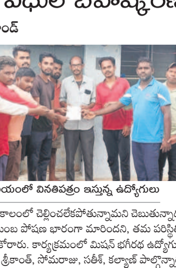
కార్యాలయంలో వినతిపత్రం ఇస్తున్న ఉద్యోగులు