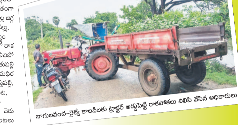
నాగులవంప-చైల్డ్రె కాలనీలకు ట్రాక్టర్ అడ్డుపెట్టి రాకపోకలు నిలిచి వేసిన అధికారులు

ప్రజలు అప్రమత్తంగా ఉండాలి మంతులు తుమ్మల, పొంగలేటి ఐమ్మం, ఆగస్టు 31 : భారీ వర్షాలు కురుస్తున్న నేపథ్యంలో అధికార అంశాంగం, ప్రజలు అప్రమత్తంగా ఉండాలని రాష్ట్ర వ్యవసాయశాఖ ఉపాధ్యక్షులు నాగేశ్వరరావు, రెవెన్యూ, గృహ నిర్మాణం, సమాచారశాఖ మంత్రి పొంగలేటి శ్రీనివాసరెడ్డి శనివారం వేదేయ ప్రకటనలో పేర్కొన్నారు. ఐమ్మం, భద్రాద్రి కొత్తగూడెం జిల్లా కలెక్టర్లు, ఐమ్మం మున్సిపల్ కార్పొరేషన్ కమిషనర్ల ఎప్పటికప్పుడు జిల్లాలోని పరిస్థితుల్లో హెల్త్ వెంటనే చర్యలు తీసుకోవాలని ఆదేశించారు. అత్యవసర పరిస్థితుల్లో హెల్త్ లైన్ సెంటర్లను సంప్రదించాలని ప్రజలకు సూచించారు.