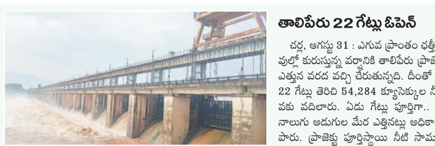
చర్ల : తాపీపేరు నుంచి నీటి విడుదల