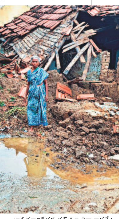
భారీ వర్షాలకి వరంగల్ జిల్లా చెన్నారావుపేట మండల కేంద్రంలో కూలిన కట్టె ముఖ్య ఇల్లు

కరీంనగర్లో కూలిన దేవాలయం పైకెక్కా.. నల్లగొండలో కొట్టుకుపోయిన వంతెన ఇంటిపైకెక్కా కూలి ఒకరు.. పిడుగుపాటుకు మరొకరు.. కరెంట్ పాకేతో ఇంకొకరు మృతి సంగరేశిలో నిలిచిన బొగ్గు ఉత్పత్తి.. శ్రీశైలం ప్రాజెక్టుకు 4.10 లక్షల క్యూసెక్కుల వరద లో తట్టు ప్రాంతాల ప్రజలను తరలించండి కలెక్టరేట్లో కంట్రోల్ రూమ్లు ఏర్పాటుచేయండి తక్షణ సహాయ చర్యలు చేపట్టండి. సీఎం రేవంత్ అధికారులు సెలవులు పెట్టడం: మంత్రుల ఆదేశాలు రెన్యూకు 24 బోర్డుతో నిర్ణయం: లిగ్నిమాపకశాఖ ఏపీలో ఎడతెరిపేని వర్షాలు.. వలు రైళ్లు రద్దు విరిగిపడిన కొండ చరియలు.. నలుగురు మృతి ఆరేబియా సముద్రంలో ఏర్పడిన అస్సా తుఫాను ప్రభావంతో తెలంగాణ వ్యాప్తంగా భారీ వర్షాలు కురుస్తున్నాయి. మరో రెండ్రోజులు భారీ నుంచి అత్యంత భారీ వర్షాలు కురిసే అవకాశం ఉన్నదన్న వాతావరణశాఖ హెచ్చరికలతో అప్రమత్తమైన ప్రభుత్వం ముందస్తు చర్యలు ప్రారంభించింది. కలెక్టరేట్లో కంట్రోల్ రూమ్లు ఏర్పాటు చేయాలని ఆదేశించింది. ఇంకెవరో, హెల్త్ సిబ్బందికి సెలవులు రద్దుచేసింది. అత్యవసర పరిస్థితిని ఎదుర్కొనేందుకు ఎన్ఐఆర్ఎఫ్ 50 మంది సిబ్బందితో 24 రెన్యూబ్ల బోర్డును సిద్ధం చేసింది. మరోవైపు, ఎడతెరిపేని వర్షాలతో జనజీవనం అతలాకుతలమైంది. రాష్ట్రవ్యాప్తంగా ముగ్గురు ప్రాణాలు కోల్పోయారు. రవాణావ్యవస్థ అతలాకుతలమైనది. >10