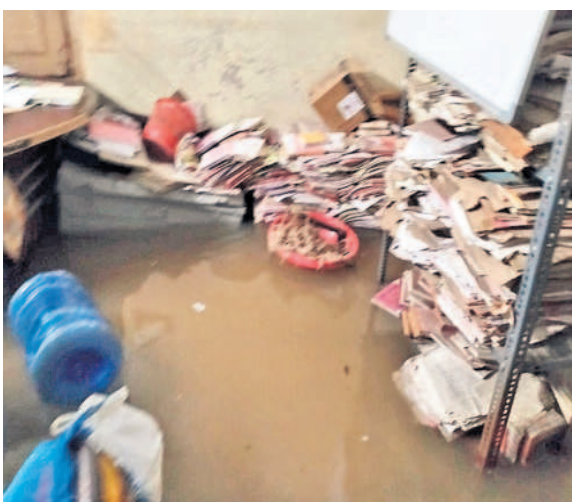
సూర్యాపేట జిల్లా కోదాడ మునిసిపల్ కార్యాలయంలోకి చేసిన వర్షపు నీటిలో ఆడిన సైబ్బంది