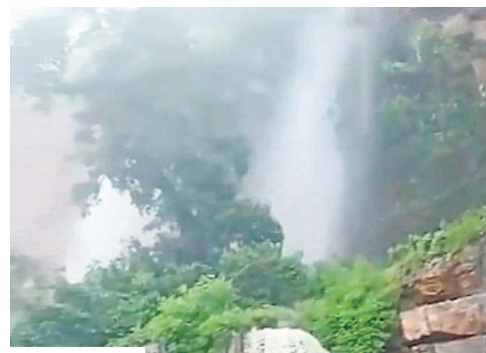
శ్రీశైల మాధవంలోని ఉమామహేశ్వర ఆలయం వద్ద గుట్టపై నుంచి జాలువారుతున్న జలధార (ఇన్సెట్ లో) నీటి మునిగిన ఉమామహేశ్వర ఆలయం