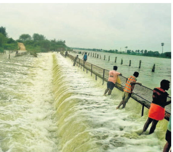
మహబూబాబాద్ జిల్లా తోరూరు మండలంలో మత్తడి పోస్టును అమెల్యేలచే చెరువు