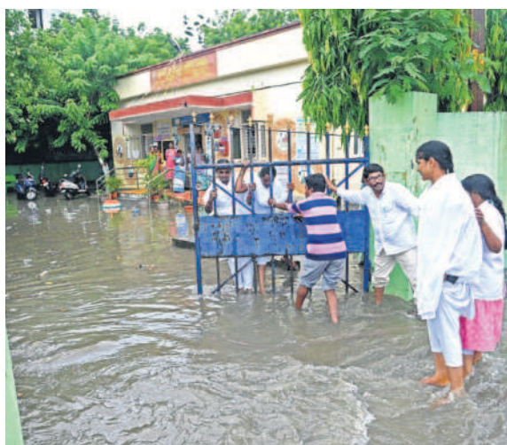
నల్లగొండ జిల్లా కేంద్రంలోని పానగల్ పట్టణ ఆరోగ్య కేంద్రంలోకి వచ్చిన నీరు చేరడంతో బయటకు వస్తున్న వైద్య సిబ్బంది