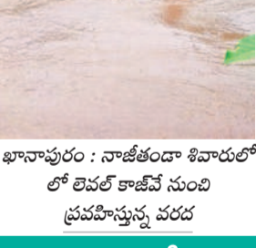
ఖానాపూరు : నాజీబ్ దాద్ శివారులో లోలవల్ కాజీవీ సుందీ ప్రవహిస్తున్న వరద

నమస్తే తెలంగాణ నెట్ వర్క్ : ఉమ్మడి వరంగల్ జిల్లావ్యాప్తంగా భారీ వర్షం కురిసింది. శుభ్ర వారం రాత్రి నుంచి శనివారం పొద్దుతా కురిసిన వానకు వాగులు, వంకలు ఉప్పొంగాయి. మంట పొలాలు నీటమునిగగా, లోతట్టు ప్రాంతాలు జలమయమయ్యాయి. ఇండ్లలోకి నీరు చేరి ప్రజలు ఇబ్బందిపడ్డారు. కర్ణాటక, రహదారిపై నుంచి వరద పోటోషడంతో పలు ప్రాంతాలకు రాకపోకలు నిలిచిపోయాయి. వరంగల్ జిల్లాలో సగటు వర్షపాతం 5.96 సెంటీమీటర్లు కాగా, అత్యధికంగా నిక్కొండ