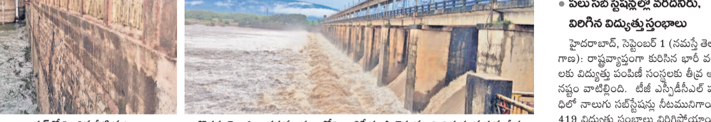
కరీంనగర్ శివారులోని ఎలంపేట రిజర్వాయర్లో పెరిగిన నీటి మట్టం

● శ్రీశైలనికి 4.96 లక్షల క్యూసీక్యులు ● సాగర్ కు 4.83.766 క్యూసీక్యులు హైదరాబాద్, సెప్టెంబర్ 1 (నమస్తే తెలంగాణ): హైదరాబాద్ నగరంలోని వర్షాలతో కృష్ణమ్మ ఉప్పొంగి ప్రమాదాన్ని పాలయ్యింది. అదివారం జారాలకు 3,80,200 క్యూసీక్యులు, శ్రీశైలం ప్రాజెక్టుకు 4.96 లక్షల క్యూసీక్యులు, నాగార్జునసాగర్ కు 4,83,766 క్యూసీక్యులు వరద వచ్చి చేరుతున్నది. గోదావరి టెసిస్ లోని శ్రీరాంసాగర్ ప్రాజెక్టుకు 80,419 క్యూసీక్యులు, కడప ప్రాజెక్టుకు 78 వేల క్యూసీక్యులు ప్రవాహం కొనసాగుతుండగా, ఎల్లంపల్లికి 1.48 లక్షల ప్రవాహం వస్తున్నది. సింగూర్ కు 13,076 క్యూసీక్యులు, నిజాంసాగర్ కు 28,900 క్యూసీక్యులు ఇన్ ఫ్లో నమోదైంది. కాగా భద్రాద్రి కొత్తగూడెం జిల్లాలోని తాలిపేట ప్రాజెక్టుకు వరద పోవడంతో మొత్తం 25 గిట్లకు గాను