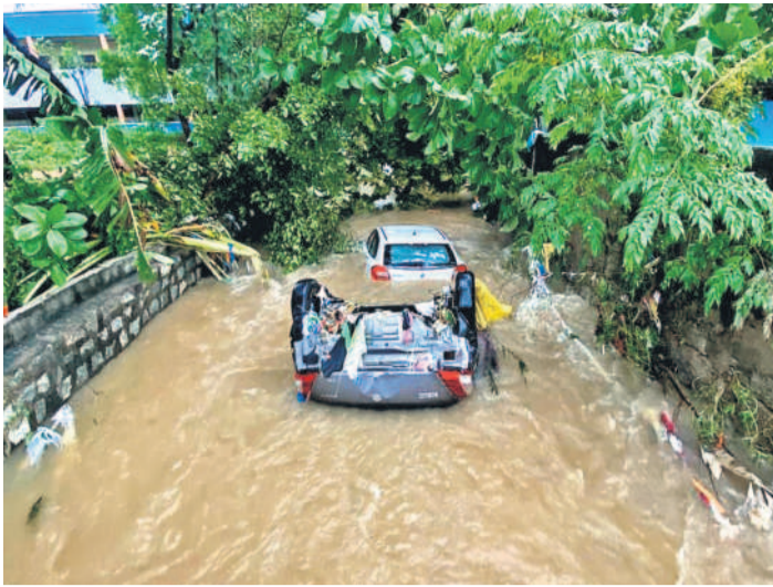
అదివారం కురిసిన భారీ వర్షానికి సూర్యాపేట జిల్లా కోదాడలో కొట్టుకుపోయిన కార్లు