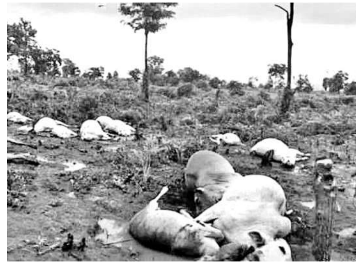
భద్రాద్రి కొత్తగూడెం జిల్లా బూర్గంపహాడీ మండలం ఊర్ల దోసపాడులో వరద తాకిడికి మృతిచెందిన పశువులు