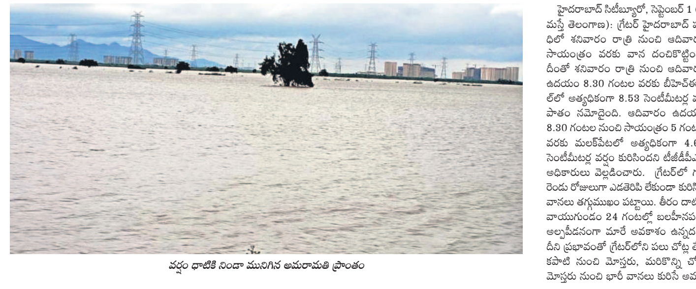
వర్షం డాటికి నిండా మునిగిన అమరావతి ప్రాంతం