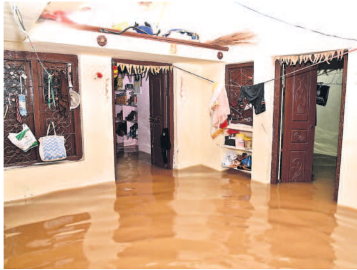
మహబూబ్ నగర్ జిల్లా కేంద్రంలోని కుల్లూరిశెట్టి కాలనీలో ఇంటిలోకి చేరిన వర్షపునీరు