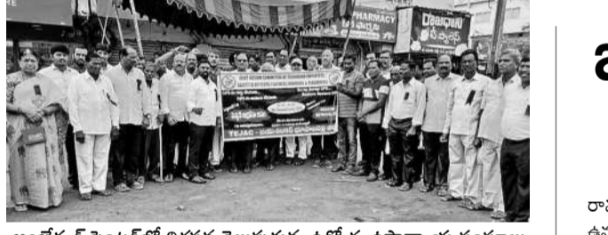
అంబేద్కర్ సెంటర్లో నిరసన తెలుపుతున్న ఉద్యోగ, ఉపాధ్యాయ సంఘాలు

స్టాక్ మార్కెట్ పెట్టుబడులు రిస్కుతో కూడుకున్నవి. వివిధ దేశ, విదేశీ పరిణామాలు ట్రేడింగ్ను ఎక్కువగా ప్రభావితం చేస్తుంటాయి. కాబట్టి ఇక్కడ ఒడిదొడుగుల వ్యాధి సూచీలు పెట్టుబడులు పెట్టే ముందు ఆర్థిక నిపుణుల సలహా తీసుకోవడం, ఆయా సాధనాల డాక్యుమెంట్లను క్షుణ్ణంగా చదువుకోవడం ఉత్తమం. అలాగే ఫైనీ పేర్కొన్న సూచీలను విశ్లేషించి అభిప్రాయం మాత్రమే. దీనికి మా పత్రిక ఎటువంటి బాధ్యత వహించదు. ఎవరి పెట్టుబడులకు వారిదే పూర్తి బాధ్యత. అవగాహన కోసమే ఈ మార్కెట్ పట్నీ.