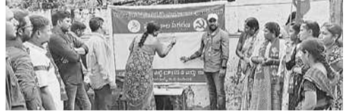
సంతకాలు సేకరిస్తున్న కాలనీ ప్రజలు