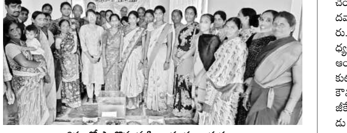
శిక్షణలో పాల్గొన్న మహిళా సంఘాల సభ్యులు