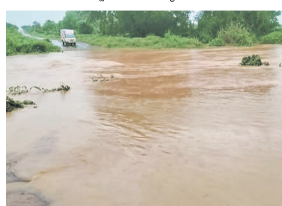
మర్లపల్లి: పొంగిపొరుగుతున్న సిరిపురం వాగు