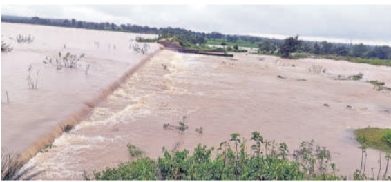
బొంబాయిపేట: అలుగుపారుతున్న చిన్నవాగు ప్రాజెక్టు