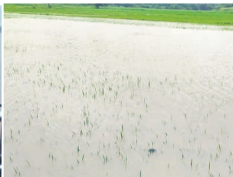
కులకచర్ల: వాడపూర్లో మునిగిన పంటపొలాలు..