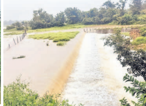
దోమ: మత్తడి దుంకుతున్న పెద్ద చెరువు