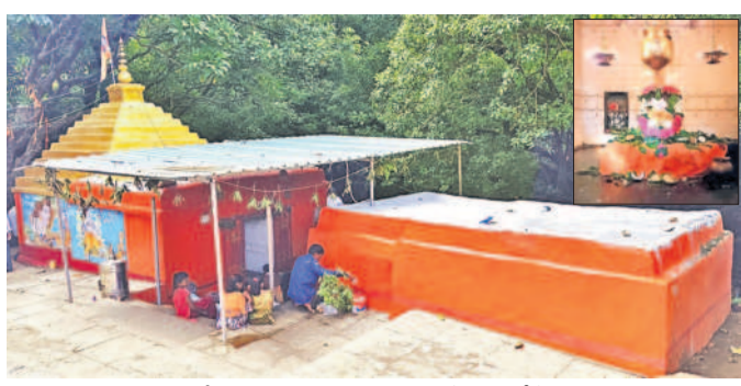
జాతరకు ముస్తాదైన శ్రీ అంబురామేశ్వర ఆలయం (ఇన్ సెట్) కొలువైన లింగమయ్య