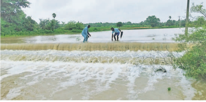
కులకచర్ల: ఘనాపూర్లో మత్తడి దుంకుతున్న చిన్నకుంట్ల