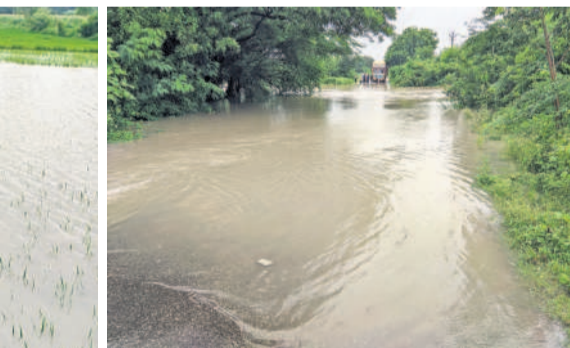
తాండూరు రూరల్: బెల్లూటూర్ వాగు ఉగ్రరూపం..