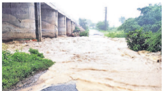
పెద్దేముల్: ఉద్భవంగా ప్రవహిస్తున్న గాజీపూర్ వాగు