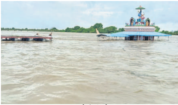
తాండూరు: భారీ వర్షంతో జీవస్థిలో మునిగిన శివాలయం