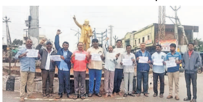
అంబేద్కర్ కూడలిలో నిరసన తెలుపుతున్న ఉపాధ్యాయులు