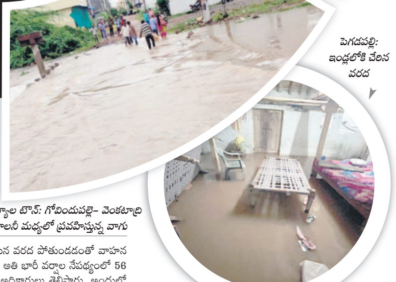
పెగడపల్లి: ఇండ్లలోకి చేరిన వరద