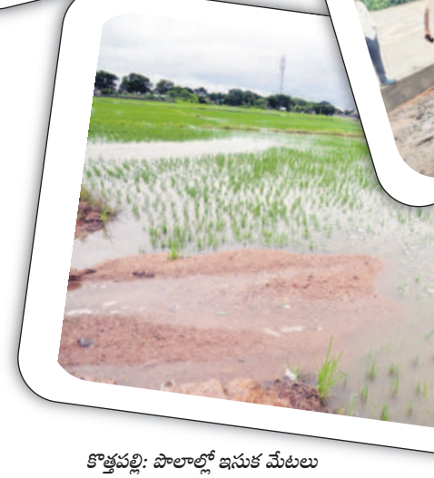
కోత్లపల్లి: పాలాల్లో ఇసుక మేటలు