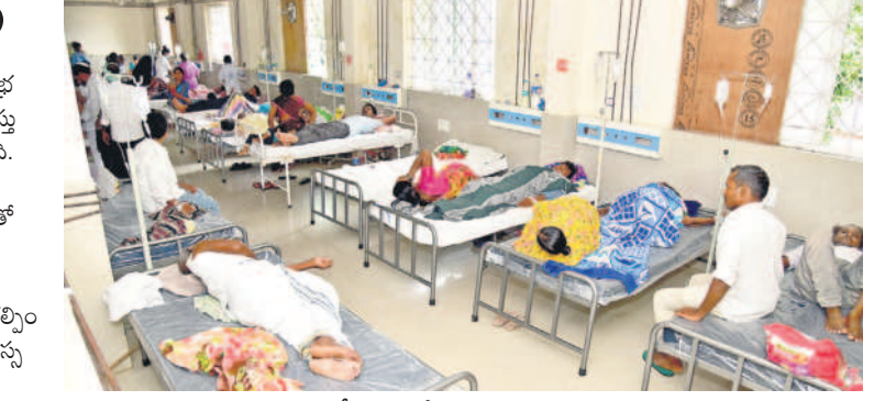
జ్వల పీడితులతో కిటికీలందుతున్న వార్డు