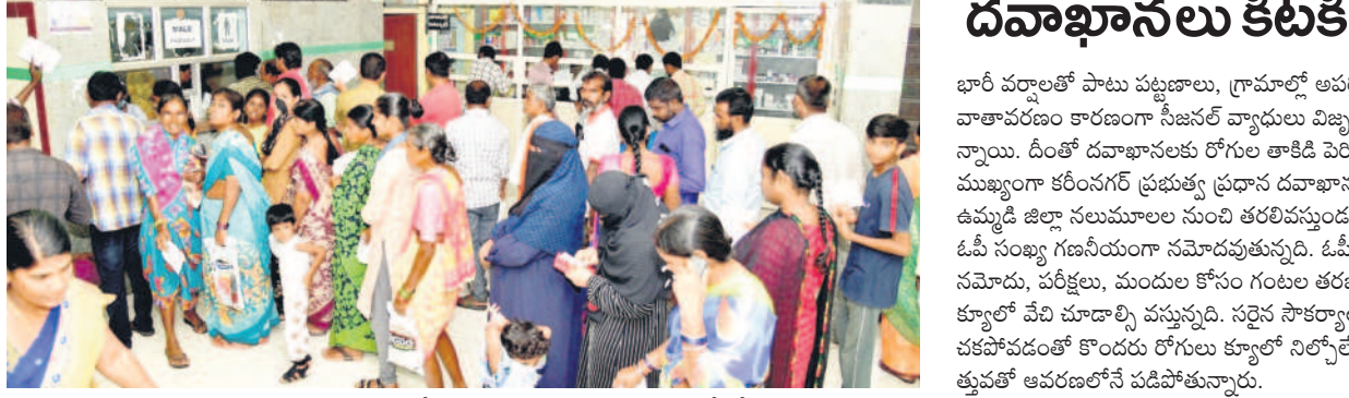
కరీంనగర్: ప్రభుత్వ దవాఖానలో మందులు తీసుకునేందుకు క్యూలో రోగులు