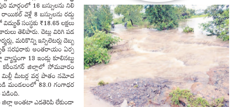
సారంగాపూర్: పోచంపేట-నాగునూర్ రోడ్డు మధ్యలో కోతకు గురైన రహదారి