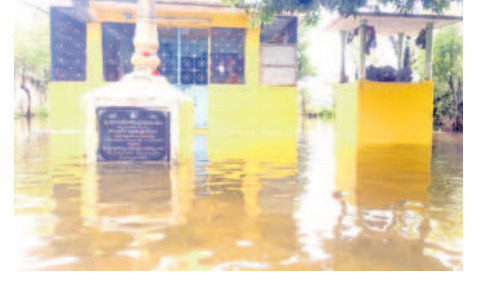
కాల్యాణీరాంపూర్ : శివాలయంలోకి చేరిన వరదనీరు