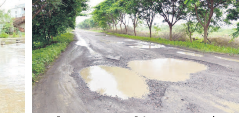
కరీంనగర్: గుంతలమయంగా వెలిచాల ఎక్కోచోట్ల వైపు నుంచి జగిత్యాల వెళ్లే రహదారి