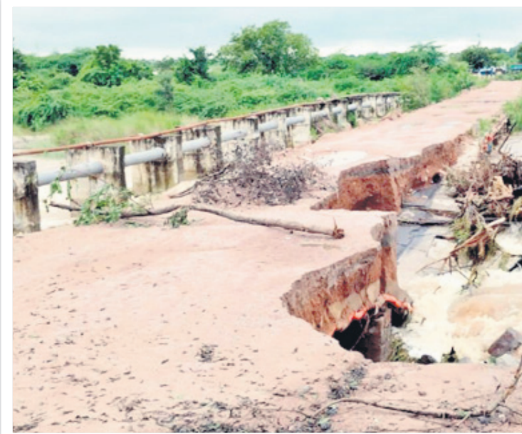
రామడుగు :వరద ఉధృతికి దెబ్బతిన్న మోతె వాగు బ్రష్టి