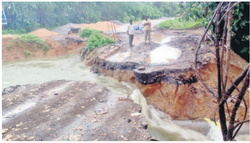
వీణవంక: మామిడిపల్లి శివారులో నీటి ప్రవాహానికి తెగిపోయిన రోడ్డు