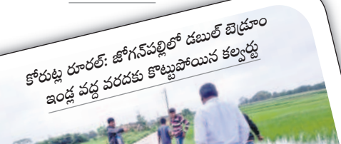
కోరుట్ల రూరల్: జోగన్నపల్లిలో డబ్బల్ బ్రష్టం ఇండ్ల వద్ద వరదకు కొట్టుపోయిన కల్యాణపుల్ల