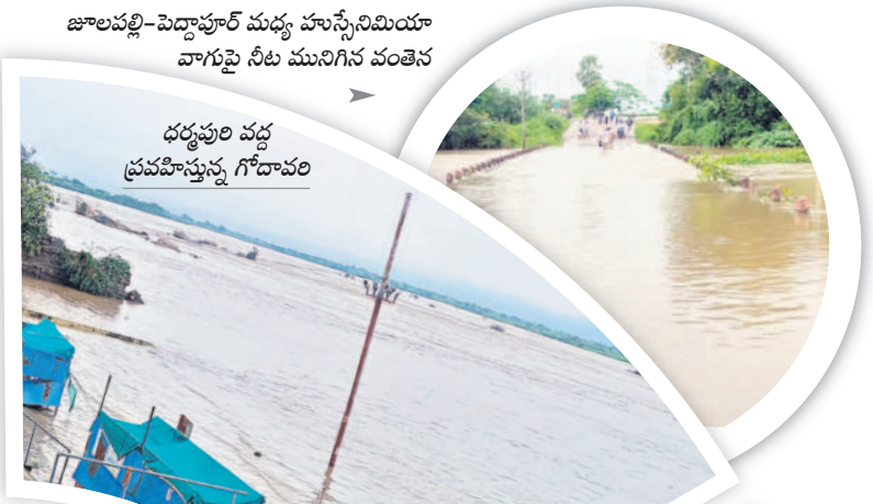
జాలపల్లి-పెద్దాపూర్ మధ్య హుస్సేనిమియా వాగుపై నీటి మునిగిన వంతెన