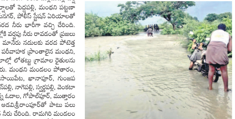
చొప్పదండి: అర్బుకొండ - రాగపేట వెళ్లే రోడ్డుపై ఉప్పొంగి ప్రవహిస్తున్న పందివారు