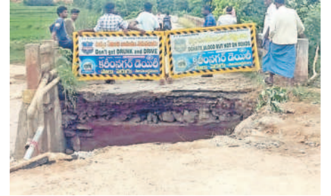
కరీంనగర్: నిమ్మపల్లి బ్రష్టి వద్ద కోతకు గురైన రోడ్డు