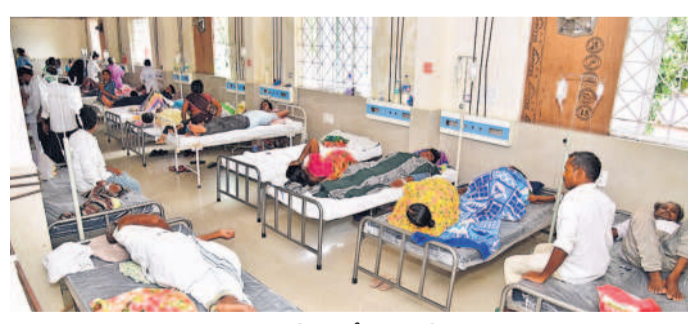
కలెనగర్ ప్రభుత్వ దవాఖానల్లో జ్వర వేడితులతో కిటికీలలాడుతున్న ఇన్ ఫార్మా

హైదరాబాద్, సెప్టెంబర్ 2 (నమస్తే తెలంగాణ) : రాష్ట్రంలో ఇప్పటికే సీజనల్ వ్యాధులు ముప్పు పొంచి ఉన్నదని వైద్యునిపు ణాలు హెచ్చరిస్తున్నారు. వర్షాల్లో నీళ్లు నిలిచి ఇప్పటికే డోసుల సంఖ్య పెరుగుతున్న దని, వరద తగ్గిన తర్వాత ప్రభావిత ప్రాంతాల్లో కలరాతోపాటు విషజ్వరాలు ఇలాంటి సమయంలో వర్షాలు, వరదలతో వ్యాధుల ముప్పు పొంచి ఉన్నదని వైద్యునిపు ణాలు హెచ్చరిస్తున్నారు. వర్షాల్లో నీళ్లు నిలిచి ఇప్పటికే డోసుల సంఖ్య పెరుగుతున్న దని, వరద తగ్గిన తర్వాత ప్రభావిత ప్రాంతాల్లో కలరాతోపాటు విషజ్వరాలు ఇలాంటి సమయంలో వర్షాలు, వరదలతో వ్యాధుల ముప్పు పొంచి ఉన్నదని వైద్యునిపు ణాలు హెచ్చరిస్తున్నారు. వర్షాల్లో నీళ్లు నిలిచి ఇప్పటికే డోసుల సంఖ్య పెరుగుతున్న దని, వరద తగ్గిన తర్వాత ప్రభావిత ప్రాంతాల్లో కలరాతోపాటు విషజ్వరాలు ఇలాంటి సమయంలో వర్షాలు, వరదలతో వ్యాధుల ముప్పు పొంచి ఉన్నదని వైద్యునిపు ణాలు హెచ్చరిస్తున్నారు.