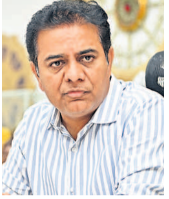
దేశరేషన్ స్టేజీ మీద కూర్చోని వరదల మీద సమీక్ష చేసే బీవీ మినిస్టర్.. ఉల్టాచోర్ కొత్తారత్ కో కాండ్ ఆన్యూ ప్రతిపక్షం ఏం చేస్తున్నాడని ప్రశ్నిస్తున్నాడు' అంటూ ఎద్దేవా చేశారు.