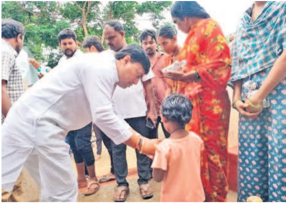
ఖమ్మం ధూల్ మండలంలోని వలు కాలనీలో బాధితులకు అవసర పాటాలు అందజేస్తున్న బీఆర్ఎస్ రాష్ట్ర నేత ఏనుగుల రాజేంద్ర్రెడ్డి