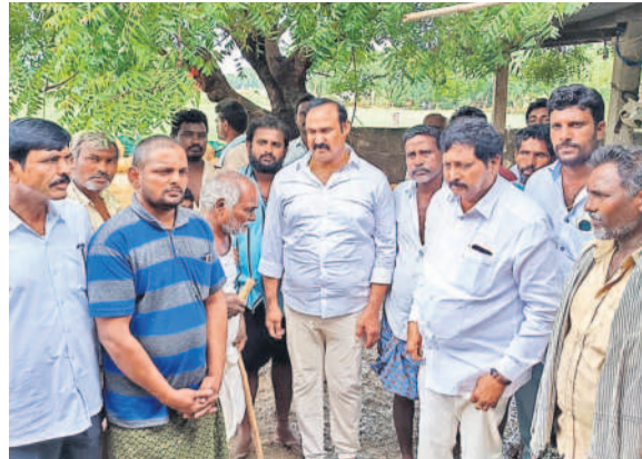
నూర్యాపేట జిల్లా గోండ్రియాలలో వరద పరిస్థితులను తెలుసుకుంటున్న మాజీ ఎంపీ బదరుల, మాజీ ఎమ్మెల్యే మల్లయ్య యాదవ్