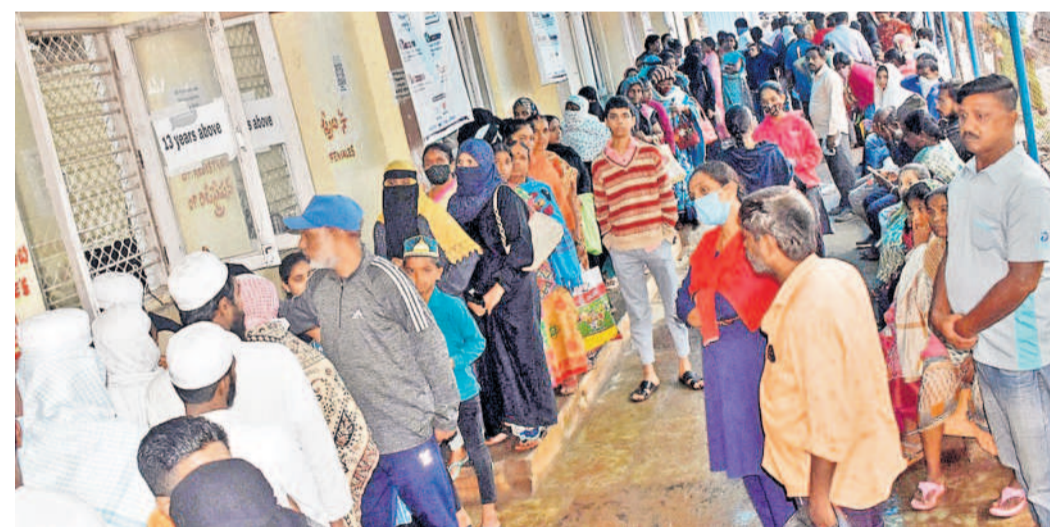
సోమవారం హైదరాబాద్ లోని ఓపెన్ హాస్పిటల్ ఓపి ఖాతా వద్ద బారుబిబిన రోగులు