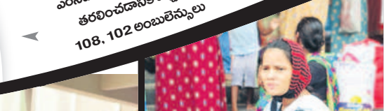
ఎంసీహెచ్ నుంచి పీసీసీలను తరలించడానికి వచ్చిన 108, 102 అంబులెన్సులు