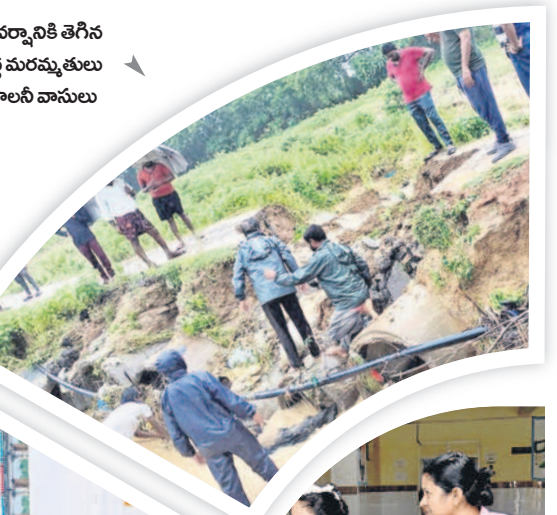
చెన్నూర్ : వర్షానికి తెగిన కల్వర్టు వద్ద మరమ్మత్తులు చేస్తున్న కాలనీ వాసులు