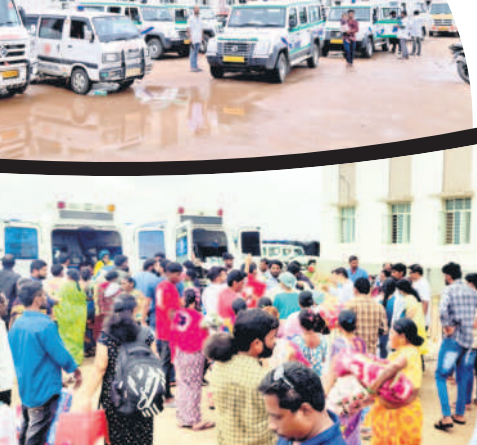
మంచిర్యాల ఎంసీహెచ్ అంబులెన్స్ లోకి ఎక్కుతున్న బాలింతలు, గర్భిణులు