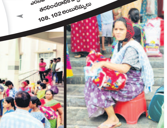
ఎంసీహెచ్ మెట్లపై తన బిడ్డను ఎక్కుకొని కూర్చున్న బాలింత