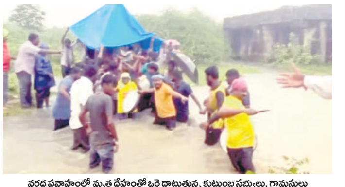
వరద ప్రవాహంతో మృత దేహంతో ఒర్రడాటుతున్న కుటుంబ సభ్యులు. గ్రామస్థులు

అధికారం మృతి చెందాడు. విద్యానగర్ లో ప్రారంభమైన అంతిమయాత్ర జాతీయ రైల్వే లైన్ వంతెన వరకు సాగినానే సాగింది. వర్షాలకు దాని సమీపంలో ఉన్న ఒర్రడాటి ఉద్ధృతంగా ప్రవహిస్తుండగా, పుస్తక దేవతలను ఎక్కుకొని అంత్యక్రమం మీద అవతలికి దాటారు. అనంతరం శ్మశాన వాటికలో అంత్యక్రియలు నిర్వహించారు.