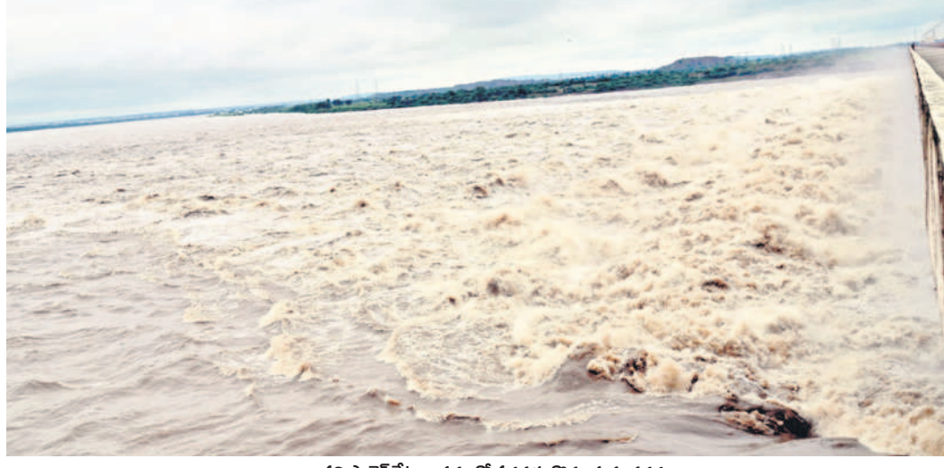
ఎల్లంపల్లి ప్రాజెక్టు గేట్లు ఎత్తడంతో వరదలు తొక్కుతున్న వరద