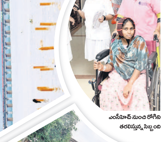
ఎంసీహెచ్ నుంచి రోగిని తరలిస్తున్న సిబ్బంది