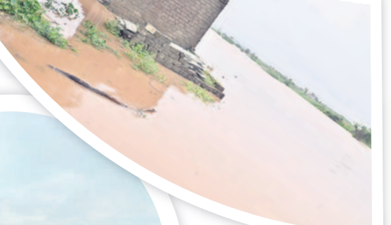
మంచిర్యాల : ఎన్టీఆర్ నగర్ లోకి చేరిన వరద