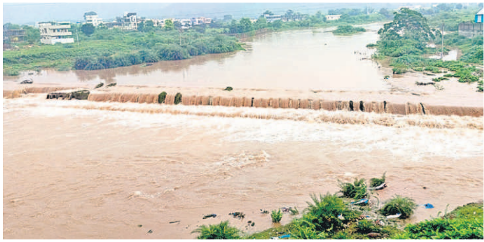
మంచిర్యాలలో: రంగంపేట కాజీవే పై నుంచి ప్రవాహస్వన్న రాళ్ల వారు

మంచిర్యాల, సెప్టెంబర్ 2 (నమస్తే తెలంగాణ ప్రతినీడి) : భారీ వర్షాల నేపథ్యంలో గోదావరి ఉగ్రరూపం దాల్చుతుండగా, మంచిర్యాల ప్రజలకు వరద టెన్షన్ పట్టుకున్నది. కడెం ప్రాజెక్టుకు అధికారం అర్హత 12 గంటల వరకు 50 వేల క్యూసెక్కుల ఇన్ఫ్లో ఉండగా, సోమవారం ఉదయానికి 2.30 లక్షల క్యూసెక్కులకు పెరిగింది. మొత్తం 18 గేట్లు ఎత్తి నీటిని వదులుతున్నారు. అలాగే ఎస్సారెస్సీ ప్రాజెక్టు 40 గేట్లు ఎత్తి 1.50 లక్షల క్యూసెక్కుల నీటిని విడుదల చేస్తుండగా, ఎల్లంపల్లి ప్రాజెక్టు సమీపంలో గోదావరి ఉప్పొంగి ప్రవహిస్తున్నది. ఈ సీజన్లో అత్యధికంగా సోమవారం ఉదయం ఆరు లక్షల క్యూసెక్కుల నీటిని ఎల్లంపల్లి నుంచి దిగువకు వదిలారు. సోమవారం మధ్యాహ్నానికి 30 గేట్లు 4 మీటర్ల మేర ఎత్తి నీటిని వదులుతున్నట్లు అధికారులు తెలిపారు. ఇటు కడెం, అటు ఎస్సారెస్సీ ప్రాజెక్టుల నుంచి వదిలిన వరద సోమవారం రాత్రికి ఎల్లంపల్లి ప్రాజెక్టుకు చేరుతుందని అధికారులు చెబుతున్నారు. ఇదే జరిగితే ప్రస్తుతం 6 లక్షల క్యూసెక్కులు ఉన్న వరద 8 లక్షల నుంచి 10 లక్షల క్యూసెక్కులకు పెరగొచ్చని వారు పేర్కొంటున్నారు.