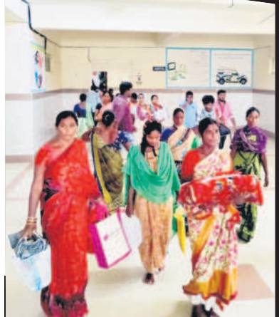
ఎంసీహెచ్ నుంచి బయటకు వస్తున్న బాలింతలు, బంధువులు