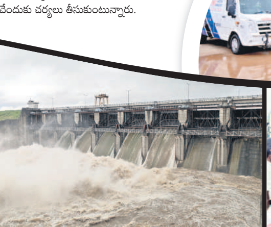
ఆసిఫాబాద్ అంబేద్కర్ చౌక్ : అద ప్రాజెక్టు గేట్లు ఎత్తడంతో వరద వరవల్లు