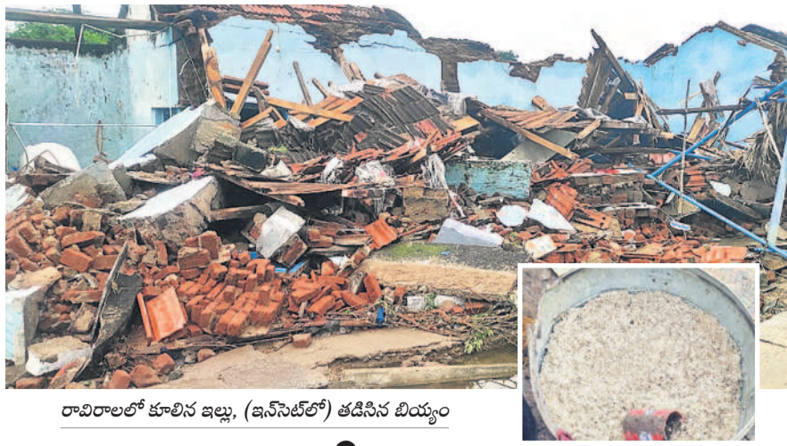
రావిరాలలో కూలిన ఇల్లు. (ఇన్సైట్లో) తడిసిన బియ్యం