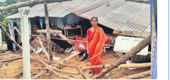
నేను బతుకుతా అనుకోలేదు..