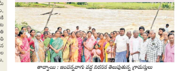
తాడ్యాం : జంపన్నవారు వద్ద నిరసన తెలుపుతున్న గ్రామస్థులు

మహబూబాబాద్ జిల్లా కేంద్రంలోని పలు కాలనీలను సందర్శించారు. వరద బాధిత కుటుంబాలను పరామర్శించి ఓడారాధారు. కూలిన ఇళ్లను, తడిసిన నిత్యావసర సరు కులు, తెగిన చెరువులు, వరదలో కొట్టుక పోయిన మూగజీవులను పరిశీలించారు. ఆయా ప్రాంతాల్లో ఇంటింటికి వెళ్లి బాధి తులతో మాట్లాడారు. ఇళ్ల కోల్పోయిన వారికి ఇదిరింపు ఇళ్ల ఇస్తామని హామీ ఇచ్చారు. పశువులు, ద్విచక్ర వాహనం, ట్రాక్టర్, ఆటోలు కొట్టుకుపోయిన వారికి అండగా ఉంటామన్నారూ. జిల్లాలో పంట సన్నాన్ని అంచనా వేయాలని, యుద్ధ ప్రాతి పదికన సహాయక చర్యలు చేపట్టాలని అది కారలను ఆదేశించారు. తక్షణమే తెగిన చెరువులు, రోడ్ల మరమ్మత్తు చేపట్టాల న్నారు. ఆమె వెంట వెళ్లినా, పోలీసు, ఇతర శాఖల అధికారులున్నారు.