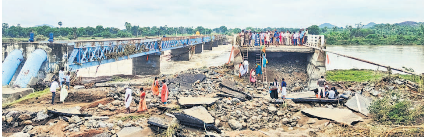
పురుషోత్తమాచార్యగూడెం వద్ద ఆతేరు ఉధృతికి ద్వంసమైన ఎన్.హెచ్. 385