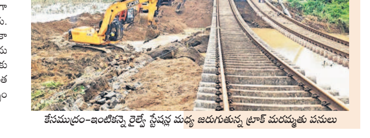
కేసముద్రం-ఇంటికి వెళ్లే రైల్వే స్టేషన్ల మధ్య జరుగుతున్న ట్రాక్ మరమ్మత్తు పనులు