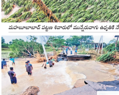
మహబూబాబాద్ పట్టణ శివారులో మున్నేరువారు ఉధృతికి నెలవాలిన వరి పంట