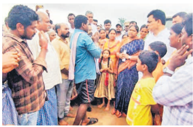
బయ్యారం : ఆడుకోవాలంటూ సీతక్కకు చేతులెత్తి మొక్కుతున్న రైతు మహిళో