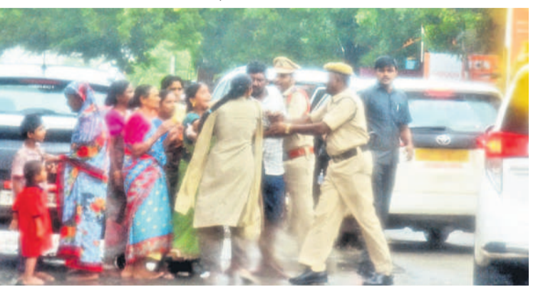
కేసముద్రం : సీతక్క కాన్వాయ్ని అడ్డుకుంటున్న వారికి పక్కకు నెట్టివేస్తున్న పోలీసులు