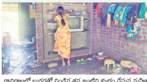
రావిరాలలో బురదతో నిండిన తన ఇంటిని కుద్రం చేస్తున్న మహిళ

ముడు రోజుల నుంచి కురిసిన వర్షాలతో రాజులకోటపల్లి చెరువు తెగ నెల్లికుదురు మండలంలోని రావిరాల గ్రామం జలదిగ్భంధంలో చిక్కుకున్నది. ఇలా వరద సృష్టించిన బీభత్సంతో గ్రామంలో ప్రతి ఇంట్లోకి నడుము లోతు నీళ్లు చేరి ప్రజలు తీవ్ర ఇబ్బందులు పడ్డారు. ఫలితంగా గ్రామంలో ఐదు ఇండ్లు నేలమట్టమయ్యాయి. 25 ఇండ్లు పాక్షికంగా దెబ్బతిన్నాయి. ఇండ్లు కూలి ఇంట్లోని వస్తువులన్నీ పూర్తిగా నీటిపాలయ్యాయి. 72 ఇళ్లలోకి నీరు చేసి బియ్యం బస్తాలు, పంటల