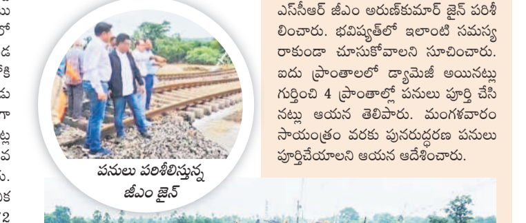
పనులు పరిశీలిస్తున్న జీఎం జైన్