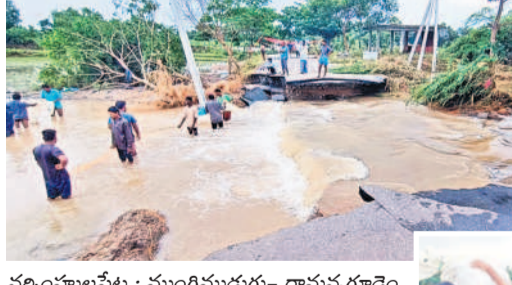
మాట, ముల్లెతో పురుషోత్తమాచార్యుల గౌరవం రోడ్డు దాటుతున్న ప్రజలు