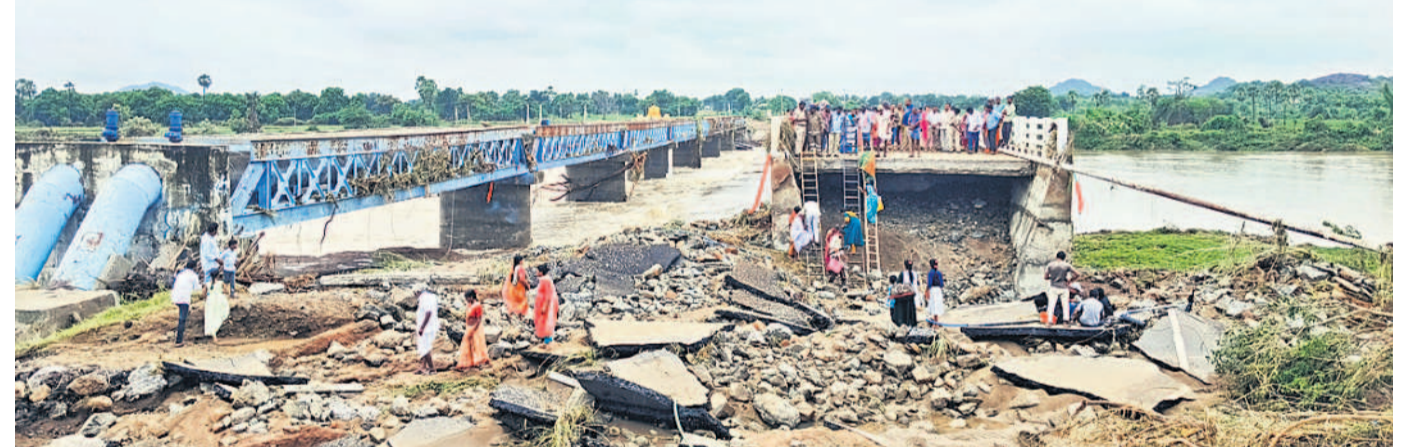
పురుషోత్తమాచార్యుల గౌరవం వద్ద ఆతేరు ఉధృతికి ధ్వంసమైన ఎన్.హెచ్.985