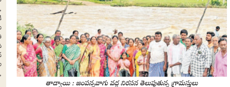
తాడ్యాయి : జంపన్నవారు వద్ద నిరసన తెలుపుతున్న గ్రామస్థులు

మహబూబాబాద్ జిల్లా కేంద్రంలోని పలు కాలనీలను సందర్శించారు. వరద బాధిత కుటుంబాలను పరామర్శించి ఓడారాధు. కూలిన ఇళ్లను, తడిసిన నిత్యావసర సరుకులు, తెగిన చెరువులు, వరదలో కొట్టుకుపోయిన మూగజీవులను పరిశీలించారు. ఆయా ప్రాంతాల్లో ఇంటింటికి వెళ్లి బాధితులతో మాట్లాడారు. ఇళ్ల కోల్పోయిన వారికి ఇదిగింపు ఇళ్ల ఇస్తామని హామీ ఇచ్చారు. పశువులు, ద్విచక్ర వాహనం, ట్రాక్టర్, ఆటోలు కొట్టుకుపోయిన వారికి అండగా ఉంటామన్నారూ. జిల్లాలో పంట సన్నాహి అంచనా వేయాలని, యుద్ధ ప్రాంత పడిన సహాయక చర్యలు చేపట్టాలని అధికారులను ఆదేశించారు. తక్షణమే తెగిన చెరువులు, రోడ్ల మరమ్మత్తు చేపట్టాలన్నారు. ఆమె వెంట సైన్యాన్ని పోలీసులు, ఇతర శాఖల అధికారులున్నారు.