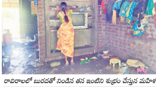
రావిరాలలో బురదతో నిండిన తన ఇంటిని తులిన మహిళ

తినదామంటే తిండిలేదు... ఉండదామంటే ఇల్లు లేదు అరచేతిలో ప్రాణాలు పెట్టుకుని అరిగోసిన పద్ద రావిరాల నిండా ముంచిన వరద బీభత్సం కొట్టుకుపోయిన మూగజీవులు, వాహనాలు ఇబ్బి రావిరాల ప్రజల గోస