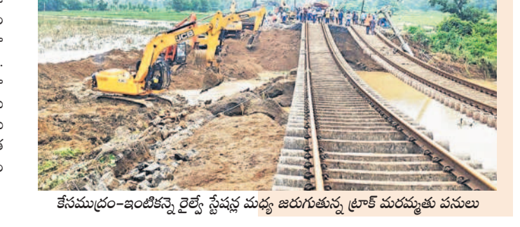
కేసముద్రం-ఇంటికి వెళ్ల రైల్వే స్టేషన్ల మధ్య జరుగుతున్న ట్రాక్ మరమ్మత్తు పనులు