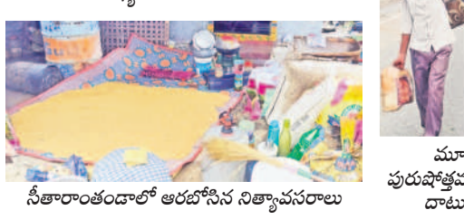
సీతారాంతుండారో అరబోసిన నిత్యావసరాలు