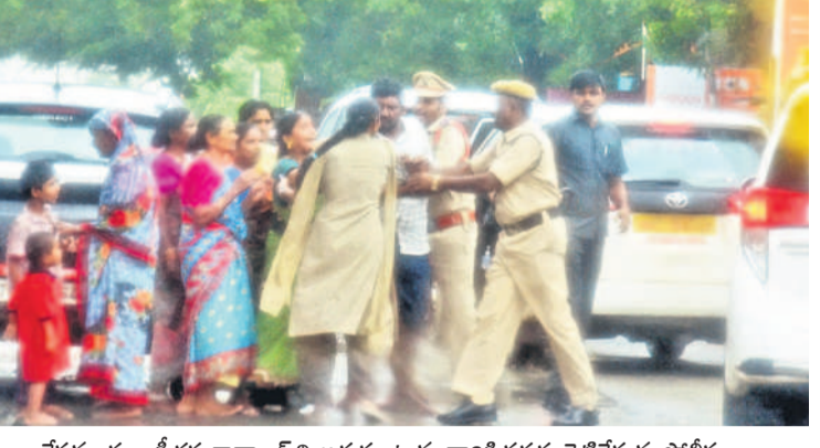
కేసముద్రం : సీతక్క కాన్వాయ్ని అడ్డుకుంటున్న వారికి పక్కకు నెట్టివేస్తున్న పోలీసులు