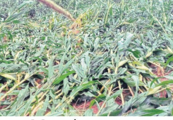
పెద్దకోడవగల్ మండలంలో దెబ్బతిన్న మక్కజోన్న పంట

భారీ వరాలతో ప్రజలు, రైతులు తీవ్ర ఇబ్బందులు పడుతున్నారు. లక్షల ఎకరాల్లో పరి పంటలైతే కనిపించకుండా వరద నీటిలో మునిగాయి. ప్రతి గ్రామంలో వ్యవసాయ భూములు చెరువును తలపిస్తున్నాయి. రైతుల భూముల్లో ఇసుక మేటలు తేలుతున్నాయి. నెల రోజుల్లో చేతికి వస్తుండనుకున్న పంట నీటిపాలు కావడంతో రైతులు అబ్బో దిబ్బోమంటున్నారు. పంట నష్టాన్ని అంచనా వేసేందుకు వ్యవసాయ శాఖ చర్యలు చేపట్టక పోవడంపై విమర్శలు వ్యక్తమవుతున్నాయి. ఆప త్యాలో అండగా నిలవాల్సిన ప్రజాప్రతినిధులు ఒక్కరూ రాలేదు. కాంగ్రెస్ ఎమ్మెల్యేలు ఎవరూ జనాల్లోకి వెళ్లి వారి కష్ట, నష్టాలను తెలుసుకునే ప్రయత్నమే ఉమ్మడి జిల్లాలో చేయలేదు.