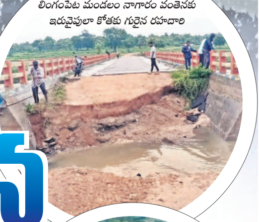
లింగంపేట మండలం నాగారం వంతెనకు ఇరువైపులా కోతకు గురైన రూపాల