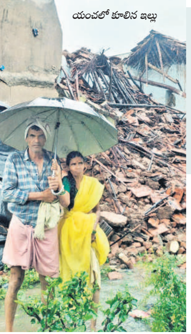
యంతలో కూలిన ఇల్లు