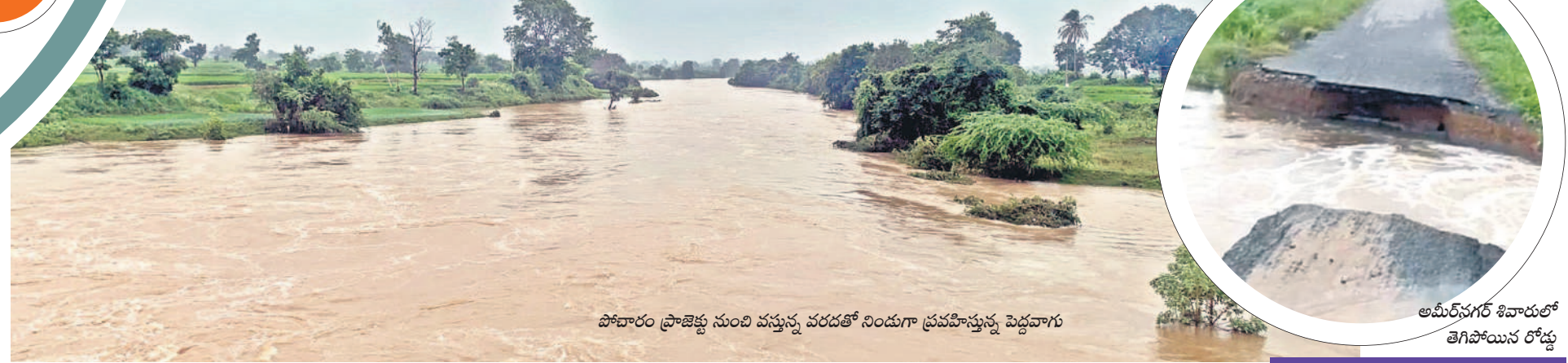
పోవారం ప్రాజెక్టు నుంచి వస్తున్న వరదతో నిండుగా ప్రవహిస్తున్న పెద్దవారు