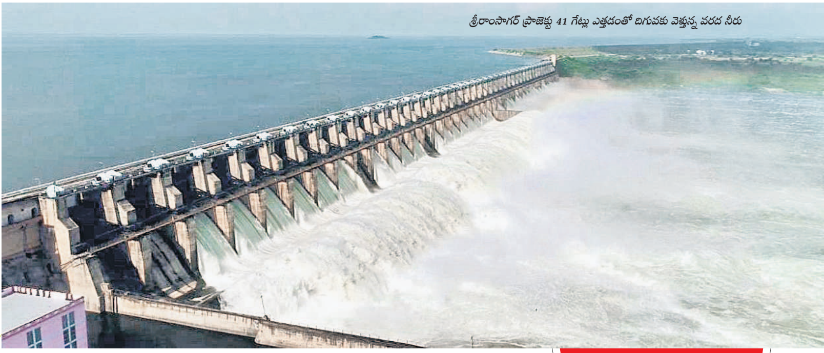
శ్రీరాంసాగర్ ప్రాజెక్టు 41 గేట్లు ఎత్తడంతో దిగువకు వెళ్తున్న వరద నీరు