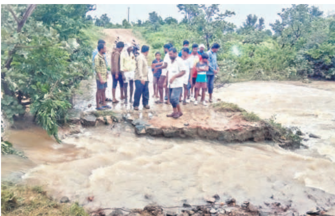
వరద ఉధృతికి ధ్వంసమైన అన్నారెడ్డిపల్లి రహదారి