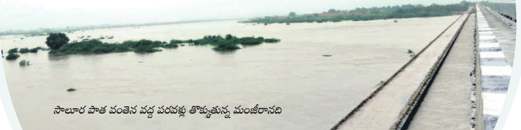
సాలూర పాత వంతెన వద్ద పరవళ్లు తోక్తున్న మంజీరానది