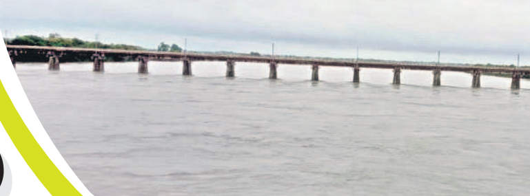
నవీపేట మండలం యంత వద్ద గోదావరి ఉద్భవ