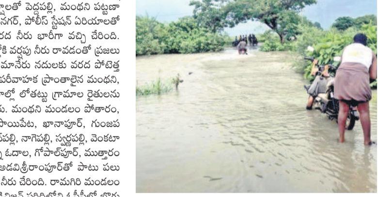
చొప్పదండి: అద్దకొండ - రాగంపేట వెళ్లే రోడ్డుపై ఉప్పొంగి ప్రవహిస్తున్న పందివారు