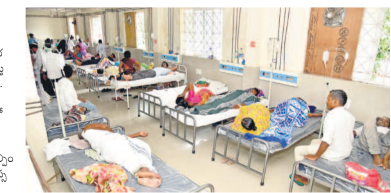
జ్వల పీడితులతో కిటికీలూడుతున్న వార్డు