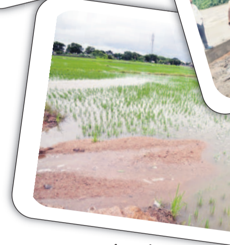
కోత్లపల్లి: పాలాల్లో ఇసుక మేటలు