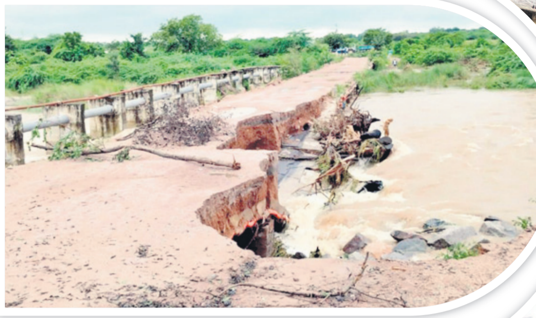
రామడుగు :వరద ఉధృతికి దెబ్బతిన్న మోతె వాగు బ్రిడ్జి