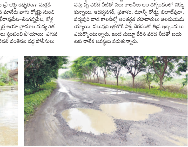
కరీంనగర్: గుంతలమయంగా వెలిచాల ఎక్కోచోడ్లు వైపు నుంచి జగిత్యాల వెళ్లే రహదారి