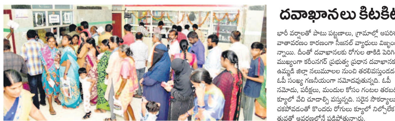
కరీంనగర్: ప్రభుత్వ డవాఖానలో మందులు తీసుకునేందుకు క్యూలో రోగులు