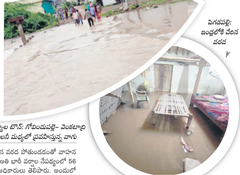
పెగడపల్లి: ఇండ్లలోకి చేరిన వరద