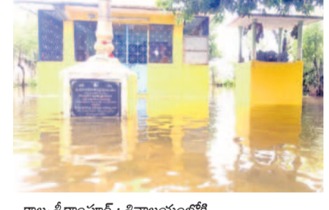
కాల్యాణీరాంపూర్ : శివాలయంలోకి చేరిన వరదనీరు