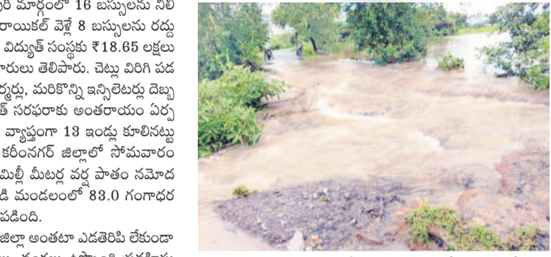
సారంగాపూర్: పోచంపేట-నాగునూర్ రోడ్డు మధ్యలో కోతకు గురైన రహదారి