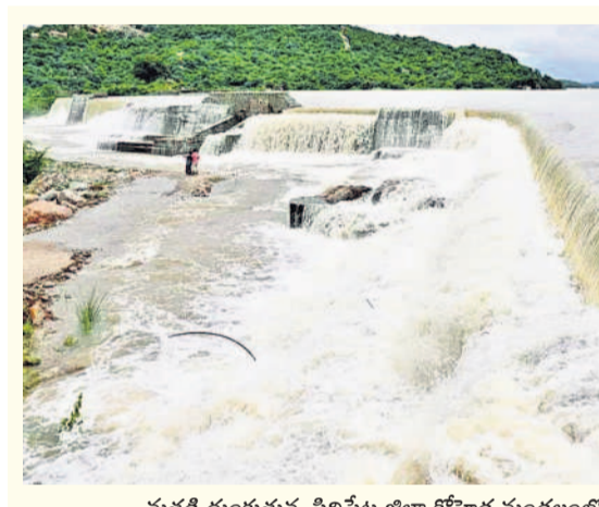
మత్తడి దుంకుతున్న సిద్దిపేట జిల్లా కోనాడ మండలంలోని శనిగిరి ప్రాజెక్టు

లక్షలకు పైగా ఎకరాల్లో పంటలు సాగు చేశారు. అయితే భారీ వరాల నేపథ్యంలో జిల్లాలో 165 ఎకరాల్లో మాత్రమే పంటలు నీల మునిగాయి. హావేళిపూసూర్లో 65 మంది రైతులకు చెందిన 105 ఎకరాలు, బూర్గుపల్లిలో 15 మంది రైతులకు చెందిన 35 ఎకరాలు, రాజ్ పేటలో 15 మంది రైతులకు చెందిన 25 ఎకరాల వరీ పంటనీల మునిగాయి. జిల్లాలో ఇప్పటి వరకు 238 ఇండ్ల పాక్షికంగా దెబ్బతిన్నాయి. ఇందులో అత్యధికంగా కొల్లూరం మండలంలో 21, షేరిలపేట మండలంలో 12, పెద్దశంకరంపేట మండలంలో 11, మెడక్ మండలంలో 10, బాపట్లపేట మండలంలో 10 ఇండ్ల పాక్షికంగా కూలిపోయాయి.