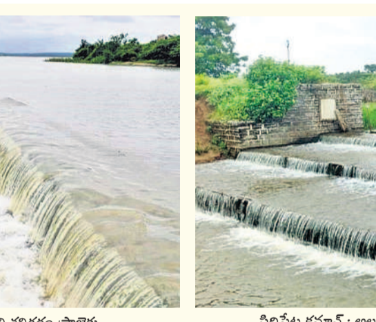
సిద్దిపేట కమాన్ : అలుగు దుంకుతున్న సిద్దిపేట జిల్లా లింగారెడ్డిపల్లి తుమ్మలకుంట