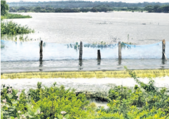
మెడక్ జిల్లా పెద్దశంకరంపేటలో అలుగు పారుతున్న తిరుమలారావు చెరువు