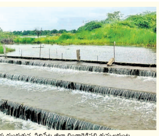
సిద్దిపేట కమాన్ : మత్తడి పారుతున్న సిద్దిపేట జిల్లా సిద్దిపేటలోని ఎర్రచెరువు