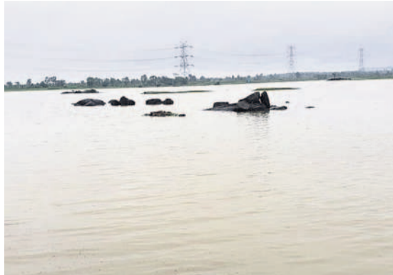
మెడక్ జిల్లా రామాయంపేట మండలంలో అలుగు పారుతున్న అందుగులపల్లి పెద్దచెరువు