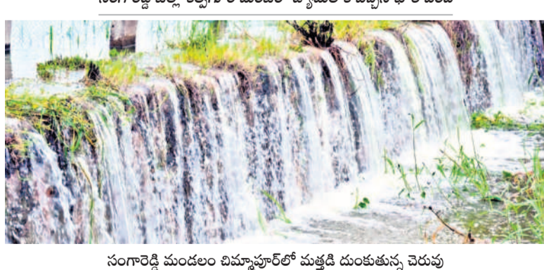
సింగారెడ్డి జిల్లా కల్వగూర్ మండలా ద్యామంలోకి వచ్చిన భారీ వరద

పుల్వే, సెప్టెంబర్ 3: సంగారెడ్డి జిల్లా పుల్వే మండలంలోని బాగారెడ్డి సింగూరు ప్రాజెక్టుకు వరద కొనసాగుతోంది. మంగళవారం ఉదయం ఆరు గంటల వరకు 24.801 క్యూసెక్కుల నీరు రాగా సాయంత్రం ఆరుగంటల వరకు సుమారు 10వేల క్యూసెక్కుల నీరు వచ్చినట్లు ప్రాజెక్టు అధికారులు తెలిపారు. వరద తీవ్రత 38,920 క్యూసెక్కులు వస్తుండగా, ఎగువ ప్రాంతాల్లో కురుస్తున్న వర్షాల కారణంగా అధికారులు ప్రాజెక్టు వద్ద పరదను ఎప్పటికప్పుడు పరిశీలిస్తున్నారు. వరద ఎక్కువ వస్తున్న సందర్భంగా సందర్శకుల తాకిడి నిషేధించి కానీ ప్రాజెక్టుపైకి అనుమతించడం లేదు. ప్రాజెక్టు పూర్తి సామర్థ్యం 29.917 టీఎంసీలు ఉండగా ప్రస్తుతం ప్రాజెక్టులోకి ఇన్ ఫ్లో 33,920 క్యూసెక్కులు కొనసాగుతుంది. ప్రస్తుతం ప్రాజెక్టులో 21,536 టీఎంసీల నీరు నీల్వ ఉండగా అవుట్ ఫ్లో 401 క్యూసెక్కులు దిగువకు వెళ్తున్నట్లు ప్రాజెక్టు ఏకా మహీపాలెడ్డి తెలిపారు.