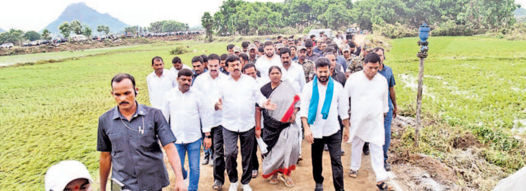
నీతారాంతండాకు వస్తున్న సీఎం రేవంత్ రెడ్డి, మంత్రులు