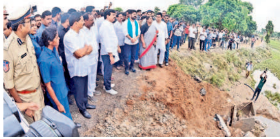
మరిపెడ మండలం పురుషోత్తమాయగూడెం వద్ద తెగిపోయిన బ్రిడ్జిని పరిశీలిస్తున్న సీఎం రేవంత్ రెడ్డి, మంత్రులు