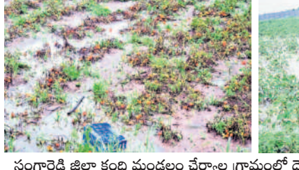
సంగారెడ్డి జిల్లా కంది మండలం చేర్కూరు గ్రామంలో దెబ్బతిన్న టమాట, పత్తి పంటలు

సంగారెడ్డి సెప్టెంబర్ 3 (నమస్తే తెలంగాణ): సంగారెడ్డి జిల్లాలో మోస్తరు వర్షం కురిసింది. మూడురోజులుగా కురుస్తున్న వరాలకు జిల్లాలో పంటలు, రోడ్లు, ఇండ్లు పెద్ద ఎత్తున దెబ్బతిన్నాయి. పలుచెరువులు, కుంటలకు బుంగలుపడ్డాయి. జిల్లాలోని జలవనరుల్లోకి పెద్ద ఎత్తున వరద వచ్చి చేరింది. సింగూరు ప్రాజెక్టులోకి వరద కొనసాగుతుండగా నల్లవాగు ప్రాజెక్టు అలుగు పారుతుంది. జిల్లాలోని 117 చెరువులు అలుగు పారుతున్నాయి. మంగళవారం జిల్లాలో 1.6 సె.మీ వర్షం పడింది. జిల్లాలోని 12 మండలాల్లో సాధారణ కంటే ఎక్కువ వర్షం కురుతూ 14 మండలాల్లో సాధారణ వర్షపాతం నమోదైంది. నల్లవాగు, సింగూరులోకి వరద సింగూరు ప్రాజెక్టులోకి వరద కొనసాగుతుండగా నల్లవాగు ప్రాజెక్టు అలుగు పారుతుం