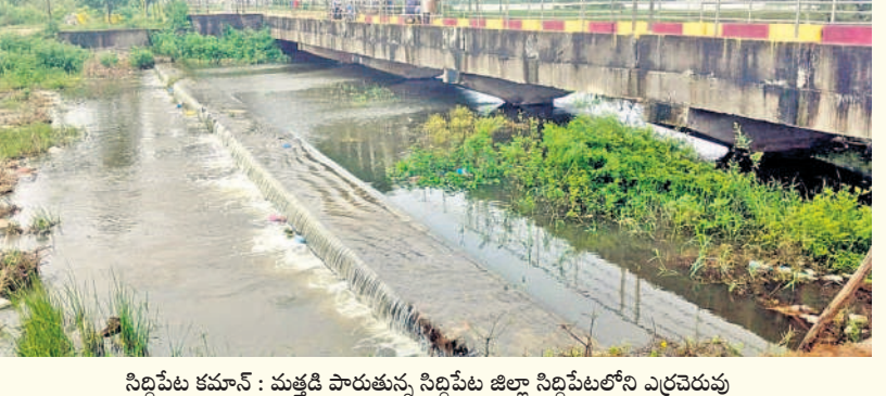
సిద్దిపేట కమాన్ : మత్తడి పారుతున్న సిద్దిపేట జిల్లా సిద్దిపేటలోని ఎర్రచెరువు