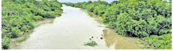
సంగారెడ్డి మండలంలో ఉధృతంగా ప్రవహిస్తున్న నక్కల వాగు