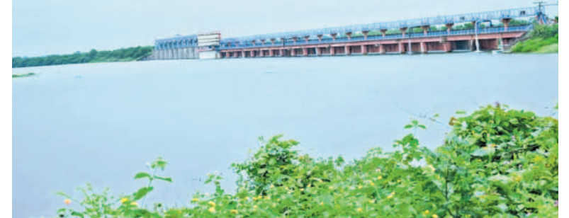
సంగారెడ్డి జిల్లా కల్వగూర్ మండలా ద్యామలోకి వచ్చిన భారీ వరద

వరదను ఎప్పటికప్పుడు పరిశీలిస్తున్నారు. వరద ఎక్కువ వస్తున్న సందర్భంగా సందర్శకుల తాకిడి లేదు. ప్రాజెక్టు పూర్తి సామర్థ్యం 29.917 టీఎంసీలు ఉండగా ప్రస్తుతం ప్రాజెక్టులోకి ఇన్ ఫ్లో 33,920 క్యూసెక్కుల నీరు వచ్చినట్లు ప్రాజెక్టు అధికారులు తెలిపారు. వరద తీవ్రత 33,920 క్యూసెక్కుల వస్తుందన్నారు. ఎగువ ప్రాంతాల్లో కురుస్తున్న వర్షాల కారణంగా అధికారులు ప్రాజెక్టు వద్ద