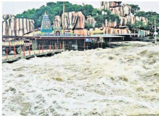
మెదక్ జిల్లా పాపన్నపేట మండలంలోని ఏడుపాయల దుర్గమ్మ ఆలయం వద్ద పరవళ్లు తొక్కుతున్న మంజీరా

మెదక్, సెప్టెంబర్ 3 (నమస్తే తెలంగాణ): మెదక్ జిల్లాలో నాలుగు రోజులుగా వరదలు కురుస్తూనే ఉన్నాయి. శని, ఆదివారాల్లో వర్షం బీభత్సం సృష్టించగా, సోమవారం ముసురు వాన కురిసింది. దీంతో జిల్లాలోని చెరువులన్నీ నిండిపోయాయి. ప్రతి సంవత్సరం సెప్టెంబర్ చివరివారం వరకు చెరువులు అలుగు పారేవి కావు... కానీ సెప్టెంబర్ ప్రారంభంలోనే భారీ వర్షాలు పడటంతో మెజార్లీ చెరువులు నిండాయి. ఎడతెరిపి లేని వరాలకు చెరువులు, కుంటలు, ప్రాజెక్టుల్లోకి భారీగా నీరు చేరుతోంది. జూన్, జూలై, ఆగస్టులో సాధారణ వర్షపాతం నమోదైంది. నాలుగు రోజులుగా భారీ వర్షపాతం నమోదైంది. దీంతో కొన్ని కుంటలు మేలు జర