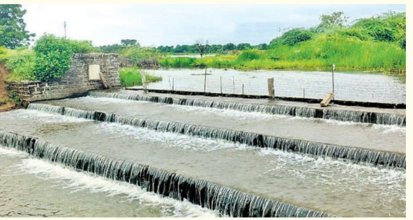
సిద్దిపేట కమాన్ : అలుగు దుంకుతున్న సిద్దిపేట జిల్లా లింగారెడ్డిపల్లి తుమ్మలకుంట