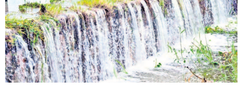
సంగారెడ్డి మండలం చివ్వూరులో మత్తడి దుంకుతున్న చెరువు