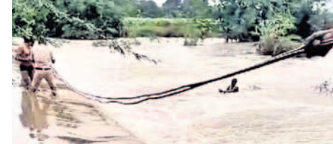
టేక్నాలజీ మండలంలోని షాబాద్ తండా సమీపంలో ఉన్న వాగులో చిక్కుకున్న వ్యక్తిని కాపాడుతున్న పోలీసులు