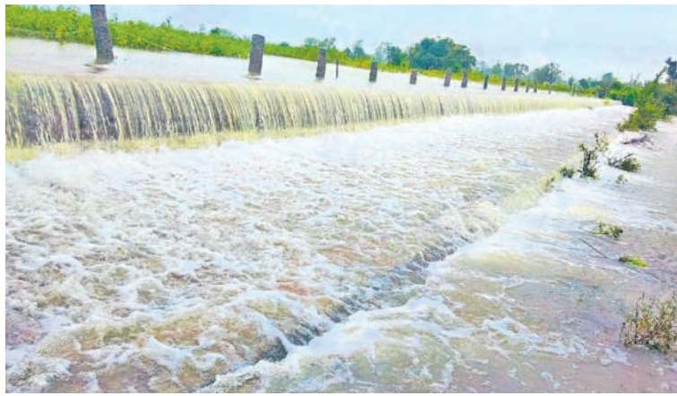
మెదక్ జిల్లా వెల్దుర్తి మండలంలో అలుగు పారుతున్న అందుగలపల్లి పెద్దచెరువు