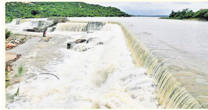
మత్తడి దుంకుతున్న సిద్దిపేట జిల్లా కోనాడ మండలంలోని శనిగం ప్రాజెక్టు

లక్షలకు పైగా ఎకరాల్లో పంటలు సాగు చేశారు. అయితే భారీ వర్షాల నేపథ్యంలో జిల్లాలో 165 ఎకరాల్లో మాత్రమే పంటలు నీటి మునిగాయి. హవేళిఘనపూర్లో 85 మంది రైతులకు చెందిన 105 ఎకరాలు, బూర్గుపల్లిలో 15 మంది రైతులకు చెందిన 35 ఎకరాలు, రాజ్ పేటలో 15 మంది రైతులకు చెందిన 25 ఎకరాల వరి పంటనీటి మునిగింది. జిల్లాలో ఇప్పటి వరకు 2383 ఇండ్లు పాక్షికంగా దెబ్బతిన్నాయి. ఇందులో అత్యధికంగా కొల్లూరం మండలంలో 21, చేగుంట మండలంలో 12, పెద్దశంకరంపేట మండలంలో 11, మెదక్ మండలంలో 10, పాపన్నపేట మండలంలో 10 ఇండ్లు పాక్షికంగా కూలిపోయాయి.