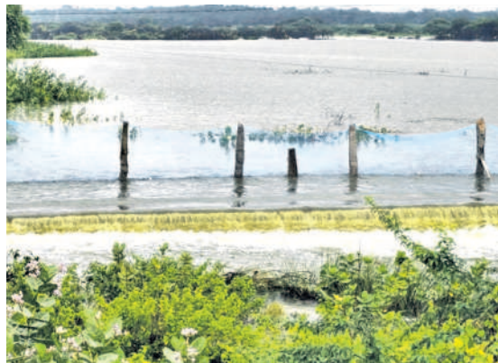
మెదక్ జిల్లా పెద్దశంకరంపేటలో అలుగు పారుతున్న తిరుమలాపురం చెరువు