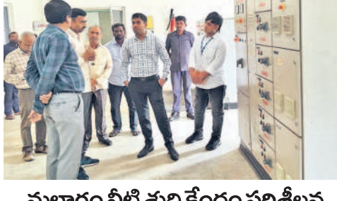
మల్లారం నీటి శుద్ధి కేంద్రం పరిశీలన

మేధూల్, సెప్టెంబర్ 4 (నమస్తే తెలంగాణ): ప్రభుత్వ, ప్రైవేట్ పట్టణ భూముల్లో 50 ఏకరాలకు పైగా ఉన్న ఇండ్లు కూల్చివేయడానికి జిల్లా కలెక్టరీ కమిషనరీ డి.వెంకటేశ్వర్లు ఆదేశాలు జారీ చేశారు.