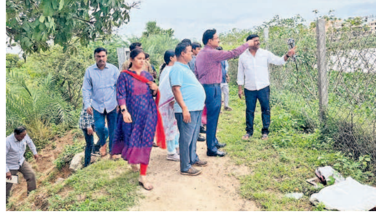
అంబేద్కర్ నగర్ ఇందిరమ్మ చెరువును పరిశీలిస్తున్న హైద్రా కమిషనరీ రంగనాథ్, తాసీల్దార్ సుబలత, కమిషనరీ ప్రతినిధులు

జవహర్ నగర్, సెప్టెంబర్ 4: చెరువులు, ప్రభుత్వ భూముల్లో అక్రమ నిర్మాణాలను సహించడం లేదని, ఎంతటివాడైనా పదిలిపెట్టబోమని హైద్రా కమిషనరీ రంగనాథ్ హెచ్చరించారు.