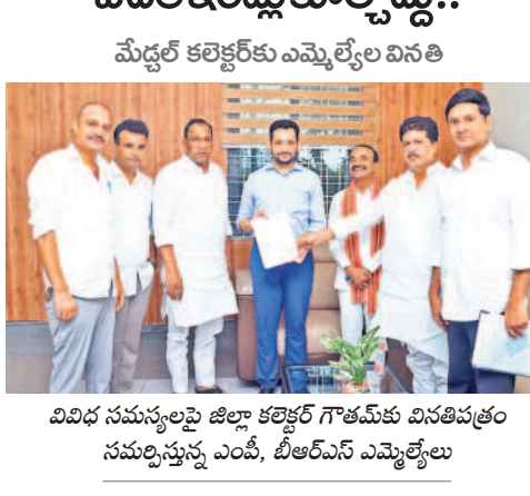
వివిధ సంస్థలపై జిల్లా కలెక్టరీ గౌరవ్ వివరాలు తెలిపిన ఎంజీ కిరెన్ రెడ్డి

మేధూల్ కలెక్టరీ కు ఎమ్మెల్యే ల వివరాలు తెలిపిన ఎంజీ కిరెన్ రెడ్డి