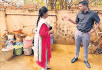
రియల్ టైమ్ గుర్తించారు. ఈ మేరకు మేధూల్ కలెక్టరీ రెవెన్యూ అధికారిని దృష్టిలో ఉంచుకుంటూ...

నిబంధనలకు విరుద్ధంగా రోడ్లను, నారాలను ఆక్రమించుకొని నిర్మాణం చేపడుతున్న వారిపై హైద్రా కమిషనరీ రంగనాథ్ అధికారులతో కలిసి పరిశీలించారు.