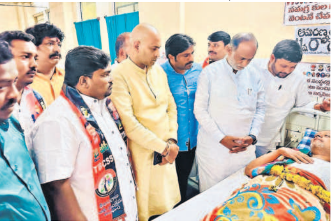
అమరణ నిరాహార దీక్ష చేస్తున్న సామాజిక సంఘాల నాయకులు

బీసీ డిక్షనరీని వెంటనే అమలు చేయాలని నాయకులు అమరణ నిరాహార దీక్ష చేస్తున్నారని బీసీ సంఘాల నాయకులు అన్నారు.