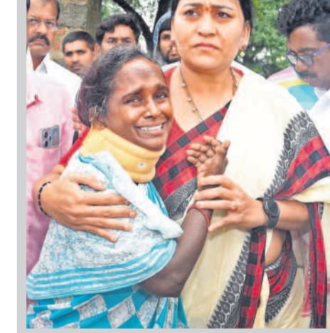
మహబూబాబాద్ జిల్లా నెల్లికుదురు మండలం రావిరాలలో బాధిత కుటుంబాలను ఓదార్చుతున్న మాజీ ఎంపీ, బీఆర్ఎస్ జిల్లా అధ్యక్షురాలు మాలోత్ కవిత్

వర్షాలకు నీట మునిగిన నెల్లికుదురు మండలం రావిరాల గ్రామాన్ని మాజీ ఎంపీ, బీఆర్ఎస్ మహబూబాబాద్ జిల్లా అధ్యక్షురాలు మాలోత్ కవిత్ బుద్ధవారం సందర్శించారు. వరద బీభత్సానికి కాలిన ఇండ్లు, కొట్టుకుపోయిన గొట్ట, ద్వీచక్ర వాహనాలు, కట్ట తెగి చుక్క నీరులేని చెరువును పరిశీలించారు. గడప, గడపకూ తిరిగి బాధితులను అక్కస చేర్చుకుని వారి కన్నీళ్లను తుడిచి ఓదార్చారు. ఈ సందర్భంగా 150 బాధితుల కుటుంబాలకు బియ్యం, కూరగాయలు, నిత్యావసర సరుకులు పంపిణీ చేశారు.