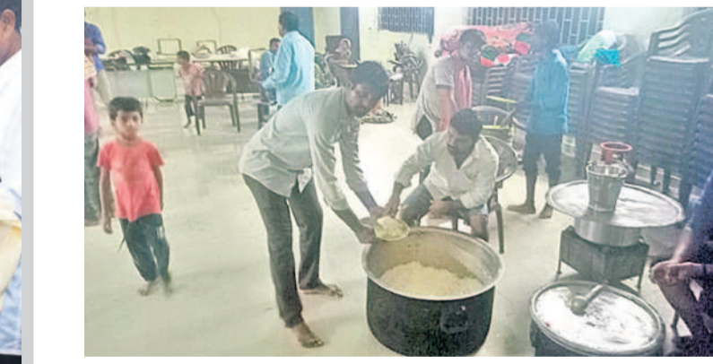
మహబూబాబాద్ జిల్లా లక్ష్మణండాలో బీఆర్ఎస్ ప్రభుత్వం నిర్మించిన రైతువేదికలో భోజనాలు చేస్తున్న సీతారాంతుండా వరద బాధితులు. భారత్ వర్షాలతో ఇబ్బంది పడుతున్న వరద బాధితులకు కన్నీటిపర్యంతమయ్యారు.