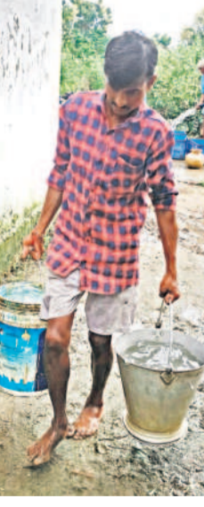
మహబూబాబాద్ జిల్లా నెల్లికుదురు మండలం రావిరాలలో ట్యాంకు నుంచి నీళ్లు పట్టుకుంటున్న ప్రజలు