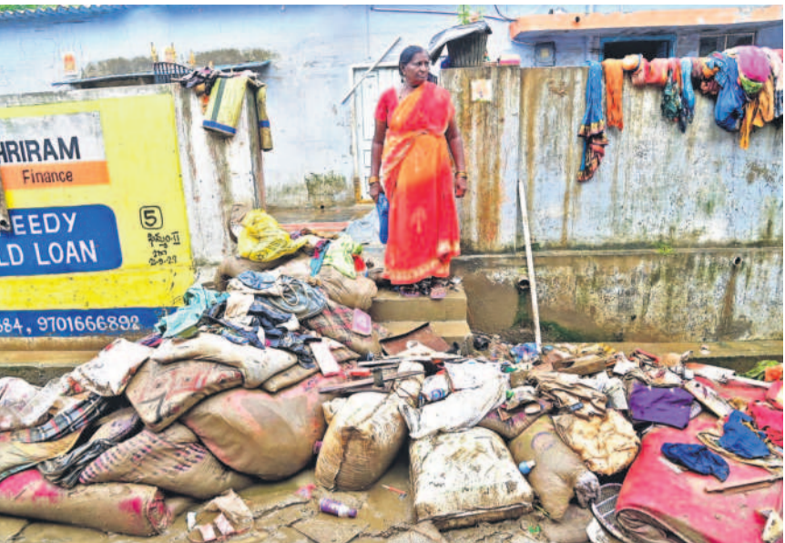
పూర్తిగా తడిచి ఇంటి ముందు పోగువడిన సామగ్రిని ఎలా తీసుకెళ్లాలో తెలియక దీనంగా మాన్యు ఖమ్మం కాలనీస్లో వేసిన వ్యర్థాలు, వక్ర ఖమ్మంలోని కాలనీస్లో బురదతో నిండిన బీద