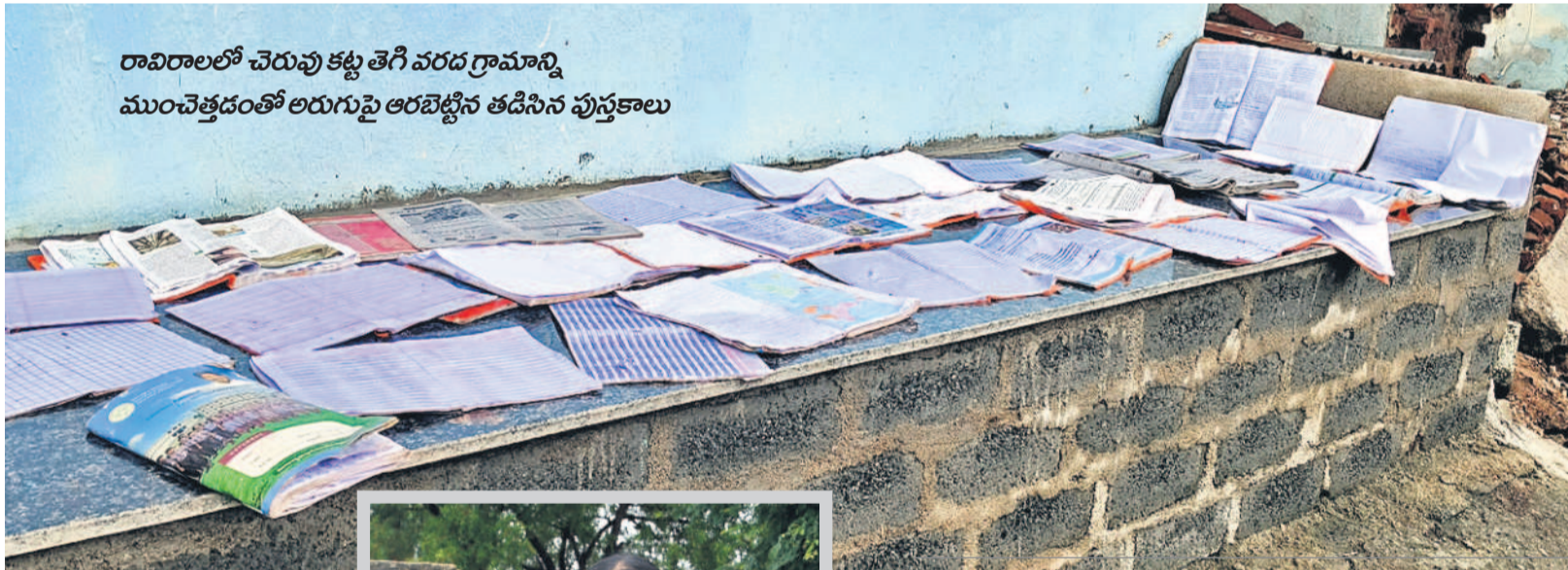
రావిరాలలో చెరువు కట్ట తెగి వరద గ్రామాన్ని ముంచేత్తడంతో అరుగుపై ఆరబెట్టిన తడిసిన పుస్తకాలు