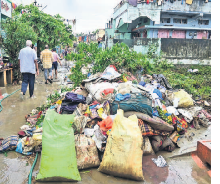
ఖమ్మం కాలనీస్లో తడిచిన పనికొరని సామగ్రిని రోడ్డుపై కుప్ప వేసిన కాలనీవాసులు

వారి బ్యాంకు ఖాతాల వివరాలు సేకరిస్తున్నారు. కొన్ని ప్రాంతాల్లో వైద్య శిబిరాలు ఏర్పాటు చేశారు. బురదతో కూరుకుపోయి మట్టిపట్టిన వాహనాలను వాటి యజమానులు మరమ్మత్తుల కోసం షెడ్యూల్ తరలిస్తున్నారు. ఎఫ్.సి.వి రోడ్డులో నిలిపి ఉన్న లాల్లో బురద పట్టడంతో వాటిని అక్కడే నిలిపి మెకానిక్లతో మరమ్మత్తులు చేస్తున్నారు.