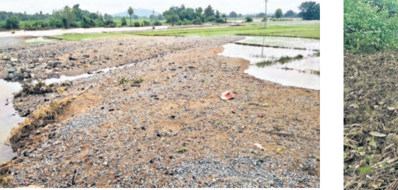
మహబూబాబాద్ జిల్లా కేసముద్రం మండలం వెంకటగిరి సూరారం చెరువు వద్ద వంట పొలాల్లో ఇసుక, కంకర మేటలు