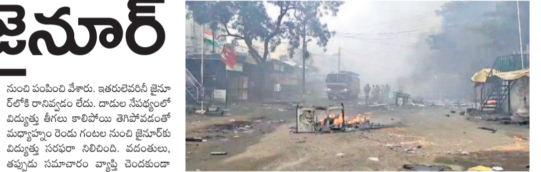
జైనూర్ మండల కేంద్రంలో దగ్ధమవుతున్న వ్యాపార సముదాయాలు