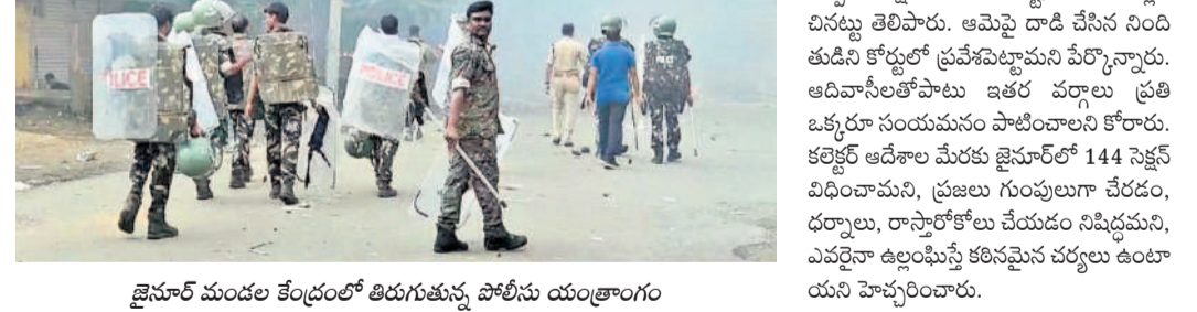
జైనూర్ మండల కేంద్రంలో తిరుగుతున్న పోలీసు యంత్రాంగం

లుగా ఈ విషయాన్ని రావేంకు ప్రయత్నిస్తున్న దని కొన్ని ఆదివాసీ సంఘాలు ఆరోపిస్తున్నాయి. మీ జరగలేదని చెప్పారు. జైనూర్ విద్యుదలంపై పోలీసుల అంధత్వం వివరాలను ఏమీ బయటికి చెప్పడం లేదని పోలీసులకు చెప్పారు.