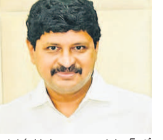
చేందంకు పశువుదాం అని ఆయన 'ఎక్స్'లో పిలుపునిచ్చారు.

మేదారం అటవీ ప్రాంతంలో చెట్లు కూలడంపై మహిళలతో జరిగిన వర్షం పోలీస్ అవేదన