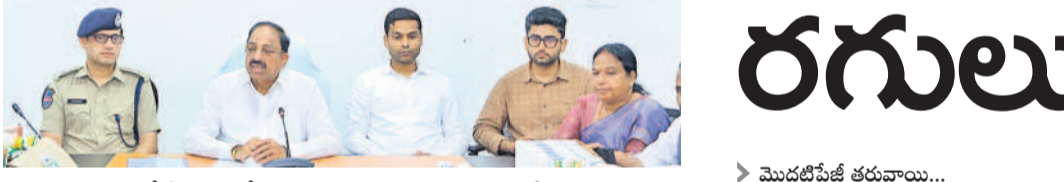
ఖమ్మంలో మీడియాతో మాట్లాడుతున్న మంత్రి తుమ్మల నాగేశ్వరరావు