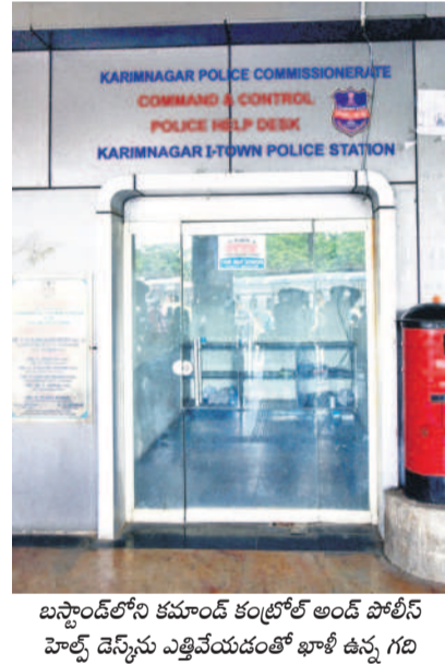
బస్టాండ్ లో కమాండ్ కంట్రోల్ అండ్ పోలీస్ హెల్ప్ డెస్క్ ను ఎత్తేయడంతో భారీ ఉన్న గది