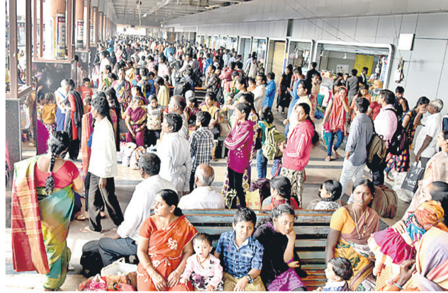
కరీంనగర్ బస్టేషన్ లో ప్రయాణికులు