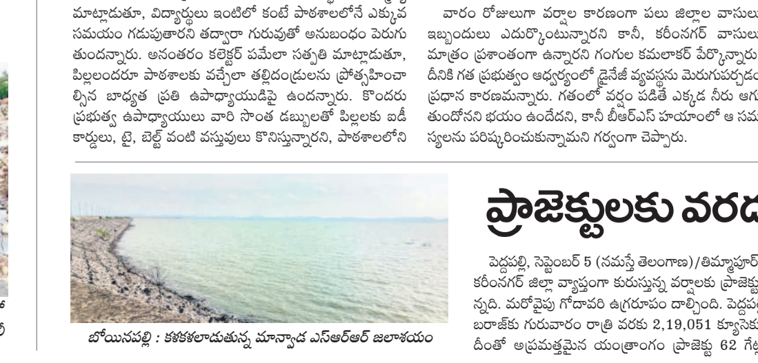
బోయినపల్లి : కళకళాడుతున్న మాన్యూవల్ ఎన్ఆర్ఆర్ జలాశయం