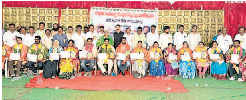
పరిగి: సన్మానం పొందిన ఉత్తమ ఉపాధ్యాయులతో ఎమ్మెల్యే రామ్మోహన్‌రెడ్డి