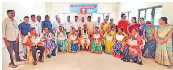
కొడంగల్: లయన్స్ క్లబ్ ఆధ్వర్యంలో ఉపాధ్యాయులకు సన్మానం