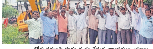
రోడ్డు పనులపై హార్దం వ్యక్తం చేస్తున్న నాయకులు, ప్రజలు