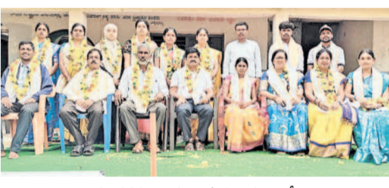
కులకర్ణి బాలికల ఉన్నత పాఠశాలలో..