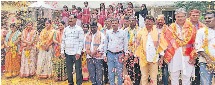
యాలాల: అగ్రసూరు జడ్చీటి సీ పాఠశాలలో ఉపాధ్యాయులపై పూల వర్షం కురిపిస్తున్న విద్యార్థులు