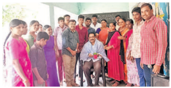
వికారాబాద్: లయన్స్ క్లబ్ ఆధ్వర్యంలో ఉపాధ్యాయులకు సన్మానం