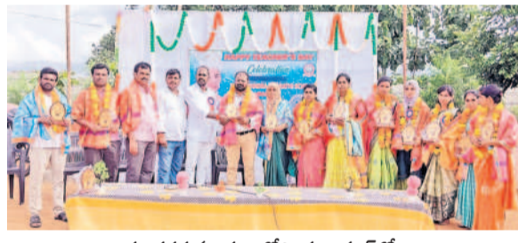
కులకర్ణి మండలంలోని ఘనపూర్లో..

బొంబాయి: డుద్దూల మండల కేంద్రంలో నిర్వహించిన ఉపాధ్యాయ దినోత్సవం