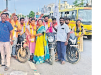
ఎన్ఎఫ్ఐ నాయకులకు స్వాగతం పలుకుతున్న స్థానికులు