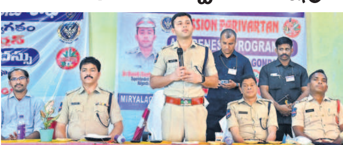
నడమల్లో మాట్లాడుతున్న ఎస్. శరత్ చంద్రవర్మ

మిర్యాలగూడ, సెప్టెంబర్ 5: నల్లగొండను మాదకద్రవ్యాల రహిత జిల్లాగా మార్చడమే లక్ష్యంగా పని చేస్తున్నట్లు ఎస్. శరత్ చంద్రవర్మ అన్నారు. మిర్యాలగూడలో గంజాయి సేవించి పట్టుబడిన 180 మంది యువకులకు వారి తల్లిదండ్రుల సమక్షంలో మిషన్ పరివర్తన కార్యక్రమంలో భాగంగా గురువారం పట్టణంలోని లక్ష్మీకార్టెజ్ లో కౌన్సిలింగ్ నిర్వహించారు. ఈ సందర్భంగా ఎస్. శరత్ చంద్రవర్మ జిల్లా వ్యాప్తంగా అన్ని పోలీస్ స్టేషన్లలో గంజాయి టిప్సింగ్ కిట్లు అందుబాటులో ఉన్నాయని, డ్రాగ్ అండ్ డ్రైవ్ టిమ్ లు మోడీ రింగ్ పోలీసులు ప్రతి రోజు గంజాయి నిర్వహించాలన్నారు. గంజాయి, మాదకద్రవ్యాల తీసుకోవడం వల్ల యువతకు తమ బంగారు భవిష్యత్తును నాశనం చేసుకుంటుందన్నారు. గంజాయి, ఇతర మాదకద్రవ్యాలను సేవించే కఠిన చర్యలు తప్పవని హెచ్చరించారు. మాదకద్రవ్యాల క్రయవిక్రయాలను