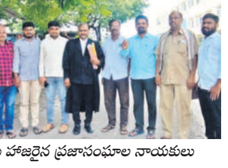
కోర్టుకు హాజరైన ప్రజాసంఘాల నాయకులు

నల్లగొండ సీట్, సెప్టెంబర్ 5 : ఆర్డీఓ సమ్మె కాలం పాటి కేసులను ఎత్తివేయాలని ఆర్డీఓ ఉద్యోగ, ప్రజా సంఘాల నాయకులు డిమాండ్ చేశారు. 2019లో ఆర్డీఓ సమ్మె కాలంలో పెట్టిన కేసులకు