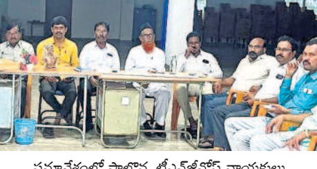
సమావేశంలో పాల్గొన్న టీఎన్జీపీస్ నాయకులు