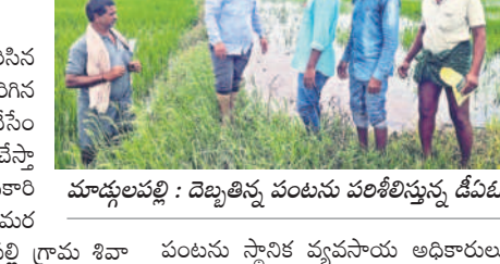
మాధులపల్లి : దెబ్బతిన్న పంటను పరిశీలిస్తున్న డీపిఓ