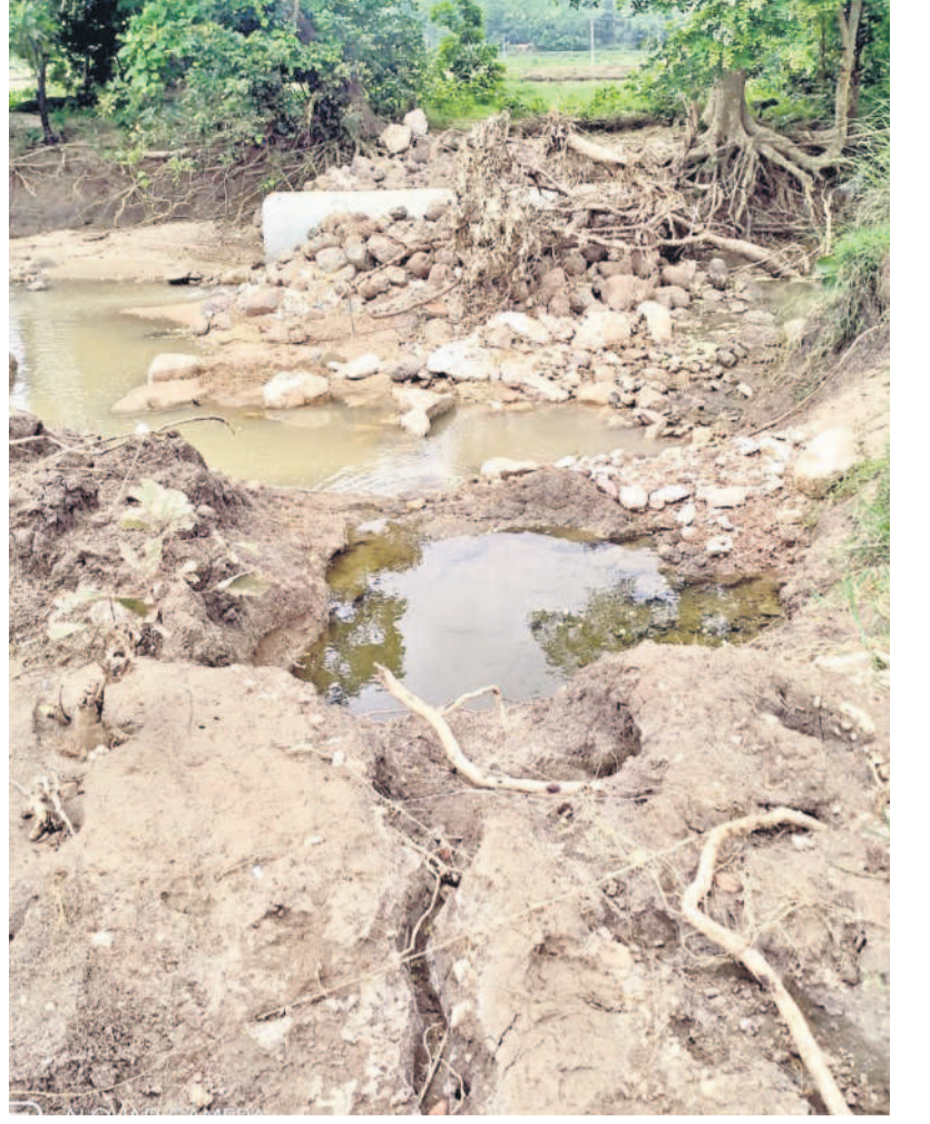
సర్కాపూర్ (జి) మండలంలో దెబ్బతిన్న రోడ్డు

ఇప్పటివరకు వ్యవసాయ శాఖ అధికారులు క్షేత్రస్థాయిలో నీట మునిగిన పంటల వివరాలను గాని, ఇసుకమేటల విషయంలో గాని పరిశీలించి నివేదించిన వెల్లడించకపోవడంపై రైతులపై ప్రభుత్వానికి ఏమేరకు చిత్తశుద్ధి ఉన్నదో స్పష్టమవుతున్నది. అధికారులు మొదటి రోజు నుంచే జిల్లాలో