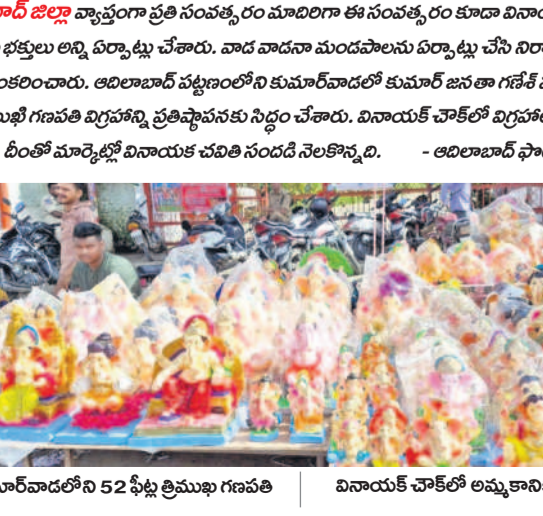
కుమారవారడోని 52 ఫీట్లు లెంబుగి గణపతి | వినాయక చవితిలో అమ్మకానికి సిద్ధంగా విగ్రహాలు

అదిలాబాద్ జిల్లా వ్యాప్తంగా ప్రతి సంవత్సరం మూదిగా ఈ సంవత్సరం కూడా వినాయక చవితి ఉత్సవాలకు భక్తులు అన్ని ఏర్పాట్లు చేశారు. వాడ వాడూ మండలాలను ఏర్పాట్లు చేసి నిర్వాహకులు అందంగా ఆలంకరించారు. అదిలాబాద్ పట్టణంలోని కుమారవారడో కుమార జనతా గణేశ్ మండలి వారు 52 ఫీట్లు లెంబుగి గణపతి విగ్రహాన్ని ప్రతిష్ఠాపనకు సిద్ధం చేశారు. వినాయక చవితిలో విగ్రహాల దుకాణాలు వెలిగి యి. దీంతో మార్కెట్లో వినాయక చవితి సందర్భం నెలకొనింది. సెప్టెంబర్ 6