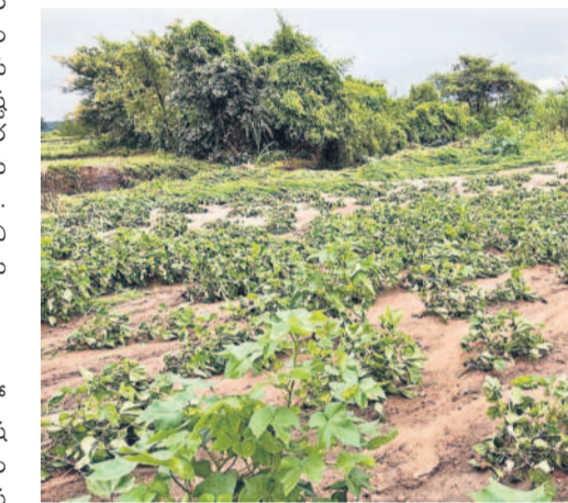
భారీ వర్షాలకు లక్షణాచారం మండలంలో దెబ్బతిన్న వత్తిపంట, కోతకు గురైన రోడ్డు

ఎక్కడ కూడా పెద్దగా నష్టం జరుగలేదంటూ చేతులు దులుపుకుంటున్నారు. జిల్లాలోని పంచాయతీరాజ్, అరిఅంబీశాఖల పరిధిలోని రోడ్లు, వంతెనల పరిస్థితి సైతం భారీ వర్షాల కారణంగా దయనీయంగా మారింది. చాలా చోట్ల రోడ్లు తెగిపోవడం, వంతెనలు దెబ్బతిని నడంలాంటివి జరిగినప్పటికీ సంబంధిత శాఖల అధికారులు వాటి మరమ్మతులకు సంబంధించి అంచనాలను కూడా రూపొందించకపోవడంపై విస్మయం వ్యక్తమవుతున్నది. ముఖ్యంగా పలు మారుమూల మండలాలకు సంబంధించి వాగులు, వంకలు ఉప్పొంగడంతో అక్కడిలో తెలివే పంటలు.. బీజీ, పలు మేటల రోడ్లు కొట్టుకుపోయాయి. పలు కాలువలకు సైతం గండ్లు పడ్డట్లు రైతులు పేర్కొంటున్నారు.