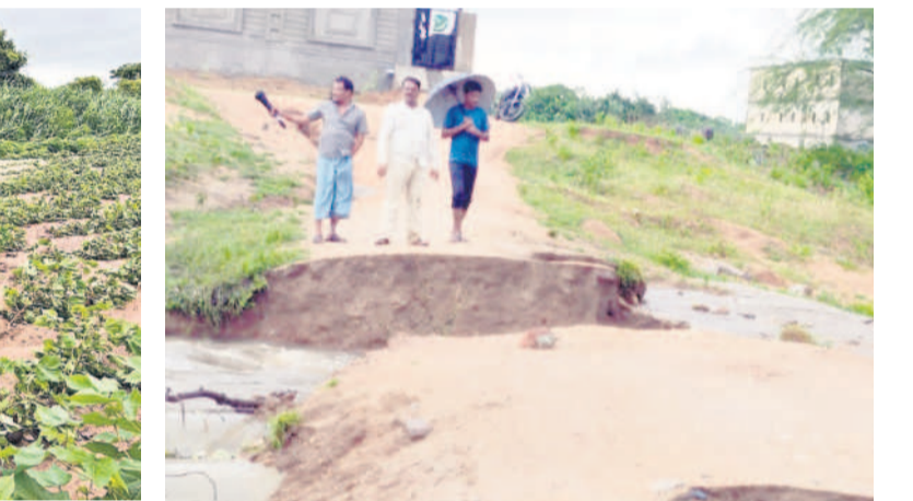
భారీ వర్షాలకు లక్షణాచారం మండలంలో దెబ్బతిన్న వత్తిపంట, కోతకు గురైన రోడ్డు