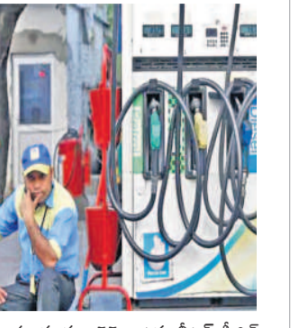
అప్పుడు రూ. 55గా ఉన్న లీటర్ డీజిల్ ధర ఇప్పుడు రూ. 97కు చేరింది.

పెట్రో బాధ్యుడిగా, సెప్టెంబర్ 8 (నమస్తే తెలంగాణ): పెరిగిన నిత్యావసరాల ధరలతో కుదించుకున్న సామాన్య జనం