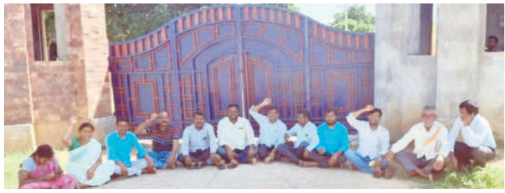
రూరూపూర్ సైనిక శిక్షణ పాఠశాల ఎదుట ఆంధోళన చేస్తున్న పేరెంట్స్ కమిటీ సభ్యులు