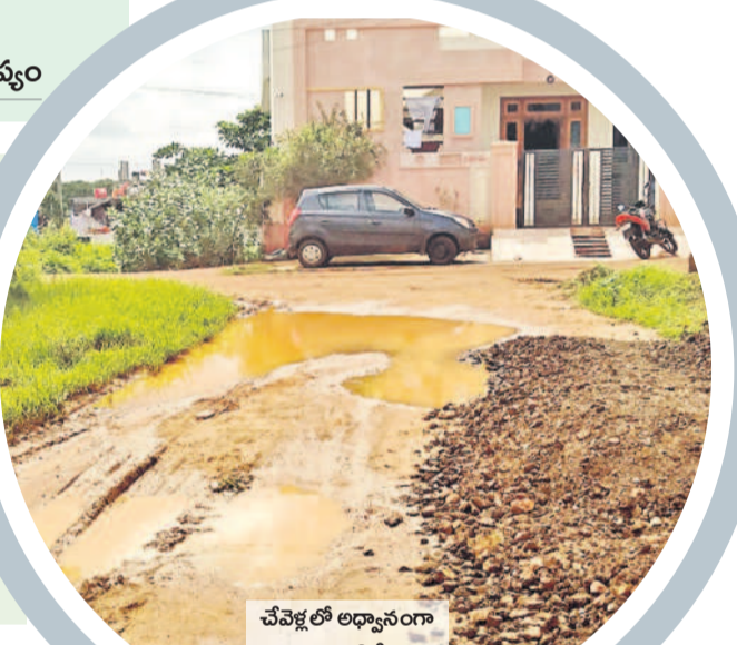
చేవేళ్లలో అధ్యానంగా మారిన ఓ వీధి

మాఫీ పంటి వాటిలో బీజా ఉండడంతో తుది నివేదికను రూపొందించడంలో జాప్యం జరుగుతున్నట్లు సమాచారం. ఇతర శాఖలు సైతం జరిగిన నష్టాన్ని తేల్చకపోవడంతో ప్రభుత్వం తరపున చేపట్టే సహాయక చర్యల్లోనూ జాప్యం జరుగుతున్నది. నీజినల్ భయం.. ఓ వైపు వర్షాలు.. మరోవైపు పంచాయితీల పాలన మొక్కజొన్న సాగుతుండడంతో పల్లెలను వ్యాధులు చుట్టుముడుతున్నాయి. వర్షాలకు వీడ్పాటుపై బురదమయంగా మారాయి. చెత్తాచెదారం పేరుకు పోతున్నది. దీంతో పల్లెలు, పట్టణాల్లో పారిశుద్ధ్య నిర్వహణ అస్పష్టంగా మారింది. ఎడతెరిపి లేకుండా కురుస్తున్న వర్షాలతో అంటు వ్యాధులు ప్రబలుతున్నాయి. విష జ్వరాలతోపాటు డెంగి కేసులూ అధిక సంఖ్యలో సమాధివుతున్నాయి. ఇప్పటికే జిల్లాలో వేల సంఖ్యలో వైరల్ హీపర్ కేసులు నమోదు అవుతుండగా.. డెంగి కేసులు సైతం 200లకు చేరువలో ఉన్నాయి. పంచాయితీలను నిధుల కొరత వేధిస్తుండడంతో సకాలంలో సహాయక చర్యలు చేపట్టే పరిస్థితిలో ప్రత్యేక అధికారులు లేరు. వర్షాలు తగ్గముఖం చూపకపోవడం.. పారిశుద్ధ్య నిర్వహణ అలాగే ఉంటే.. పరిస్థితి చెయి దాటి పోయే ప్రమాదం ఉందని గ్రామీణులు, పట్టణవాసులు అందోళన వ్యక్తం చేస్తున్నారు.