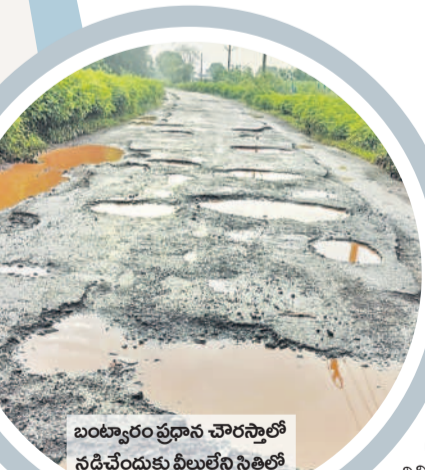
బంటూర్ల ప్రధాన చౌరస్తాలో నడిచేందుకు వీలులేని స్థితిలో ఉన్న ఆర్ అంబండి రోడ్డు

అయితే మరీ దారుణంగా తయారైంది. మండల కేంద్రాల నుంచి గ్రామాలకు వెళ్లే రోడ్లతోపాటు గ్రామాల్లో అంతర్గత రోడ్లు ఎక్కడ చూసినా బురద, గుంతలతో దర్భాసమవుతున్నాయి. గ్రామాల్లో ఓ వైపు వర్షపు నీరు నిలవడం, బురద ఉండడంతో దోపిడుగులు వ్యాప్తి చెంది ప్రజలు రోగాల బారిన పడుతున్నారు. గుంతల రోడ్లకు పాల కులు మరమ్మతులు చేపట్టకపోవడంతో వాహనదారులు అసహనం వ్యక్తం చేస్తున్నారు. కాంగ్రెస్ ప్రభుత్వం అధికారంలోకి వచ్చిన తర్వాత ఒక్క రూపాయి రోడ్ల అభివృద్ధికి ఖర్చు చేయకపోవడం గమనార్హం.