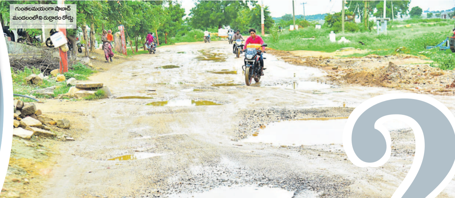
గుంతలమయంగా షాబాద్ మండలంలోని రుద్దారం రోడ్డు