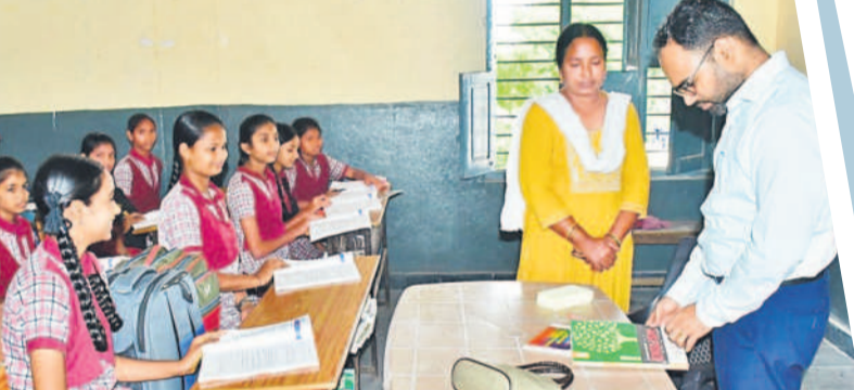
శంషాబాద్ మండలంలోని జిల్లా పరిషత్ ఉన్నత పాఠశాలలో లిక్కరూపు పరీక్షిస్తున్న రంగారెడ్డి కలెక్టర్ శశాంక

రంగారెడ్డి కలెక్టర్ శశాంక.. భవిష్యత్ కేంద్రం, జడ్పీ ఉన్నత పాఠశాలలు ఆకస్మిక తనిఖీ