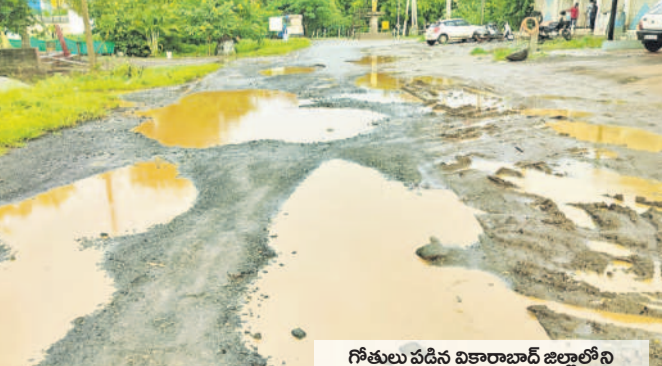
గోకులు వడిన వికారాబాద్ జిల్లాలోని తొలుమామిడి-కేసారం ఆర్ అంబండి రోడ్డు

గత వారం, పది రోజులుగా కురుస్తున్న వర్షాలతో జిల్లాలోని రోడ్లు గతుకులమయంగా మారాయి. ఏ రోడ్డును చూసినా కంకర తేలి, గుంతలు పడి బురదమయంగా నడిచేందుకు వీలులేకుండా ఉన్నాయి. దీంతో పాదచారులు, వాహనచోదారులు రాకపోకలకు తీవ్ర ఇబ్బందులు పడుతున్నారు. కాగా గుంతలు పడిన రోడ్ల మరమ్మతులకు ప్రభుత్వం చర్యలు చేపట్టకపోవడంతో అసంతోషం వ్యక్తం చేస్తున్నారు. వికారాబాద్, సెప్టెంబర్ 6 (నమస్తే తెలంగాణ) : జిల్లాలో కురుస్తున్న వర్షాలకు రోడ్లు అధ్యానంగా మారాయి. జిల్లాలోని గ్రామీణులు, పట్టణ ప్రాంతాల్లోని ఏ రోడ్డును చూసినా కంకర తేలి, గుంతలు పడి బురదమయంగా మారాయి. అంతేకాకుండా కొన్ని ప్రాంతాల్లోని రోడ్లు వర్షపు నీటితో చిన్న కుంటలను తలపిస్తుండడంతో పాదచారులు, వాహనచోదారులు రాకపోకలకు తీవ్ర ఇబ్బందులు పడుతున్నారు. అత్యవసర పరిస్థితుల్లో గుంతల రోడ్లపై అంబులెన్స్ డ్రైవర్లు కూడా ఇబ్బందులు పడుతున్నారు. దీంతో సమయానికి రోగులకు దవాఖానాలకు చేర్చు లేకపోతున్నారు. ప్రధానంగా వికారాబాద్-మోమిన్ పేట వెళ్లే రహదారి, మోమిన్ పేట-మర్రిపల్లి రోడ్డు, వికారాబాద్-కోట్ పల్లి రోడ్డు, బోండానిపేట మండల కేంద్రం నుంచి గ్రామాలకు వెళ్లే రోడ్లు, దౌల్తాబాద్ మండలంలోని రోడ్లు, తాండూరు-పెద్దేముల్ వెళ్లే రోడ్డు, మోమిన్ పేట-శంకర్ పల్లి వెళ్లే రోడ్డున్నట్లు పెద్ద పెద్ద గుంతలు ఏర్పడడంతో ద్విచక్రవాహనాలపై వెళ్లే వారు ప్రమాదాల బారిన పడుతున్నారు. సీఎం దేవేంద్రేడ్డి సొంత నియోజకవర్గమైన కొండ గల్ లోని రోడ్డు అధ్యానంగా మారాయి. గ్రామాల్లో