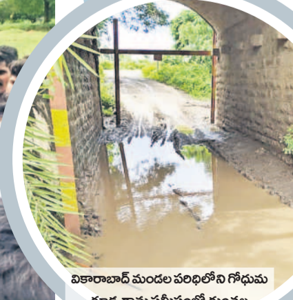
వికారాబాద్ మండల పరిషత్లోని గోధుమ గూడ గ్రామ సమీపంలో గుంతల మయంగా మారిన రోడ్డు

గత వారం, పది రోజులుగా కురుస్తున్న వర్షాలతో జిల్లాలోని రోడ్లు గతుకులమయంగా మారాయి. ఏ రోడ్డును చూసినా కంకర తేలి, గుంతలు పడి బురదమయంగా నడిచేందుకు వీలులేకుండా ఉన్నాయి. దీంతో పాదచారులు, వాహనచోదారులు రాకపోకలకు తీవ్ర ఇబ్బందులు పడుతున్నారు. కాగా గుంతలు పడిన రోడ్ల మరమ్మతులకు ప్రభుత్వం చర్యలు చేపట్టకపోవడంతో అసంతోషం వ్యక్తం చేస్తున్నారు. వికారాబాద్, సెప్టెంబర్ 6 (నమస్తే తెలంగాణ) : జిల్లాలో కురుస్తున్న వర్షాలకు రోడ్లు అధ్యానంగా మారాయి. జిల్లాలోని గ్రామీణులు, పట్టణ ప్రాంతాల్లోని ఏ రోడ్డును చూసినా కంకర తేలి, గుంతలు పడి బురదమయంగా మారాయి. అంతేకాకుండా కొన్ని ప్రాంతాల్లోని రోడ్లు వర్షపు నీటితో చిన్న కుంటలను తలపిస్తుండడంతో పాదచారులు, వాహనచోదారులు రాకపోకలకు తీవ్ర ఇబ్బందులు పడుతున్నారు. అత్యవసర పరిస్థితుల్లో గుంతల రోడ్లపై అంబులెన్స్ డ్రైవర్లు కూడా ఇబ్బందులు పడుతున్నారు. దీంతో సమయానికి రోగులకు దవాఖానాలకు చేర్చు లేకపోతున్నారు. ప్రధానంగా వికారాబాద్-మోమిన్ పేట వెళ్లే రహదారి, మోమిన్ పేట-మర్రిపల్లి రోడ్డు, వికారాబాద్-కోట్ పల్లి రోడ్డు, బోండానిపేట మండల కేంద్రం నుంచి గ్రామాలకు వెళ్లే రోడ్లు, దౌల్తాబాద్ మండలంలోని రోడ్లు, తాండూరు-పెద్దేముల్ వెళ్లే రోడ్డు, మోమిన్ పేట-శంకర్ పల్లి వెళ్లే రోడ్డున్నట్లు పెద్ద పెద్ద గుంతలు ఏర్పడడంతో ద్విచక్రవాహనాలపై వెళ్లే వారు ప్రమాదాల బారిన పడుతున్నారు. సీఎం దేవేంద్రేడ్డి సొంత నియోజకవర్గమైన కొండ గల్ లోని రోడ్డు అధ్యానంగా మారాయి. గ్రామాల్లో