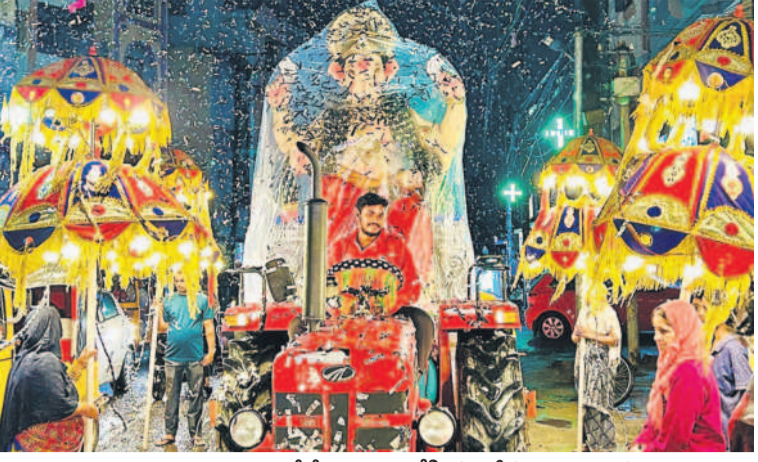
వినాయక విగ్రహాలను ప్రతిష్ఠించే వేదిక వద్దకు ఉర్రోగింపుగా తీసుకెళ్లిన, నిర్వాహకులు