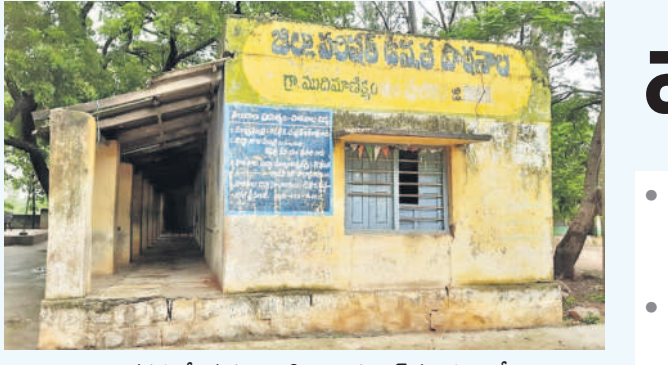
శిథిలావస్థకు చేరిన సంగారెడ్డి జిల్లా పుల్లూర్ మండలంలోని ముదిమాణిక్యం జిల్లా పరిషత్ ఉన్నత పాఠశాల