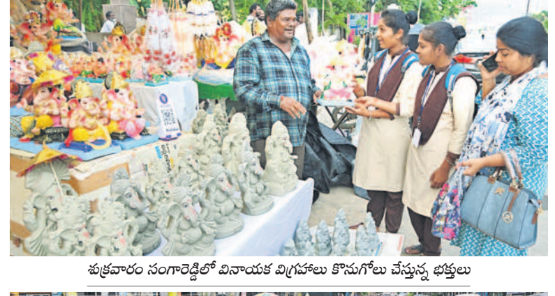
శుక్రవారం సంగారెడ్డిలో వినాయక విగ్రహాలు కొనుగోలు చేస్తున్న భక్తులు