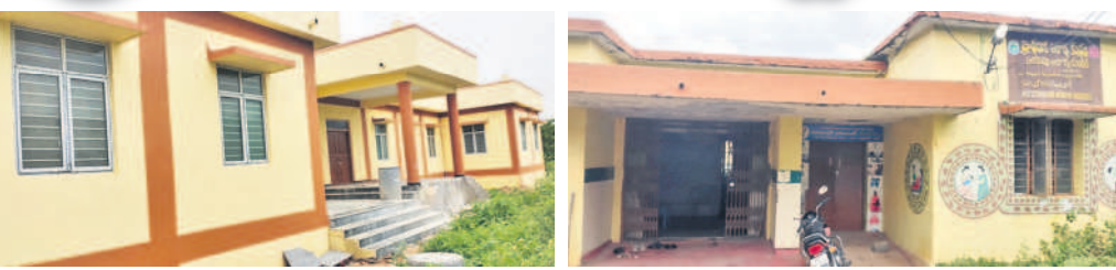
ప్రారంభానికి సిద్ధంగా ఉన్న డౌలబ్లాడ్ నూతన ఆరోగ్యకేంద్ర భవనం (Left) శిథిలావస్థకు చేరిన డౌలబ్లాడ్ ప్రాథమిక ఆరోగ్యకేంద్ర భవనం (Right)