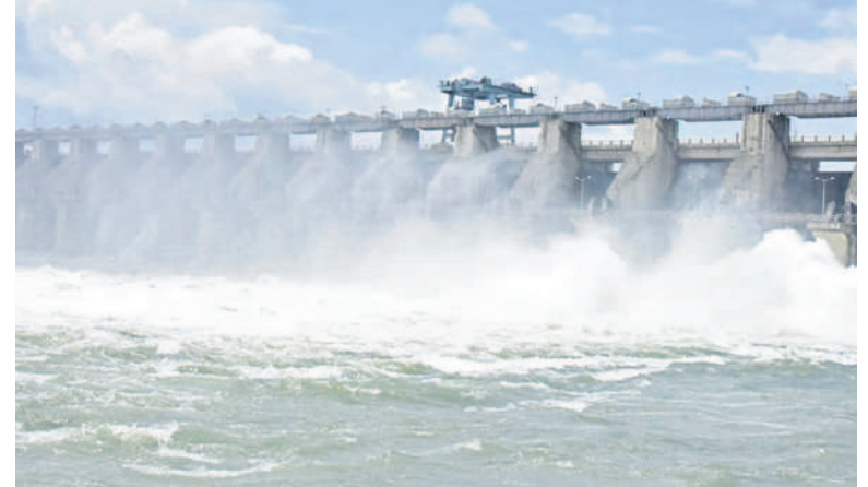
సింగూరు ప్రాజెక్టు క్రస్ట్ గేటు ఎత్తడంతో దిగువకు వెళ్తున్న వరద నీరు