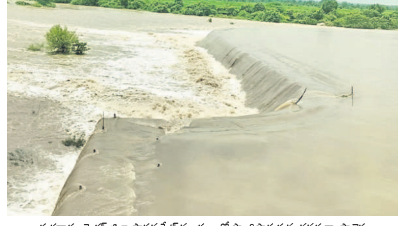
శుక్రవారం మెదక్ జిల్లా పాపన్నపేట్ మండలంలో పొంగిపొర్లుతున్న వనదుర్గా ప్రాజెక్టు