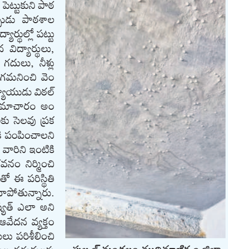
పుల్లూర్ మండలం ముదిమాణిక్యం జిల్లా పరిషత్ ఉన్నత పాఠశాల పైకప్పు నుంచి గదుల్లోకి వస్తున్న వర్షపు నీరు

పుల్లూర్, సెప్టెంబర్ 6: సంగారెడ్డి జిల్లా పుల్లూర్ మండలంలోని ముదిమాణిక్యం జిల్లా పరిషత్ ఉన్నత పాఠశాల ప్రమాదం అంచుకు చేరింది. ఐదు రోజులుగా కురుస్తున్న భారీ వర్షాలకు పాఠశాల గదుల్లోకి నీళ్లు చేరాయి. పురాతన బిల్డింగ్ కావడంతో స్టాఫ్ మొత్తం టీటలుబారి వర్షపు నీళ్లు క్లాస్ రూమ్లోకి వచ్చి అక్కడి నుంచి బయటకు వస్తున్నాయి. విద్యార్థులు బిక్కుబిక్కు పం