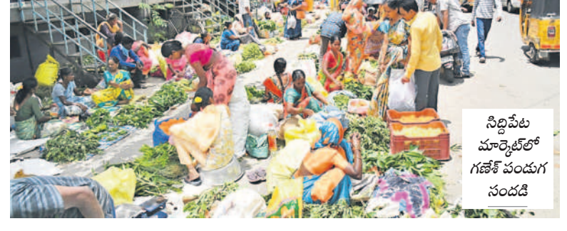
సిద్దిపేట మార్కెట్లో గణేశ్ పండుగ సందడి