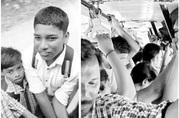
ఆర్డీసీ బస్సు ప్రమాదాల్లో నిలబడిన ప్రయాణికులు