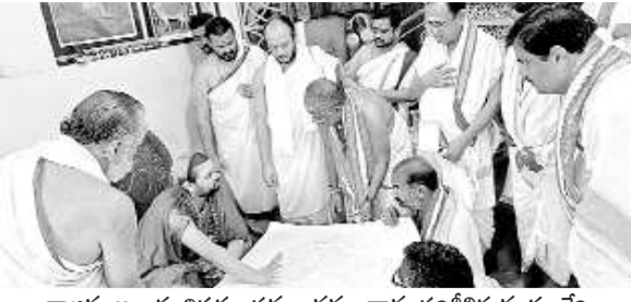
రాజన్న ఆలయ విస్తరణ పనుల నమూనాను పరిశీలిస్తున్న శ్రీకారం వేసే అంశాలపై భారత్ స్టాంపు