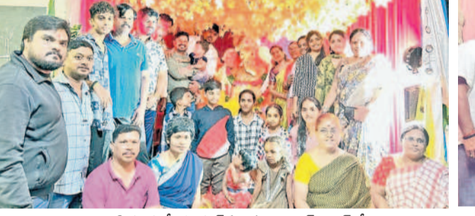
వారానిగూడలో భజనం ఏవెన్యూ అపార్ట్ మెంట్లో పూజలందుకొంటున్న గణేశుడు