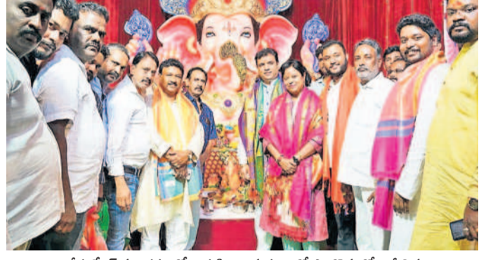
బేగంపేట్ మండపంలో నిర్వహించిన పూజల్లో పాల్గొన్న కోట సీలిమ