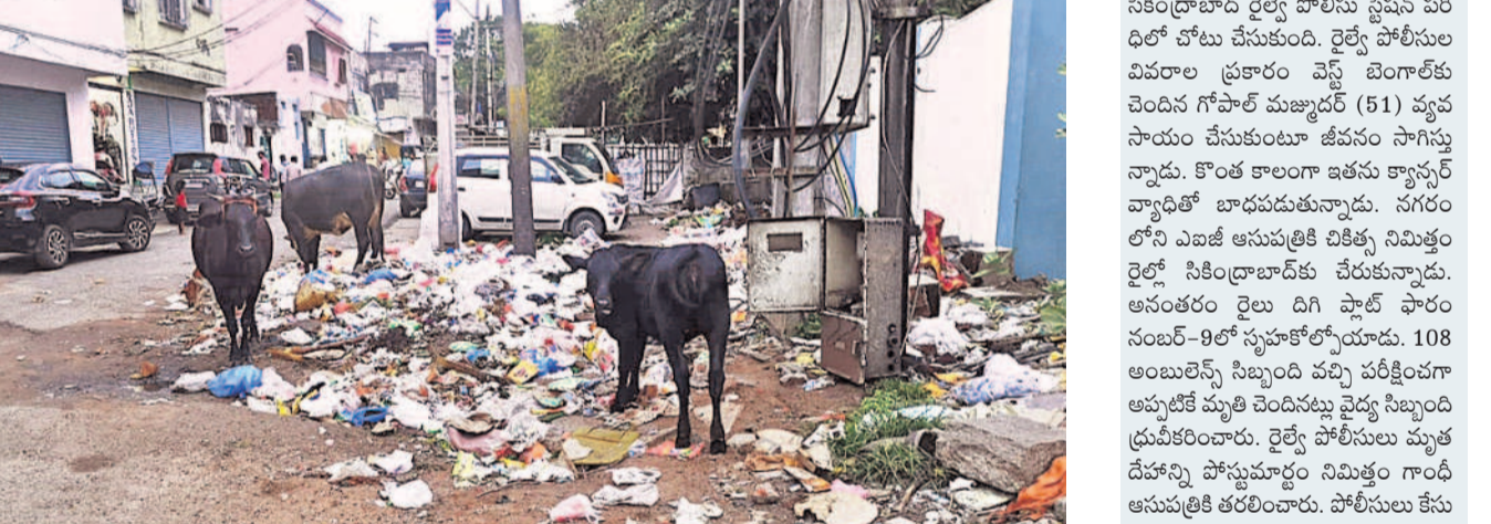
కంటోన్మెంట్ ఎనిమిదో వార్డులోని బోల్లారం రిసాలెన్సరీలో చెత్తకుండి వద్ద అద్యాప్తమైన పరిస్థితి నెలకొంది. కొన్ని రోజులుగా కంటోన్మెంట్ పరిశుభ్య సిబ్బంది చెత్తను తొలగించడం లేదు. దీంతో దుర్వాసన రావడంతో స్థానికులు తీవ్ర ఇబ్బందులు పడుతున్నారు. కంటోన్మెంట్ సిబ్బంది చెత్తను తొలగించి సమస్యను పరిష్కరించాలని స్థానికులు కోరుతున్నారు. - బోల్లారం