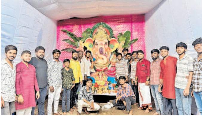
బోయిగూడ ఐడీఎస్కాలనీలో మూడో నంబర్ బ్లాక్ వద్ద శ్రీమహాశక్తి ఫ్రంట్స్ అసోసియేషన్ ఆధ్వర్యంలో 29వ వార్షిక నవరాత్రి ఉత్సవాల్లో భాగంగా ఏర్పాటు చేసిన వినాయకుడు. - బి.స్వీ.లాల్పేట్