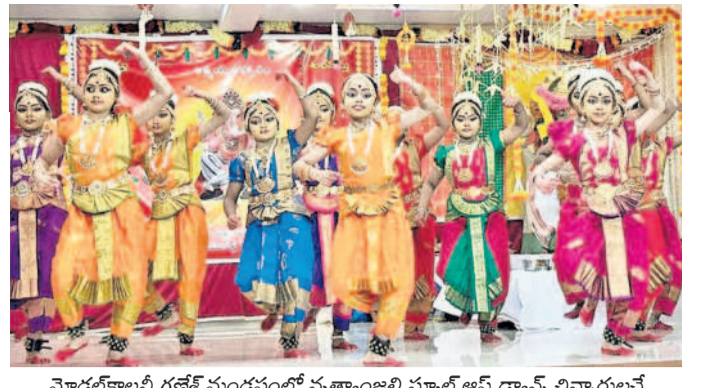
మోడల్ కాలనీ గణేశ్ మండపంలో స్వత్యాంజలి స్మారక్ ఆఫ్ డ్యాన్స్ విన్నాయకులచే భరతనాట్య ప్రదర్శన - ఆమీర్పేట్

బోలకొండలో మల్లన్న గుడి వద్ద భవాని యంగ్ స్కూల్ ఏర్పాటు చేసిన వేంకటేశ్వర స్వామి దూపంలో కొలువైన వినాయకుడు అందరినీ ఆకట్టుకుంటున్నాడు.