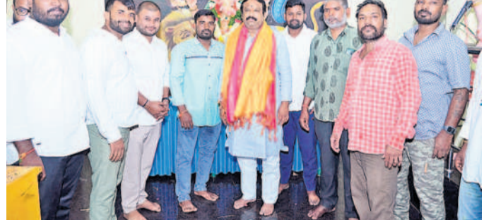
నందమూరినగర్ మండపంలో వినాయకుడికి పూజలు నిర్వహించిన అనంతరం ఎమ్మెల్యే శ్రీ గణేశ్, తదితరులు