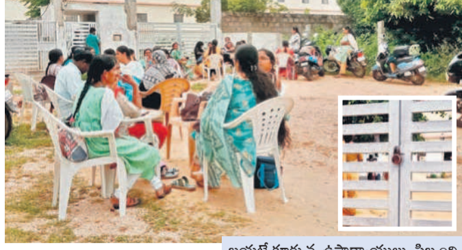
బయల్ కారున్న ఉపాధ్యాయులు, సిబ్బంది (ఇన్ సెట్) పాఠశాల గేటుకు వేసిన తాళం