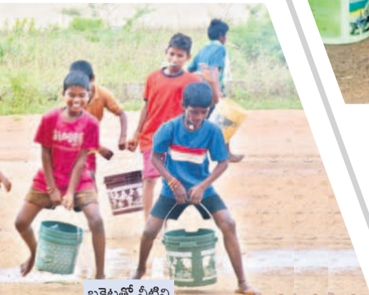
బిట్లతో నీటిని మోసుకొస్తున్న విద్యార్థులు