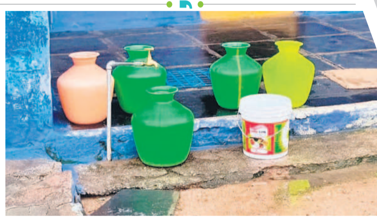
మిషన్ భగీరథ నీటి కోసం బిందెలు వంచగా పెట్టుకున్న కొండాపురం గ్రామస్థులు