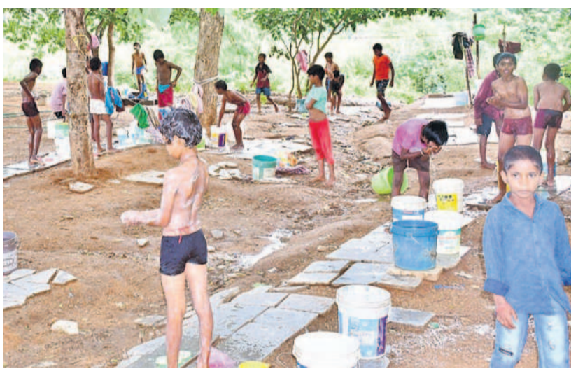
గద్దాల అర్చన రెసిడెన్షియల్ పాఠశాల ఆవరణలో స్నానమాచరిస్తున్న విద్యార్థులు

వర్షాలు కురుస్తున్నా కురుస్తున్నా.. విద్యాలయాల్లో నీటి