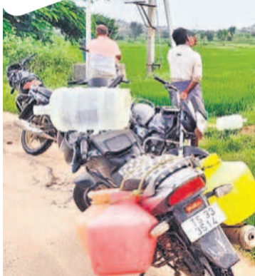
వ్యవసాయ బోర్డు వద్ద నుంచి తాగునీటిని తీసుకెళ్తున్న కొండాపురం గ్రామస్థులు