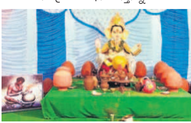
అచ్చంపేటలో కుండలు తయారు చేస్తున్నట్లు ఏర్పాటు చేసిన గణేశుడి విగ్రహం

అచ్చంపేట, సెప్టెంబర్ 9 : అచ్చంపేట పట్టణంలో శాలివాహన యువ జనసభం ఆధ్వర్యంలో కుండలు తయారు చేస్తున్నట్లు ఏర్పాటు చేసిన గణేశుడి విగ్రహం భక్తులను ఆకట్టుకుంటున్నది. మండలంలో మళ్ళీ కుండలు తయారు చేసే కమిటీని ఏర్పాటు (సారె), నల్ల, రాయి, చేతికర్ర ఉపయోగం వారు. మళ్ళీపాతల వాడకం వల్ల అనేక లాభాలు ఉన్నా యిది తెలియజేయడం తోపాటు మనషి పుట్టక నుంచి చావు వరకు ఏదో ఒక రూపంలో మళ్ళీ పాతల ఉపయోగం, సంబంధాన్ని వివరించే ప్రదర్శనలతో ప్రజలకు అవగాహన కల్పిస్తున్నారు. అయితే ఏటా కొత్త రూపంలో విషయకుడి విగ్రహాన్ని ప్రతిష్ఠిస్తున్న శాలివాహన సంఘం యువకులను ప్రజలు ఆసీనం డిస్పూనారు.