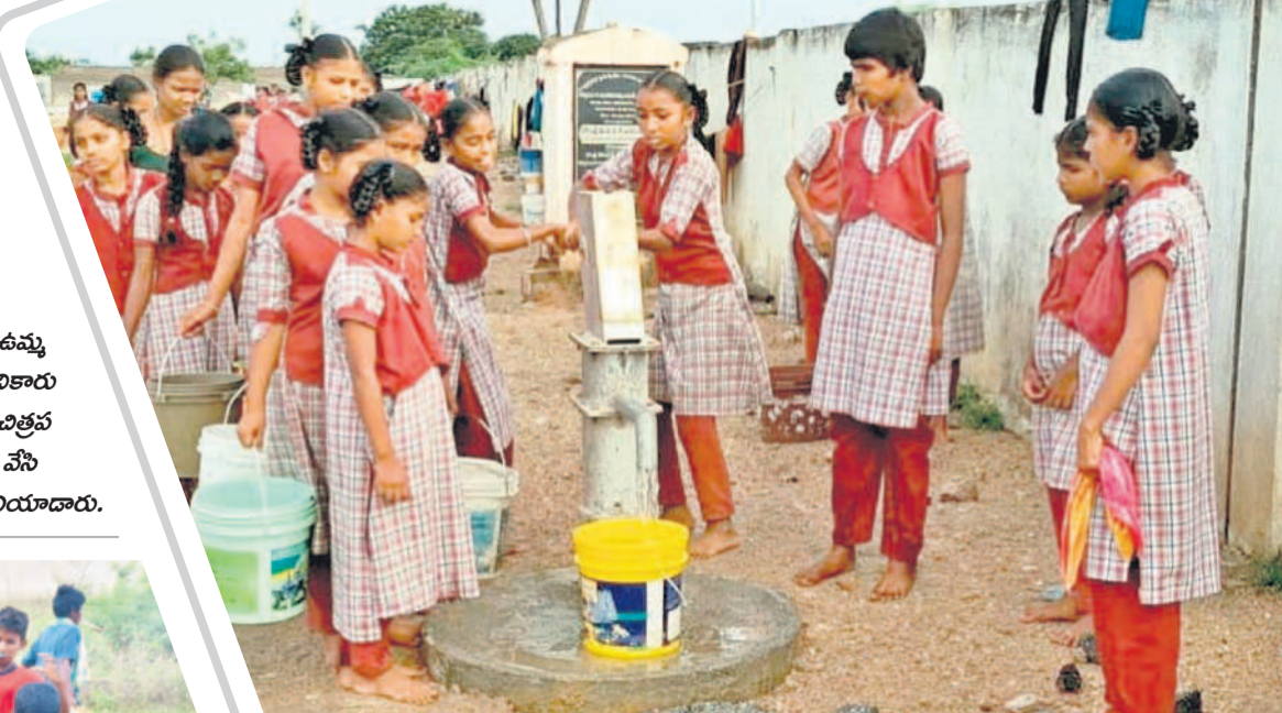
అయిజ కేజీబీవీ పాఠశాల ఆవరణలో నీటి కోసం వేతిపంపు వద్ద బిట్లతో నిల్వను విద్యార్థినులు

కాలాన్ని ఆయుధంగా మార్చి తన రచనల ద్వారా ప్రజల్లో చైతన్యం కల్పించిన ప్రజాకవి కాళోజీ నారాయణరావుకు సోమవారం ప్రజలు నివాళులర్పించారు. ఉమ్మడి జిల్లా వ్యాప్తంగా లభికారులు, ప్రజాప్రతినిధులు చిత్తవడం బాగికి పూలమాలలు వేసి ఆయన నవలను కొనియారారు.