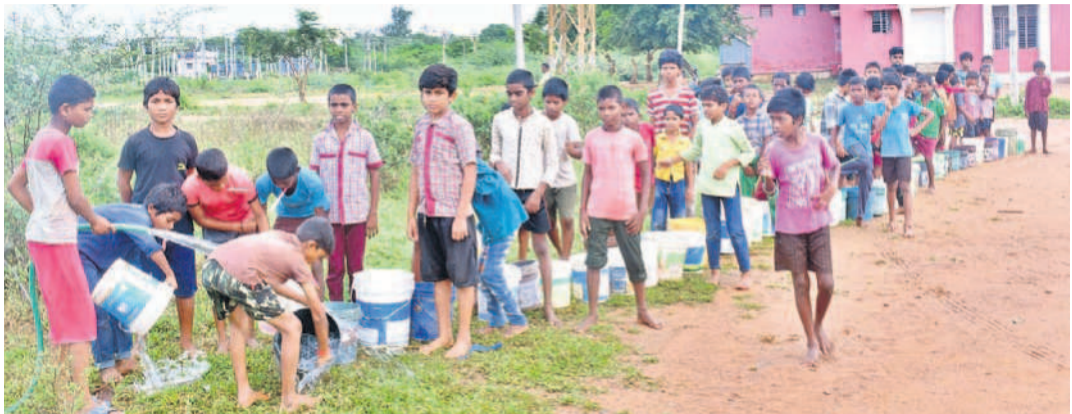
గద్దాల అర్చన రెసిడెన్షియల్ పాఠశాల ఆవరణలోని ప్రైవేట్ బోరు వద్ద నీటి కోసం బిట్లతో బాలురుబిందిన విద్యార్థులు