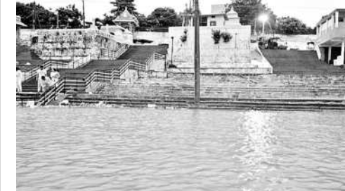
భద్రాచలం : గోదావరి వరద ప్రవాహం

బూర్గంపూడి (భద్రాచలం), సెప్టెంబర్ 9 : ఎగువ నుంచి వస్తున్న వరదతో భద్రాచలం వద్ద గోదావరి నీటిమట్టం పెరుగుతున్నది. సోమవారం సాయంత్రం 6 గంటల వరకు నీటికడగా ఉన్న నీటిమట్టం 27.9 అడుగులకు చేరింది. ఎగువన కురుస్తున్న వర్షాలతోపాటు తాలిపేరు ప్రాజెక్టు 24 గేట్లు ఎత్తిన అధికారులు లక్షా 40 వేల క్యూసెక్కుల నీటికి దిగువకు వదిలారు. ఒడిషా, ఛత్తీస్ గఢ్ రాష్ట్రాల్లో భారీ వర్షాలు కురవడంతో శబరి వద్ద వరద ప్రవాహం ఎక్కువగా ఉంది. దీంతో ఆ వరద పోడికత్తడంతో భద్రాచలం వద్ద మరింతగా నీటిమట్టం పెరుగుతోంది. రాత్రికి గోదావరి వరద ప్రవాహం మరింతగా పెరుగుతున్నట్లు అధికారులు అంచనా వేస్తున్నారు. ఇప్పటికే లోతట్టు ప్రాంత ప్రజలు అప్రమత్తంగా ఉండాలని అధికారులు సూచించారు.