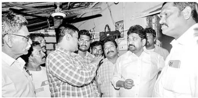
బాంబు బ్లాస్టింగ్తో దెబ్బతిన్న ఇళ్లను పరిశీలిస్తున్న మట్లా దయానంద్

నక్కవల్లిలోని కిష్టారం వద్ద 250 ఇళ్లు పూర్తిగా దెబ్బతిన్నాయి. ఇటీవల వారం రోజులూ కురుస్తున్న భారీ వర్షాల కారణంగా కాలనీలో అనేక ఇళ్లు మెల్లకకు చిద్రమయ్యాయి. బాధితులంతా స్థానిక ఎమ్మెల్యే మట్లా దయానంద్ దృష్టికి తీసుకెళ్లి విషయాన్ని వివరించారు. బాధితుల ఇబ్బందులను తెలుసుకున్న రాష్ట్ర కాంగ్రెస్ నాయకుడు డాక్టర్ మట్లా దయానంద్ విజయకుమార్ సోమవారం కిష్టారం వద్ద ఎమ్మీ కాలనీని ఓపీ పీఠ్ ఎం.పి.సరసింహారావు తీసుకొని వెళ్లి దెబ్బతిన్న ఇళ్లను సందర్శించారు. పూర్తిగా దెబ్బతిన్న ఇళ్లను పరిశీలించిన దయానంద్ బాధితులతో మాట్లాడారు. దెబ్బతిన్న ఇళ్లను పరిశీలించడానికి దయానంద్తో వచ్చిన పీఠ్ సరసింహారావు బాధితులు ఆగ్రహం వ్యక్తం చేశారు. బాంబు బ్లాస్టింగ్ కారణంగా ఇళ్ల కాలు తున్న విషయపై ఎమ్మెల్యే కలెక్టర్తో మాట్లాడారు. కిష్టారం వద్ద కాలనీలో బ్లాస్టింగ్ కారణంగా దెబ్బతిన్న ఇళ్లను స్వయంగా పరిశీలించాలని కోరారు. ఆయన వెంట ఏఎంసీ వైర్లను డోమ్ ఆనంద్కుమార్, నాయకులు ఉన్నారు.