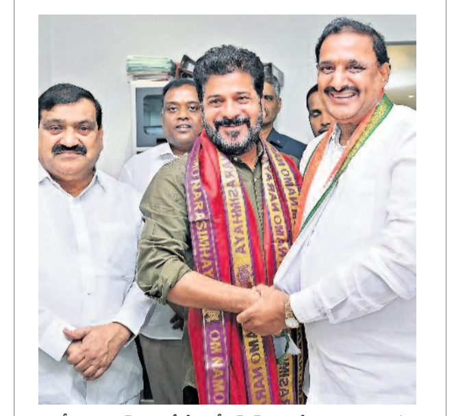
జిల్లాల కాంగ్రెస్ పార్టీలో చేరిన బీఆర్ఎస్ ఎమ్మెల్యే అలికేపాడి గాంధీకి పార్టీ కండువా కట్టి అభ్యుదయ ముఖ్యమంత్రి రేవంత్ రెడ్డి

చేనేత రుణాలు మాఫీ చేస్తం బతుకమ్మ చీరల బకాయిలు రూ.290 కోట్లు విడుదల సీఎం రేవంత్ సంచలన సభ్యులకు ఏడాదికి రెండు చీరలు ఐబిఎచ్ఎస్ ఏర్పాటు చేసి కొండాలక్ష్మణ్ పేరు పెడతాం > 6