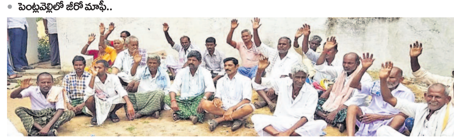
499 మందిలో ఏ ఒక్కరికీ వర్తించలేదు సాసెటి ఎదుట రైతుల బైరాయింపు

నాగర్ కర్నూల్ జిల్లా పెంట్లవెల్లి సింగిల్ డివిజన్లో 499 మంది రైతులు రుణాలు తీసుకుంటే ఏ ఒక్కరికీ మాఫీ కాలేజీ రైతుల వాపోయారు. మూడు విడతల్లో ఒక్క రైతుకు కూడా మాఫీ కాకపోవడం గమనార్హం. వివరాలు తెలుసుకోవాలి. కాంగ్రెస్ పార్టీ మాలన ఎమ్మెల్యేలపై అనర్హత పేరు వేయాలన్న పిటిషన్లపై అసెంబ్లీ కార్యదర్శికి ఉత్తర్వులు జారీ చేస్తున్నట్లు తెలిపింది. నాలుగు వారాల వ్యవధిలో విచారణ షెడ్యూల్ను ప్రకటించాలని సుప్రీంకోర్టు ఆదేశించింది. ఆ వివరాల నివేదికను హైకోర్టు రిజిస్ట్రార్ (జ్యుడిషియల్) కు నివేదించాలని సుప్రీంకోర్టు ఆదేశించింది. సుప్రీంకోర్టు తీర్పు మాకు ప్రామాణికం.