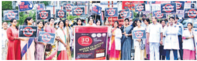
తెలంగాణవోకే వద్ద నిరసన తెలుపుతున్న డాక్టర్లు