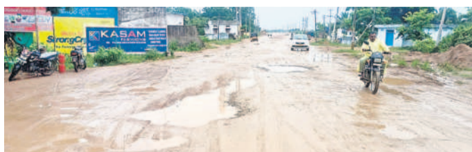
వీణవంకలో గంతలతో కరీంనగర్-జమ్మికుంట ప్రధాన రహదారి