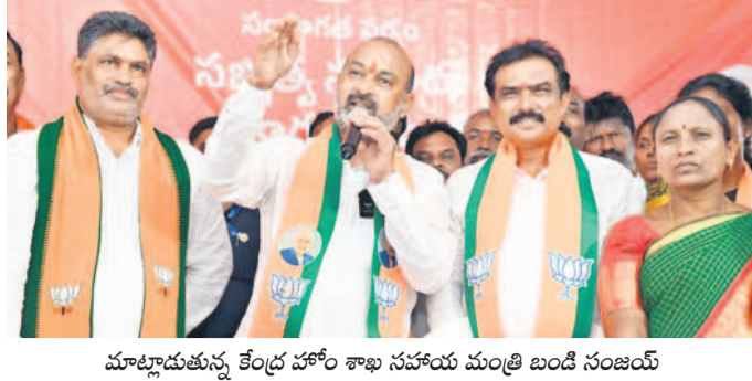
మాట్లాడుతున్న కేంద్ర హోం శాఖ సహాయ మంత్రి బండీ సంజయ్