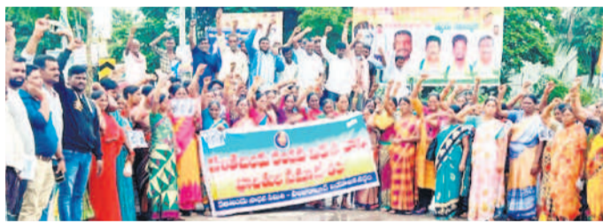
ఇల్లండకుంటలో నిరసన తెలుపుతున్న లబ్ధిదారులు