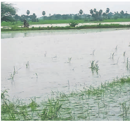
హజూర్ నగర్ మండలం బూరుగడ్డలో నీటి మునిగిన వరి పొలాలు

హజూర్ నగర్ రూరల్, సెప్టెంబర్ 9 : కొద్ది రోజులుగా కురుస్తున్న వర్షాలకు చెరువులు నిండిపోతున్నాయి. అక్కడక్కడ గండ్ల పడుతున్నాయి. హజూర్ నగర్ మండలంలోని బూరుగడ్డ గ్రామ చెరువుకు వరద ఉధృతి పెరుగడంతో నీళ్లు కట్ట మీది నుంచి పొంగి పొరాయి. ఠాంకో చెరువు కింద ఉన్న సుమారు 50 ఎకరాల వరి పంట నీటి మునిగింది. నష్టపోయిన తమను ఆదుకోవాలని రైతులు ప్రభుత్వాన్ని కోరుతున్నారు.