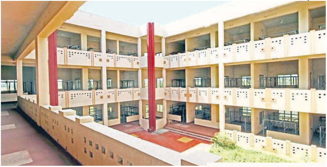
ఐఐఐఐటీ ఏర్పాటుకు కేటాయించిన కనుమకల్లలోని హ్యాండ్లమ్ పార్క్

‘సాంకేతిక నైపుణ్యం, నిరుద్యోగ యువతకు ఉద్యోగ అవకాశాలు కల్పించాలని మొన్న జరిగిన శాసనసభలో కొత్త శాసనం చేసినం.. యంగ్ ఇండియా స్కీల్ యూనివర్సిటీని ఫోర్ట్ సిటీలో నిర్మించాలని 60 ఎకరాల స్థలాన్ని కేటాయించినం.. దాదాపు 200- 300 కోట్లతో నిధులతో పనులు ప్రారంభించాం. వచ్చే సంవత్సరం నుంచి అక్కడ కళాశాల ప్రారంభించడం ద్వారా అంతర్జాతీయ స్థాయిలో ఐఐఐఐటీకి గుర్తింపు తీసుకురావాలని ప్రభుత్వం నిర్ణయం తీసుకుంది.’ ఇవి హైదరాబాద్ లో సోమవారం జరిగిన చేనేత సమావేశంలో సీఎం రేవంత్ రెడ్డి ఆసన్న వ్యాఖ్యలు.