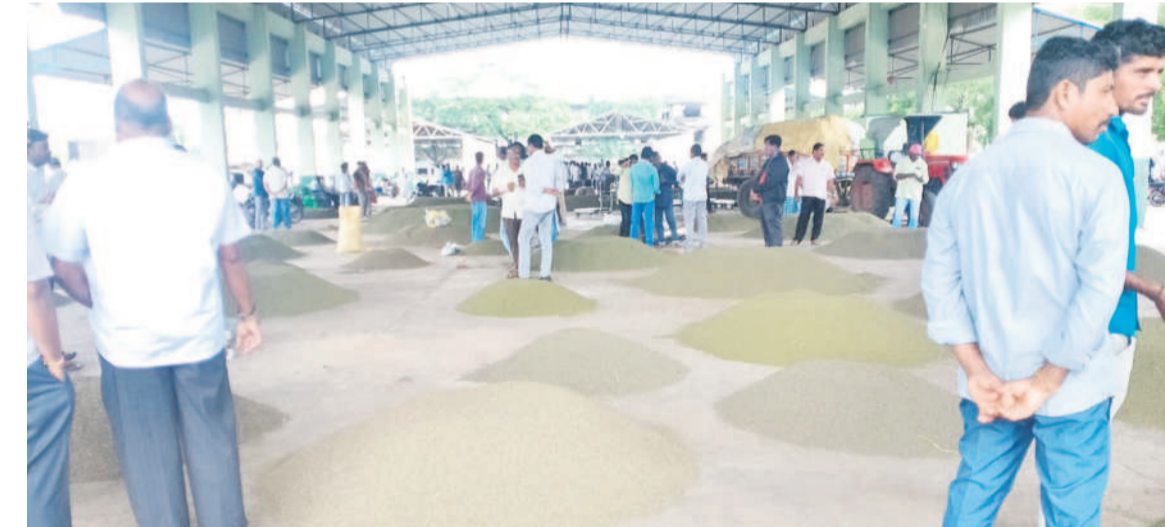
ఖమ్మం వ్యవసాయ మార్కెట్లో అపరాల యార్డుకు రైతులు తీసుకొచ్చిన పెసర్లు