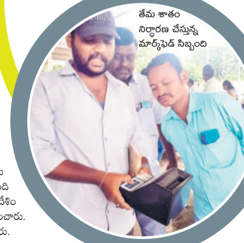
తేమ శాతం నిర్ధారణ చేస్తున్న మార్కెట్ సిబ్బంది

ఖమ్మం వ్యవసాయం, సెప్టెంబర్ 10 : మార్కెట్లో సిండికేట్గా మారిన పైవేటి వ్యాపారులు రైతులు పండించిన పెసర్లకు మద్దతు ధర రాకుండా చేస్తున్నారనే ఆరోపణలు ఉన్నాయి. ఆరుగంట శ్రమించి పంట పండించినా ధర దక్కడం లేదని రైతుల నుంచి తీవ్ర వ్యతిరేకత రావడంతో గత నెల 31న ఖమ్మం, చైదా వ్యవసాయ మార్కెట్లలో మార్కెట్ డెవలప్మెంట్ అథారిటీలో పెసర్ల కొనుగోలు కేంద్రాలను ఏర్పాటు చేశారు. పంట ఉత్పత్తుల కొనుగోళ్ల బాధ్యతను మార్కెట్ పంతులు ఉంటేనే మార్కెట్ అధికారులు కొనుగోలు చేసే అవకాశం ఉండడం.. ఈ క్రమంలోనే ఖమ్మం మార్కెట్లకు వారంతపు సెలవులు రావడం.. భారీ వర్షాలు, వరదల కారణంగా అధికారులు జిల్లాలో సెలవులు ప్రకటించారు. వర్షాలతో రైతులు పంట ఉత్పత్తులను విక్రయానికి తీసుకురాలేని పరిస్థితి ఏర్పడింది. కొనుగోలు కేంద్రాలు ప్రారంభించిన నాటి నుంచి క్రయవిక్రయాలు జరిగిన నాలుగైదు రోజుల్లో సైతం ఒక్క రైతు పంటను కూడా అధికారులు కొనలేకపోయారు. జిల్లావ్యాప్తంగా ఈ ఏడాది రైతులకు దాదాపు 15 వేల ఎకరాల్లో పెసర పంట సాగు చేశారు. దీంతో 40 వేల క్వింటాళ్ల దిగుబడి వచ్చే అవకాశం ఉందని అధికారులు అంచనా వేశారు. అయితే కొనుగోలు కేంద్రాలు ప్రారంభమయ్యే నాటికి రైతులు మార్కెట్లకు పంట ఉత్పత్తులను తీసుకురావడం ప్రారంభించారు. ఈ ఏడాది పెసర పంటకు మద్దతు ధర క్వింటా రూ.8,882 అయితే నిబంధనల సవరణ పరిస్థితులు చేస్తూ.. లేదా.. అనేది వేచి చూడాలి.