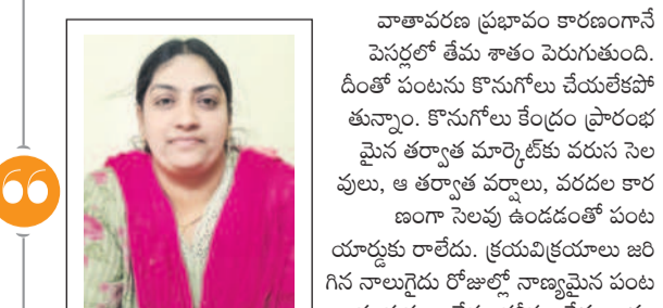
వాతావరణ ప్రభావం కారణంగానే పెసర్లలో తేమ శాతం పెరుగుతుంది.