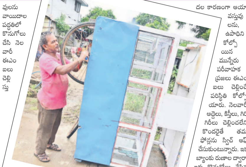
ఖమ్మం కాలనీయల్లో తోపుడు బండిని లిఫ్టు చేస్తున్న వ్యాపాల

ఖమ్మం, సెప్టెంబర్ 10 (నమస్తే తెలంగాణ ప్రతినిధి) : పేద, మధ్యతరగతి ప్రజల జీవనాన్ని మున్నేరు వరదలు పూర్తిస్థాయిలో దెబ్బతీశాయి. వారి కష్టమంతా వరదపాలైంది. దాదాపు ఖమ్మం నగరంలోనే సుమారు 30 వేల కుటుంబాలు వరద దెబ్బకు వలచిపోతున్నాయి. ఇంట్లోని నిత్యావసర సరుకులు, వంట సామగ్రి, విలువైన ఫర్నిచర్, దుస్తులు, ఇతర సామగ్రి మొత్తం నష్టపోయారు. ఒక్కో ఇంటికి దాదాపుగా రూ. 2 లక్షల చొప్పున నష్టం లెక్కగట్టినా అధికారిక గణాంకాల ప్రకారం.. 5 వేల ఇళ్లకు రూ.100 కోట్లకు పైగా నష్టం వాటిల్లినట్లువుతోంది. ఇవికాకుండా వివిధ రకాల మేటి రియల్టీ, ఇతర వస్తువులు కలుపుకొని దాదాపు 15 వేల కుటుంబాలకు రూ.లక్ష చొప్పున అంచనా వేసినా మరో రూ.150 కోట్ల నష్టం వాటిల్లినట్లువుతోంది. అంటే.. కేవలం ఖమ్మం నగరంలోనే.. అదీ కుటుంబాల వారీగానే రూ.250 కోట్ల మేర నష్టం జరిగినట్లు. ఇవికాకుండా ప్రభుత్వరంగా రోడ్లు, డ్రైయింజ్, విద్యుత్, ఇతర కర్రలూ నష్టమూ రూ.కోట్లలోనే ఉంటుంది. పేద, మధ్యతరగతి ప్రజలపైనే అధిక భారం మున్నేరు వరదపాతంలో అత్యధికంగా పేద, మధ్యతరగతి ప్రజలే నివసిస్తున్నారు. వీరంతా పలు రకాల వస్తు