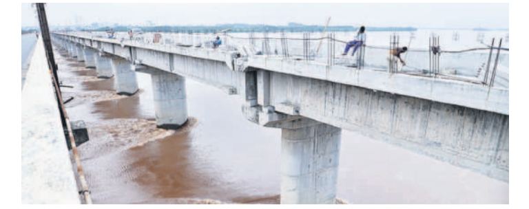
రెండు బ్రిడ్జిల మధ్య ఉరకలెత్తుతున్న గోదావరి