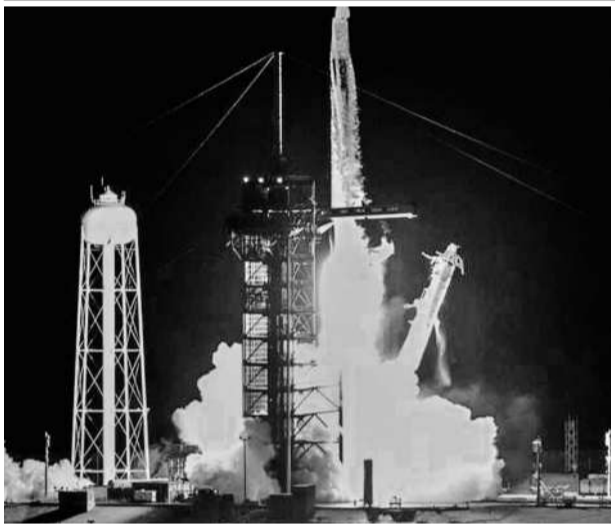
తొలి ప్రైవేట్ స్పేస్ వాక్ నలుగురు వ్యోమాములను నిగిలోకి పంపిన 'స్పేస్ ఎక్స్'

ఖమ్మం ఎడ్యుకేషన్, సెప్టెంబర్ 10: జాతీయస్థాయిలో నవంబర్ 19న జరుగుతున్న నేషనల్ అభివృద్ధి నిర్వహణలో భాగంగా మంగళవారం జిల్లా వ్యాప్తంగా అన్ని సూక్ష్మ న్యాన్ ప్రాక్టీస్ పరీక్షను నిర్వహించారు. మున్సిపల్ వరదలతో ఇంకా కోలుకోని జడ్పీయూపిఎస్ జలగంనగర్, ఎంపీపీఎస్ జలగంనగర్, జీపావేఎస్ నయాలజాం, జీపీఎస్ నయాలజాం, ఎంపీపీఎస్ ఆర్ కాలనీ పాఠశాలలు మినహా జిల్లా వ్యాప్తంగా అన్ని పాఠశాలల్లోనూ మంగళవారం ఈ పరీక్షను నిర్వహించారు. 3, 6, 9 తరగతులకు అన్ని యాజమాన్యాల్లో తెలుగు, ఇంగ్లీష్ మీడియంలో ఈ పరీక్షను నిర్వహించారు. 21,452 మంది విద్యార్థులకు గాను 15,144 మంది విద్యార్థులు హాజరయ్యారు. మొత్తం మూడు ప్రాక్టీస్ టెస్టులకు మంగళవారం మొదటిది పూర్తయింది. రెండో నమూనా పరీక్ష సెప్టెంబర్ 30న, మూడో నాడైన పరీక్ష నవంబర్ 8న నిర్వహించనున్నారు.