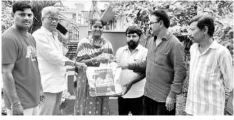
రఘునాథపాలెం: సరుకులు అందజేస్తున్న బీఆర్ఎస్ నేతలు, మధిర రూరల్: ఆర్థికసాయం అందజేస్తున్న మాజీ సర్పంచ్, వేంసూరు: బియ్యం, నగదును అందజేస్తున్న మాజీ సర్పంచ్