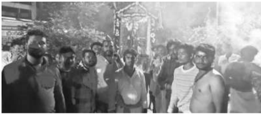
పాండురంగాపురంలో స్వామివారికి పల్లకీ సేవ నిర్వహిస్తున్న భక్తులు