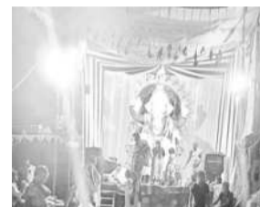
శ్రీనివాసనగర్ లోని వినాయకుడు మండలం వద్ద ఉత్సవ కమిటీ సభ్యులు సరస్వతి పూజా కార్యక్రమాన్ని నిర్వహించారు.

రఘునాథపాలెం, సెప్టెంబర్ 10: గణేశ్ నవరాత్రి ఉత్సవాల్లో భాగంగా ఖమ్మం పాండురంగాపురంలోని శ్రీనివాస గణేశ్ ఉత్సవ కమిటీ ఆధ్వర్యంలో వినాయకుడికి పల్లకీ సేవ కార్యక్రమాన్ని మంగళవారం సుందం నిర్వహించారు. వినాయకుడి ఉత్సవ ముహూర్తం పల్లకీ సేవ కార్యక్రమాన్ని మంగళవారం సుందం నిర్వహించారు. వినాయకుడి ఉత్సవ ముహూర్తం పల్లకీ సేవ కార్యక్రమాన్ని మంగళవారం సుందం నిర్వహించారు.