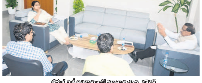
ట్రైపుల్ ఐటీ అధికారులతో మాట్లాడుతున్న కలెక్టర్

తిని సాధించిస్తున్నామన్నారు. క్యాంపస్ ప్లేన్ మెంటల్తోపాటు రాష్ట్ర ప్రభుత్వ ఉద్యోగ నియామకాలు, పలు ప్రైవేటు కంపెనీలలో జోబ్స్ ఇవ్వడం విద్యార్థులకు భారీ సంఖ్యలో కొలుపులు సాధిస్తున్నట్లు పేర్కొన్నారు. ప్రైవేటు కంపెనీలలో ఉద్యోగాలు సాధించేలా విద్యార్థులను ప్రోత్సహించాలన్నారు. ఉపయోగపడతాయని ఆమె సమావేశం నిర్వహించారు. ఈ సందర్భంగా కలెక్టర్ మాట్లాడుతూ.. కళాశాలలో పరిపాలన, మౌలిక సదుపాయాలు, ఉద్యోగాల కల్పన వంటి విషయాలలో పురోగతి