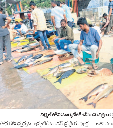
నిర్మల్ లోని మార్కెట్ లో చేపలను విక్రయిస్తున్న గంగుత్తులు

నిర్మల్, సెప్టెంబర్ 11(నమస్తే తెలంగాణ) : నిర్మల్ జిల్లాలో 548 చెరువులతోపాటు కడప, స్వర్ణ, ఎస్సా రెస్కూ, గడ్డెన్నవారు ప్రాజెక్టుల్లో ప్రభుత్వం మత్స్యశాఖ యేటా చేప పిల్లలను వదులుతూ ఉంటుంది. 240 మత్స్య సహకార సంఘాల్లోని 13,300 మంది సభ్యులు చేపపిల్లల పెంపకంపై ఆధారపడి జీవిస్తున్నారు. అయితే ఈసారి 4.15 కోట్ల చేప పిల్లలను జలాశయాల్లో వదలాలని అత్యధికంగా పెట్టుకున్నారు. ఇప్పటికే రెండు సార్లు టెండర్లను పిలిచినప్పటికీ చేప పిల్లలను సరఫరా చేసే వ్యాపారులు ముందుకు రావడం లేదు. గత కేసీఆర్ ప్రభుత్వంలో పక్కా డి.ప్రణాళికతో నిర్మల్ గా సాగిన చేపపిల్లల పంపిణీతో మత్స్యకారులు ఆర్థికంగా ఎదిగారు. పెంచిన చేపలను మార్కెట్ కు తరలించి విక్రయించేందుకు అవసరమైన వాహనాలు, వలలను సబ్సిడీ పై అందజేసి గత ప్రభుత్వం మత్స్యకారులకు అండగా నిలిచింది. అయితే ప్రస్తుత కాంగ్రెస్ ప్రభుత్వం మాత్రం ఇప్పటి వరకు చేప పిల్లల పంపిణీ ఊహిత పోవడంతో మత్స్యకారులు ముందస్తుకు వచ్చారు.