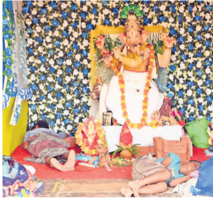
ఏ గూడు లేని ఆ చిన్నారలకు వినాయక మండపమే ఆవాసంగా మారింది. నీఎం రేవంత్ రెడ్డి తమ ఆవాసాలను కూల్చేయడంతో ఎక్కడ నిద్దరించాలో తెలియక వినాయక మండపంలోనే సేద తీరుతున్న చిన్నారలు.