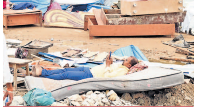
వదసిన వరువుపైనే సేదతీరుతున్న స్థానికుడు