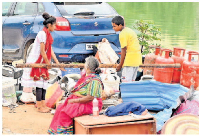
సామగ్రిని పక్కకు పెడుతూ తల్లిదండ్రులకు సహకరిస్తున్న చిన్నారులు.