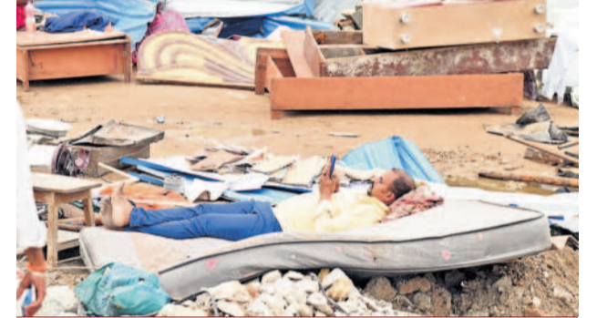
వదసిన వరుపువైనే సేదతీరుతున్న స్థానికుడు