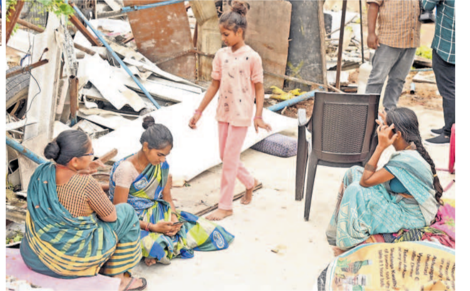
చెల్లూ చెదురైన ఆవాసాలను చూస్తూ కన్నీటి పర్యంతమవుతున్న మహిళలు.