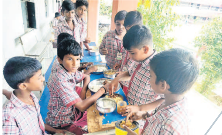
ఇంటి నుంచి తెచ్చుకున్న భోజనం తింటున్న విద్యార్థులు

ర్శలను ఖండించారు. ఎటువంటి కెమికల్స్ గానీ, రసాయన పదార్థాలు వినియోగించడం లేదని స్పష్టం చేశారు. పాల్యాషన్ కంట్రోల్ బోర్డు అనుమతులతో శాస్త్రీయంగా పర్యావరణానికి ఎటువంటి హాని లేకుండా పాలు, పాల పదార్థాలు ప్రాసెస్ చేస్తున్నామని తెలిపారు. బాయిల్ చిమ్నీ ద్వారా బూడిద పైకి వస్తుందని, పాగ్ వ్యాప్తి జరుగుతుందని చేసిన ఆరోపణను కొట్టిపారేశారు. చిమ్నీ బూడిద ద్వారా పాగ్ బయటకు వ్యాప్తి చెందదని, ఇది కూడా పాల్యాషన్ కంట్రోల్ బోర్డు సూచన మేరకు నడుస్తుందన్నారు. పాలు, ఇతర పదార్థాల తయారీ ప్రాసెస్ నిమిత్తం వినియోగించే నీటిని ఎంపుయెంట్ ట్రీట్ మెంట్ ప్లాంట్ (ఈటీఎం) ద్వారా శుద్ధి చేస్తూ తిరిగి డెయిలీ అవసరాలకు వినియోగిస్తున్నామని, దీని వల్ల ఎలాంటి గ్రౌండ్ వాటర్ పాల్యూషన్ కాదని స్పష్టం చేశారు. డెయిలీపై లక్ష మంది పాడి రైతుల ఆధారపడి ఉన్నారని, ఈ నేపథ్యంలో డెయిలీపై అసత్య ఆరోపణలు చేసే వారు ఒకటి రెండుసార్లు ఆలోచించుకోవాలని సూచించారు. డెయిలీలో ప్రతి పని నిబంధనలకు లోబడి మాత్రమే ఉందని, అసత్య ఆరోపణలను ప్రజలెవ్వరూ నమ్మువద్దని విజ్ఞప్తి చేశారు.