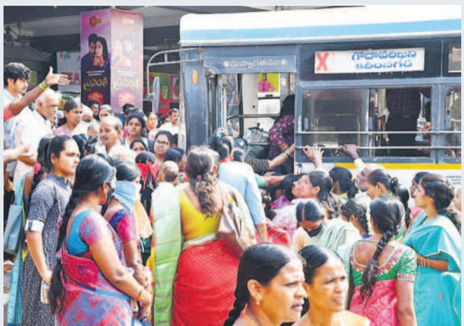
కఠినగర్ బస్ స్టేషన్ లో బస్సు కుతున్న మహిళలు

ఆర్టీసీలో మహిళా పథకం పురుషులకు కష్టాలు తెచ్చిపెట్టిందా..? ప్రయాణం కోసం వారు ప్రత్యామ్నాయ మార్గాలు వెతుక్కోవాల్సి వస్తున్నదా..? ఫలితంగానే ఆర్టీసీలో ప్రయాణించే మగవాళ్ల రేషియో తగ్గిందా..? గతంలో పోలిస్ సీన్ లివర్స్ అయిందా..? అంటే అప్పుడనే సమాధానమే వస్తున్నది. గడిచిన ఎనిమిది నెలల్లో కఠినగర్ రీజియన్ లో ప్రయాణించిన వారి సంఖ్య దీనికి నిదర్శనం! నిజానికి మహిళా పథకం రాక ముందు.. బస్సుల్లో మహిళలకన్నా పురుషుల సంఖ్య అధికంగా ఉండేది. అప్పటి రేషియో ప్రకారం చూస్తే దాదాపు 65 శాతం పురుషులు, 35 శాతం మహిళలుండే వారు. కానీ, ప్రే ప్రయాణంతో మహిళల సంఖ్య రెట్టింపుకాగా, పురుషుల సంఖ్య క్రమేపీ తగ్గుతున్నది. ఎనిమిది నెలల కాలంలో రీజియన్ లోని 11 డివిజన్ పరిధిలో 9.46 కోట్ల మంది ప్రయాణిస్తే.. అందులో 67.11 శాతం మంది మహిళలు, కేవలం 32.88 శాతం మంది పురుషులుండడం గమనార్హం!