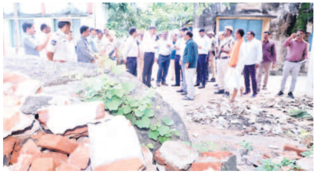
ఖమ్మం మోతీనగర్లో దెబ్బతిన్న సమూహాలను పరిశీలిస్తున్న కేంద్ర బృంద అధికారులు