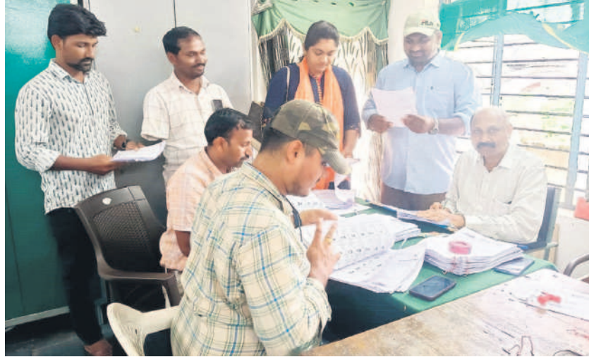
డ్రాఫ్ట్ నోటిఫికేషన్ విడుదల కోసం ఓటర్ల జాబితాను సిద్ధం చేస్తున్న మండల అధికారులు

భద్రాద్రి కొత్తగూడెం, సెప్టెంబర్ 12 (నమస్తే తెలంగాణ) : పర్సనల్ పదవీ కాలం ఇప్పటికే ముగిసినందున పల్లెపోరు కోసం అధికారులు సన్నద్ధమవుతున్నారు. ఇందుకోసం ముందస్తుగానే ఓటర్ల జాబితాను