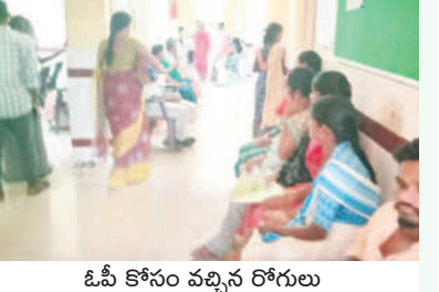
ఓపీ కోసం వచ్చిన రోగులు

దుమ్ముగూడెం, సెప్టెంబర్ 12 : ఏజెన్సీలోని ప్రాథమిక ఆరోగ్య కేంద్రాలను సిబ్బంది కొరత వేదిస్తున్నది. వర్షాకాలంలో పూర్తిస్థాయిలో వైద్య సిబ్బంది ఉండేనే నిత్యం జ్వరాలు, వివిధ వ్యాధులతో ఆస్పత్రులకు వచ్చే రోగులకు పూర్తి స్థాయిలో సేవలు అందేది. అయితే ఏజెన్సీ ప్రాంతంలోని దుమ్ముగూడెం, నర్సాపురం ప్రాథమిక ఆరోగ్య కేంద్రాల్లో వైద్యులు, సిబ్బంది కొరత తీవ్రంగా ఉన్నది. దీంతో వైద్యం కోసం వచ్చే రోగులకు అంతంత మాత్రంగానే వైద్య సేవలు అందుతున్నాయి. నర్సాపురం పీహెచ్సీలో ల్యాబ్ టెక్నిషియన్ పోస్టు ఖాళీగా ఉంది. దుమ్ముగూడెం పీహెచ్సీలో మెడికల్ అధికారి, ఇద్దరు స్టాఫ్ నర్సులు, ఫార్మాసిస్టు, ముగ్గురు ఏఎన్ఎంలు, స్టీవ్, వర్షాల పీహెచ్సీలో స్టాఫ్ నర్సు, ముగ్గురు ఏఎన్ఎం పోస్టులు ఖాళీగా ఉన్నాయి. నర్సాపురం పీహెచ్సీలో స్టీవ్ మిషన్ అందుబాటులో ఉన్నప్పటికీ పని చేయడం లేదు. ల్యాబ్ టెక్నిషియన్ పోస్టు ఖాళీగా ఉండడంతో టీహెచ్ డ్యూరా రక్త పక్షుల నిర్ధారణ కోసం రోగులను కొత్తగూడెం పంపాలిని పరిస్థితి ఏర్పడింది. ఆయా పీహెచ్సీలో పోస్టులు ఖాళీగా ఉండడంతో కొందరు ఏఎన్ఎంలు అన్ని తామె వ్యవహారాలను అరకొరగా రోగులకు రక్ష, ఇతర పరిక్షలు నిర్వహిస్తున్నారు.