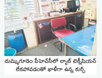
దుమ్ముగూడెం పీహెచ్సీలో ల్యాబ్ టెక్నిషియన్ లేకపోవడంతో ఖాళీగా ఉన్న కుర్చీ

ప్రైవేటు ఆస్పత్రులకు ధీమా పీహెచ్సీలో ఆధునిక వైద్య పరికరాలు ఉన్నప్పటికీ వాటి నిర్వహణ సరిగా లేకపోవడంతో రోగులకు వైద్యం అందని ద్రాక్షగా మారింది. సీటీసీ మిషన్ అందుబాటులో ఉన్నా నిర్ధారణ పరిక్షల కోసం కొత్తగూడెం టీహెచ్ వెళ్లాలి రావడంతో రోగులు అసహనం