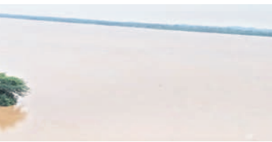
భద్రాచలం వద్ద నిలకడగా గోదావరి నీటి ప్రవాహం

బూర్గంపహాడీ (భద్రాచలం), సెప్టెంబర్ 12 : ఎగువ ప్రాంతాల నుంచి వరద ఉధృతి తగ్గడంతో భద్రాచలం వద్ద గోదావరిపై శాంతించింది. నీటి ప్రవాహం నిలకడగా కొనసాగుతోంది. గురువారం ఉదయం 6 గంటలకు 44.8 అడుగుల వద్ద ఉన్న గోదావరి ప్రవాహం 11 గంటలకు 42.7 అడుగులకు చేరడంతో అధికారులు మొదటి ప్రమాద హెచ్చరికను ఉపసంహరించుకున్నారు. ఎగువ వర్షాలు తగ్గడం వరద తీవ్రత ఆగిపోవడం.. శ్రీరాంసాగర్, కడెం ప్రాజెక్టులోపాటు సమృద్ధి, సారపాక బ్యారేజీ వద్ద వరద ఉధృతి తగ్గడంతో శాంతించిన ప్రాజెక్టు వద్ద కూడా వరద ప్రవాహం క్రమక్రమంగా తగ్గుతూ వచ్చింది. భద్రాచలం వద్ద నాయంతం 4 గంటలకు 41.70 అడుగులకు నీటిమట్టం చేరుకోవడంతో ప్రమాదం నిలకడగా ఉంది. శిబిర వద్ద వరద ఉధృతి తగ్గి గోదావరి శాంతించడంతో అధికారులు ఉపసంహరించుకున్నారు. దీంతో తత్తీనిగడ్, ఒడిశా, ఆంధ్రప్రదేశ్ ప్రాంతాలకు వానానాల రాకపోకలను అధికారులు పునరుద్ధరించే అవకాశం ఉంది.