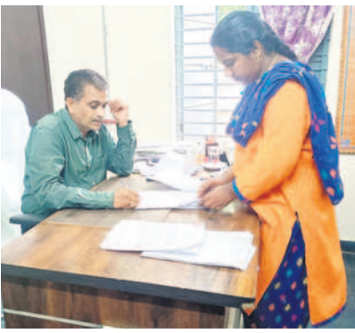
ఓటర్ల జాబితాను సిద్ధం చేస్తున్న లక్షిణిపల్లి మండల అధికారులు

భద్రాద్రి కొత్తగూడెం, సెప్టెంబర్ 12 (నమస్తే తెలంగాణ) : పర్సనల్ పదవీ కాలం ఇప్పటికే ముగిసినందున పల్లెపోరు కోసం అధికారులు సన్నద్ధమవుతున్నారు. ఇందుకోసం ముందస్తుగానే ఓటర్ల జాబితాను